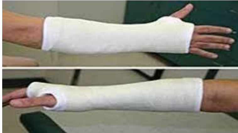
Slika 2.5.1.1.1 Imobilizacija sadrenim zavojem

Sadrenje se vrši na sobnoj temperaturi. Potrebna je dobra vještina postavljanja sadrenih zavoja jer se sadra vrlo brzo suši i stvrdnjava, već nakon 6 minuta sadreni povoj je tvrd i nije ga moguće modelirati. [1]