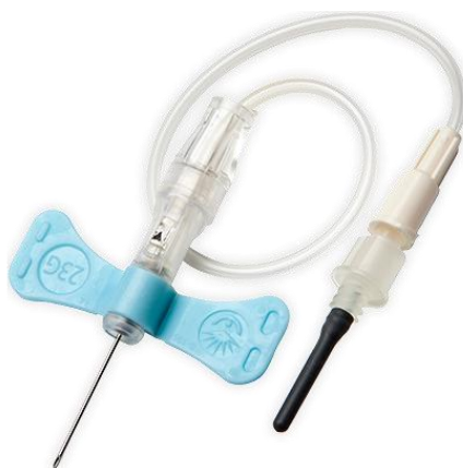
Slika 6.2.2. Bebi leptirić set sa zaštitnim mehanizmom