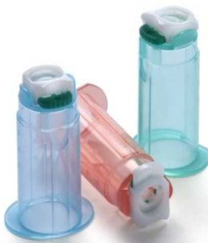
Slika 6.2.3. Sigurnosni držači igala s mehanizmom odbacivanja igle