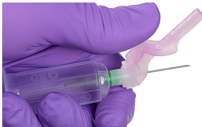
Slika 6.2.1. Sigurnosna hipodermalna igla

Tako se u novije vrijeme u postupku venepunkcije koriste sigurnosne hipodermalne igle (prikazano na slici 6.2.1.) koje pružaju jednostavan i učinkovit način prikupljanja krvi te pomažu smanjiti mogućnost uboda. Nadalje, bebi leptirić set sa zaštitnim mehanizmom koji nudi mogućnost sigurnosne uporabe igle koja se uvlači automatskim mehanizmom pritiskom na gumbić (prikazano na slici 6.2.2.) te sigurnosni držači igala s mehanizmom odbacivanja igle (prikazano na slici 6.2.3.) [15].