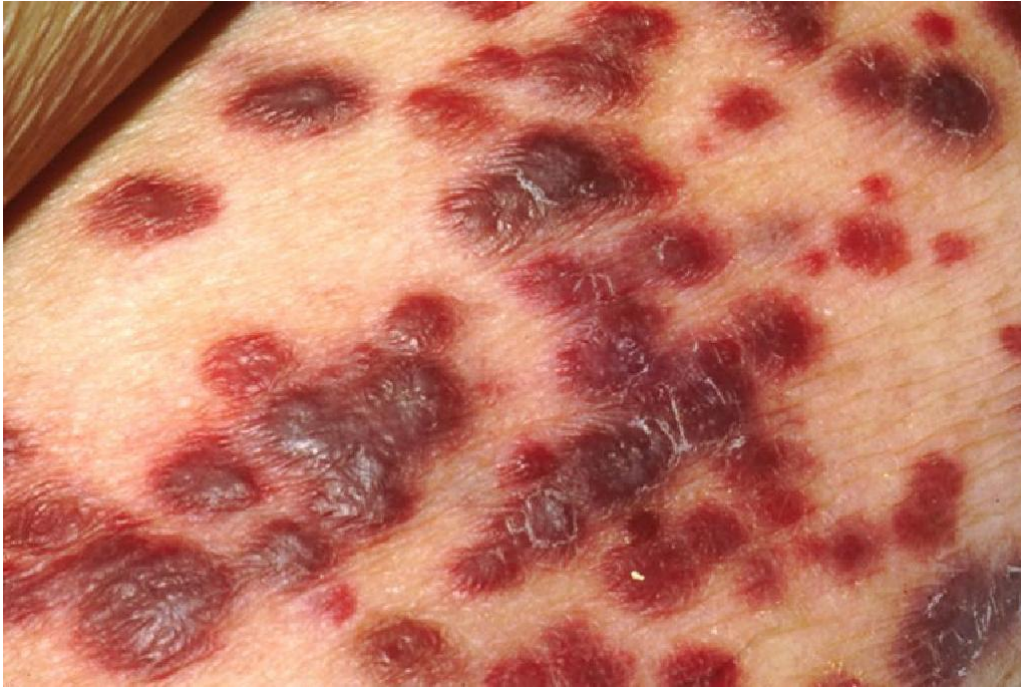
Slika 4.3.1. Kaposijev sindrom u osobe oboljele od HIV infekcije. Preuzeto na: https://www.krenizdravo.hr/zdravlje/bolesti-zdravlje/kaposijev-sarkom-simptomi-lijecenje-i-prognoza , 26.8.2021.