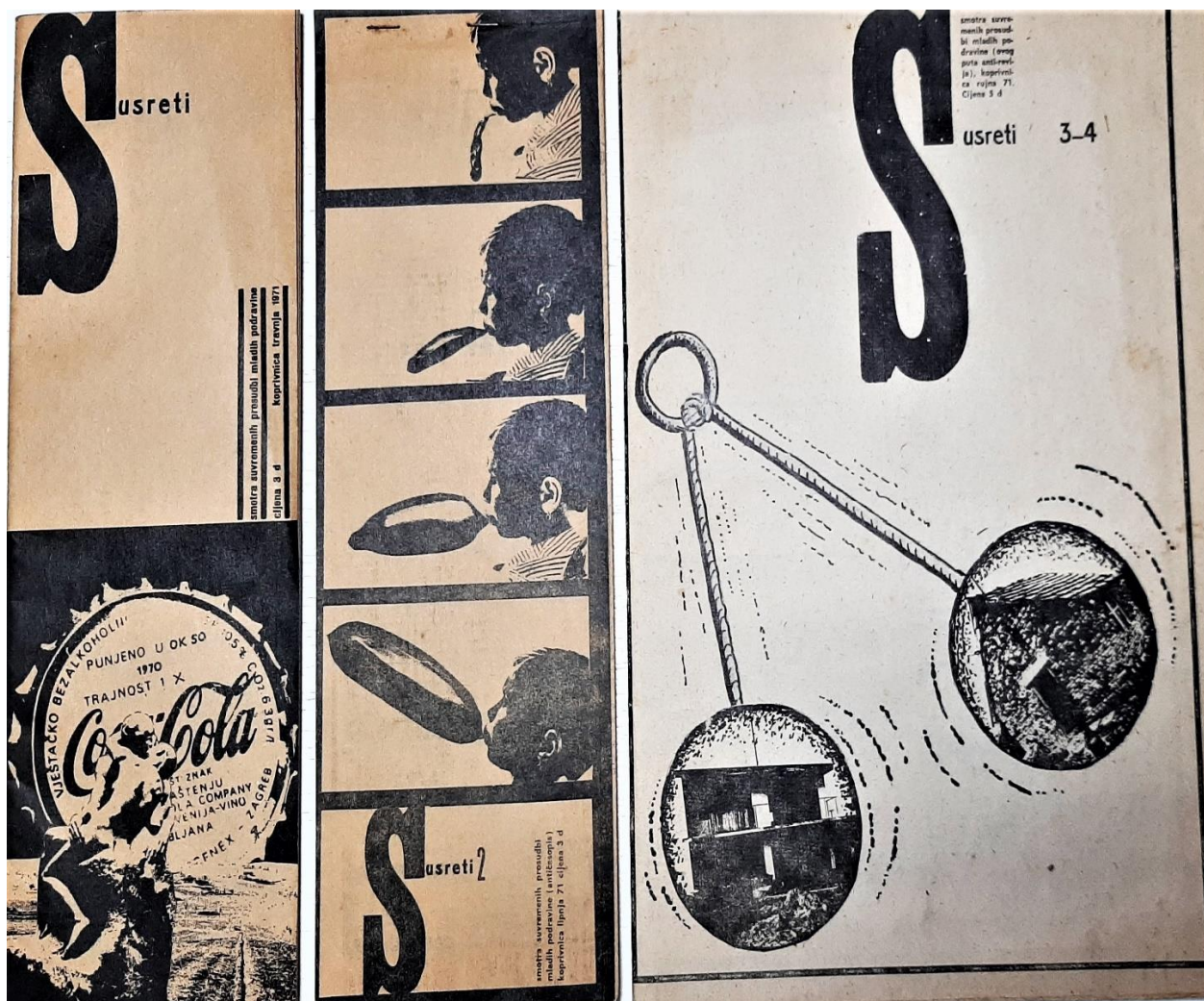
Slika 5.1.1. Susreti – naslovnice sva tri sveska

dobro zabavljala, pripremajući lokalnim dužnosnicima i najrazličitijim uglednicima nova neugodna iznenađenja.