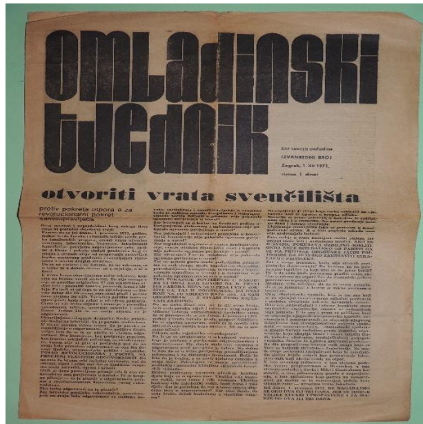
Slika 3.1. Omladinski tjednik - izvanredni broj, 1971.