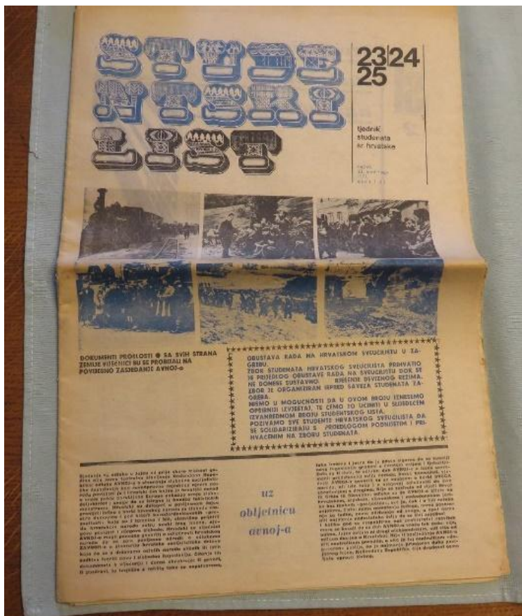
Slika 3.4.1. Studentski list – 23. studenoga 1971., broj 23-24-25

List je na svojim stranicama afirmirao mnogobrojne javne i kulturne radnike, publiciste, književne, likovne i kazališne kritičare, humoriste i karikaturiste. Za hrvatsko je novinarstvo bio izvanredna novinarska škola iz koje su za zagrebačke i hrvatske medije dolazile nove generacije talentiranih novinara. Priloge je u listu od samoga početka objavljivao i širok broj intelektualaca izvan sveučilišta i izvan Zagreba, što je s priličnim zanimanjem pratila i šira javnost. Premda se afirmirao kao studentsko glasilo, prihvatili su ga i sveučilišni nastavnici kao informatora i komentatora sveučilišnih zbivanja. List je izlazio na šest do dvanaest stranica, a tijekom burnog razdoblja 1971. list je bio svojevrsno studentsko ogledalo tog razdoblja hrvatske povijesti. Podupirao je opće političke zahtjeve u smjeru pluralističkog razvoja Hrvatskog proljeća.