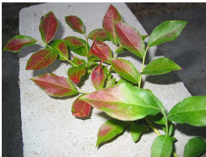
Slika 6. Promjena boje listova borovnice