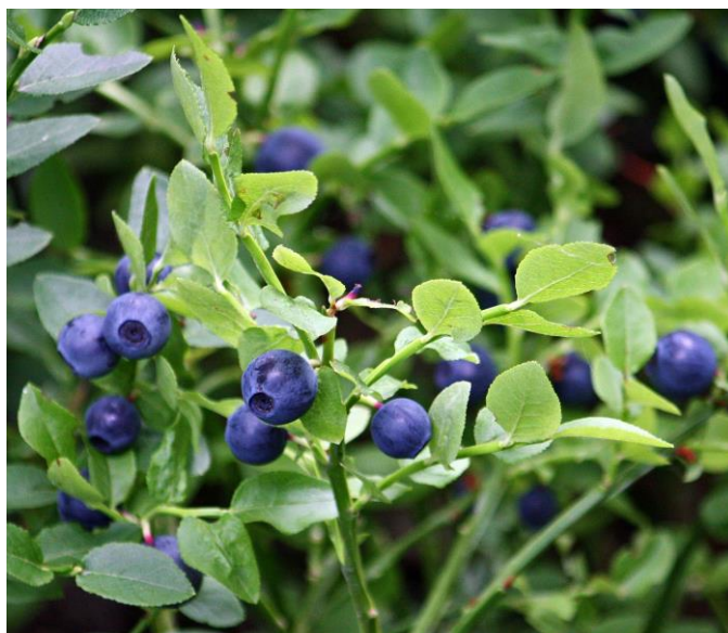
Slika 1. Vaccinium myrtillus