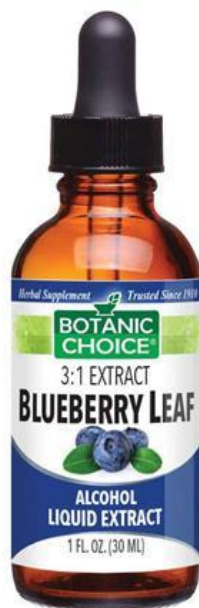
Slika 11. Ekstrakt lista borovnice