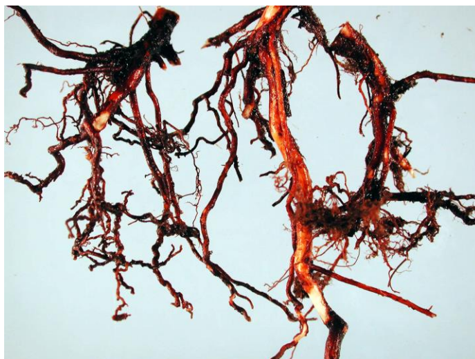
Slika 4. Korijen V. corymbosum

količina ukupnog prinosa. Suša uzrokuje izostajanje novih izbojaka i odumiranje rodni pupova. Pri pojavi suše brzo dolazi do gubitka vode što uzrokuje oštećenja lišća (Ebert, 2005).