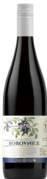
Slika 9. Vino od borovnice

Ono je dragocjeno protiv akutnih i kroničnih oboljenja crijeva i želuca koji nastaju kao posljedica lučenja probavnih sokova, apsorbira i otapa otrovne tvari iz crijeva, sprječava razvoj bakterija štiteći crijevnu floru, stimulira mišiće crijevnog kanala i djelotvorno je kod osjećaja slabosti i lošeg apetita. Uzimanje vina od borovnice u odgovarajućoj količini može pomoći u izlječenju postojećeg čira ili hemoroida. Također, vino od borovnica ima marginalno veći antioksidativni kapacitet od crnog vina i bijelog vina pa vino od borovnica može biti moćnije od crvenog vina u prevenciji bolesti srca (Yang i sur., 2012).