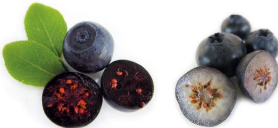
Slika 8. Prerez europske i američke borovnice

U plodu borovnice možemo pronaći i do 65 sitnih sjemenki koje većina njih nisu razvijene. Veličina sjemenki ovisi o vrsti i sorti borovnice (Mratinić, 2015.).