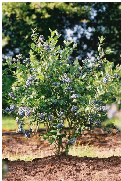
Slika 5. Stablo V. corymbosum