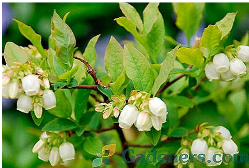
Slika 7. Cvijet borovnice