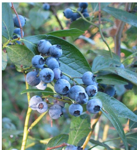
Slika 2 Vaccinium corymbosum

Vaccinium corymbosum ili kultivirana borovnica, još ima naziv i kao američka borovnica od koje su do danas oplemenjivači izdvojili velik broj gospodarski vrijednih sorata. „Uzgoj borovnice počeo je u SAD-u 1893. godine, a u Hrvatskoj su prve američke borovnice posađene 1964. godine“ (Purgar i sur., 2007). Preduvjet za dobar uzgoj ove vrste je kiselo tlo u kojem pH mora biti između 3,8 i 4,8.