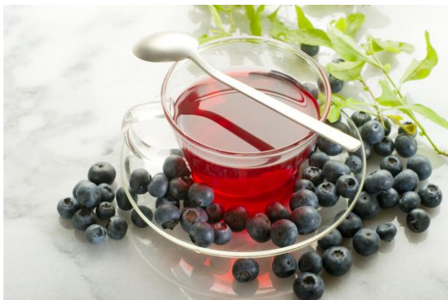
Slika 10. Čaj od borovnice

Za pripremu čaja od borovnice, koriste se različiti dijelovi biljke, a najčešće listovi, svježi ili suhi plodovi. Čaj od borovnice je ukusan, osvježavajući napitak koji ima niz zdravstvenih učinaka na zdravlje organizma. On jača imunitet, pomaže kod probavnih tegoba, umiruje upalne procese debelog crijeva, pomaže kod proljeva i dijabetesa, tako što snižava razinu šećera u krvi. Čaj od listova se koristi protiv povraćanja, želučanih grčeva, kašlja, za smanjenje mokraćnih kiselina u organizmu te također eksterno za ispiranje sluzokože u ustima (Purgar i sur., 200).