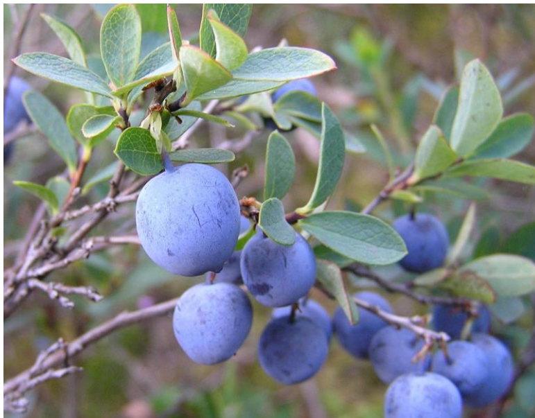
Slika 3. Vaccinium uliginosum

kojeg izbijaju grane koje oblikuju grmove. Okus boba močvarne borovnice je u odnosu na okus obične borovnice ( V. myrtillus ) poprilično bljutav, a i u terapiji se koristi rjeđe zbog sporog djelovanja bez obzira što ova vrsta ima jednaka ljekovita svojstva poput obične borovnice.