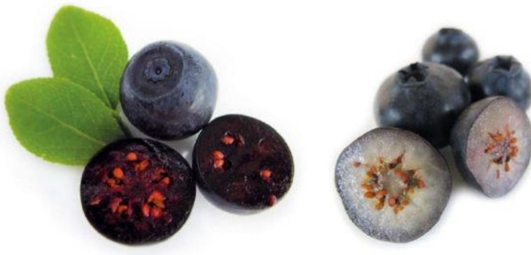
Slika 8. Prerez europske i američke borovnice

U plodu borovnice možemo pronaći i do 65 sitnih sjemenki koje većina njih nisu razvijene. Veličina sjemenki ovisi o vrsti i sorti borovnice (Mratinić, 2015.).