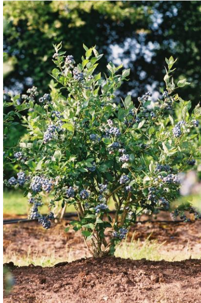
Slika 5. Stablo V. corymbosum