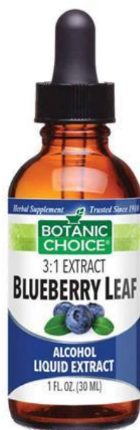
Slika 11. Ekstrakt lista borovnice