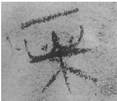
Slika 7.2.1: BTK (potpis)

Dennis Rader, poznat i kao BTK ( bind, torture, kill ), ubio je 10 žrtava između 1974. i 1991. godine. Većina njegovih žrtava bile su odrasle žene, u dobi od 21 do 62 godine. Međutim, on je također ubio dvoje djece, zajedno s njihovom majkom i ocem. Iako nije silovao nijednu od svojih žrtava, seksualna priroda Raderovih zločina očituje se u slovu B uobličenom kao dojke u potpisu koji je koristio u pismima koja je slao policiji i medijima.