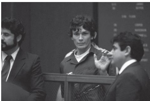
Slika 7.1.1: Richard Ramirez pokazuje sotonistički simbol na sudu

Mnogi serijski ubojice traže priznanje javnosti i aktivno sudjeluju u stvaranju vlastite javne slike. Dobar primjer toga je Richard Ramirez, kojega su novinari prozvali „Night Stalker“. Ramirez je između lipnja 1984. i kolovoza 1985. godine ubio najmanje 13 ljudi. Muškarci su strijeljani ili zadavljeni, a žene silovane i unakažene. Za sebe je tvrdio da je sotonist. Na mjestima zločina kao osobni potpis ostavljao je okultne simbole poput obrnutog pentagrama nacrtanog na zidu ružem za usne žrtve. Nikad se nije pokajao zbog svojih zločina. Umjesto toga, ponosio se njima. Nakon uhićenja, svom sotonskom imidžu u javnosti pridonio je noseći crno i sunčane naočale tijekom suđenja. Volio je pozornost novinskih medija i igrao se okupljenima. Na izricanju presude pohvalio je Lucifera, a sucu, porotnicima i svima u sudnici poručio kako su crvi i licemjeri (Bonn 2014: 189-190).