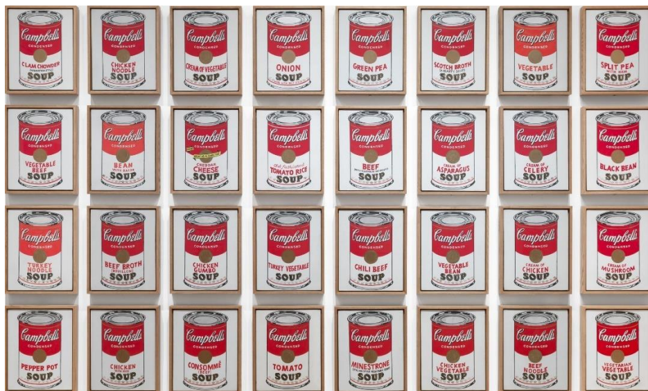
Slika 2.5 Andy Warhol: Campbell's Tomato Soup (1968)

Postmodernisti često koriste masovno proizvedene objekte na jednostavne i ponekad banalne načine čak i kada su im ciljevi i ideje iznimno kompleksni. Kao primjer možemo uzeti Andy Warhola i njegov komentar na masovnu produkciju i komercijalne aspekte „visoke“ umjetnosti kroz reprodukciju seta kutija za juhu (Campbell's Soup Boxes). Ali, moramo uzeti u obzir da ovdje Warhol očigledno prati modernističku tradiciju ready-made-a , koju je inicirao Marcel Duchamp. [4]