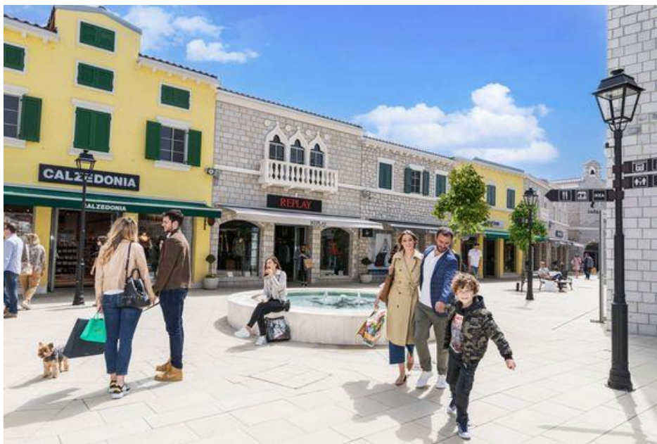
Slika 5.1 Designer Outlet Croatia

Primjer simulacije može se vidjeti u raznim „shopping outlet-ima“ koji su oblikovani kao „gradovi u malom“. Unutar ograda „outlet-a“ možemo naići na trg sa fontanom, pekare, kioske sa novinama i svi dućani su „dizajnirani“ da u tom kontekstu podsjećaju na gradsku ulicu. I tako se podrazumijeva da zajedno s proizvođačima, tj. prodavačima sudjelujemo u toj simulaciji grada gdje je društvena djelatnost (jedina) „shopping“.