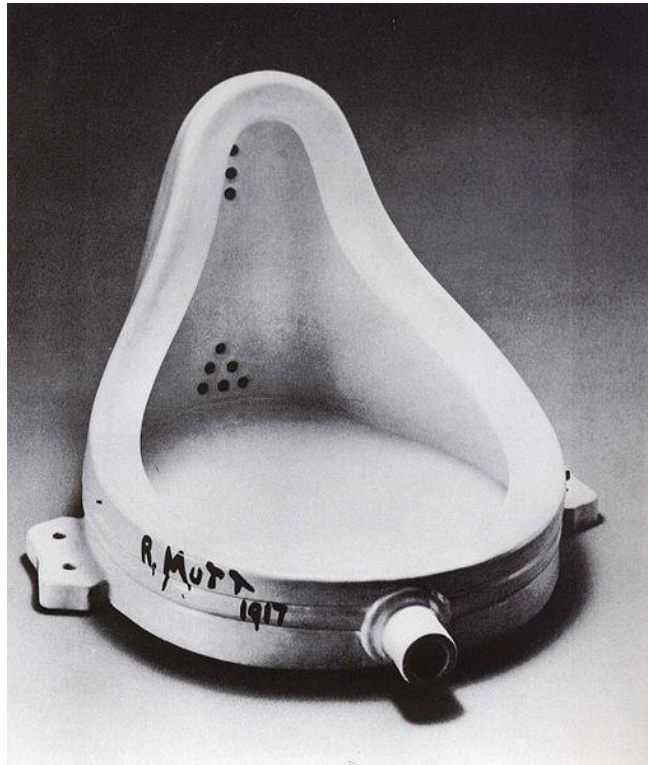
Slika 2.1 Marcel Duchamp – „Fontana“

„predstavljajući“ individualnost, no postmoderni umjetnik (Duchamp) je počeo stvarati umjetnost koja nije „predstavljala“, već je izražavala „ideju. [5]