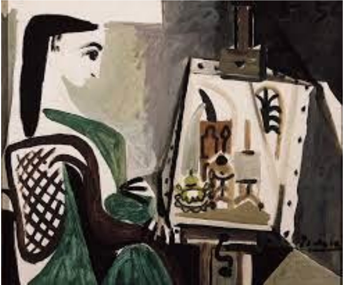
Slika 2.3 Pablo Picasso: Žena u studiju (1956)

Autorefleksija je također postala trend u marketingu (koji je dio teme ovoga rada). Mnogi brendovi prihvaćaju postojeće percepcije skeptičnog dijela javnosti koje koriste u marketingu na „komičan“ način. Tako brendovi potrošački skepticizam (postmodernizam) okreću u svoju korist.