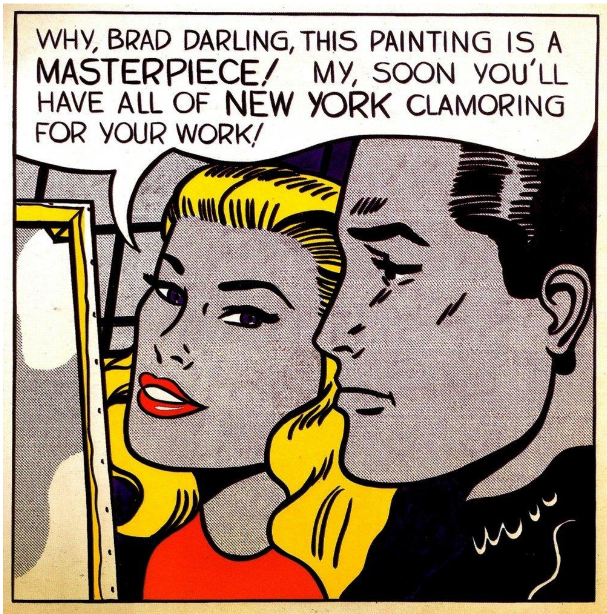
Slika 2.2 Roy Lichtenstein: Remek - djelo (1962)

postmodernizmu, samorefleksivne strategije mogu se pronaći i u visokoj (ozbiljnoj) umjetnosti ali i u različitim manifestacijama popularne kulture, od „Seinfelda“ do MTV-a. [4]