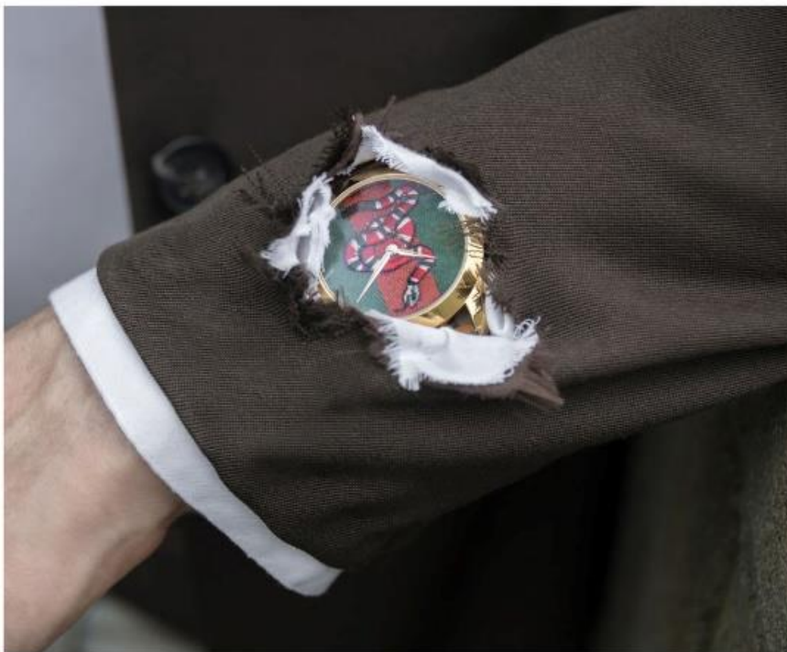
Slika 2.4 Brend Gucci promovira kolekciju satova putem „mema“

When you got that new watch and have to show it off