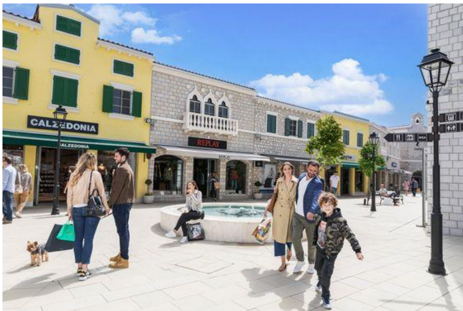
Slika 5.1 Designer Outlet Croatia

Primjer simulacije može se vidjeti u raznim „shopping outlet-ima“ koji su oblikovani kao „gradovi u malom“. Unutar ograda „outlet-a“ možemo naići na trg sa fontanom, pekare, kioske sa novinama i svi dućani su „dizajnirani“ da u tom kontekstu podsjećaju na gradsku ulicu. I tako se podrazumijeva da zajedno s proizvođačima, tj. prodavačima sudjelujemo u toj simulaciji grada gdje je društvena djelatnost (jedina) „shopping“.