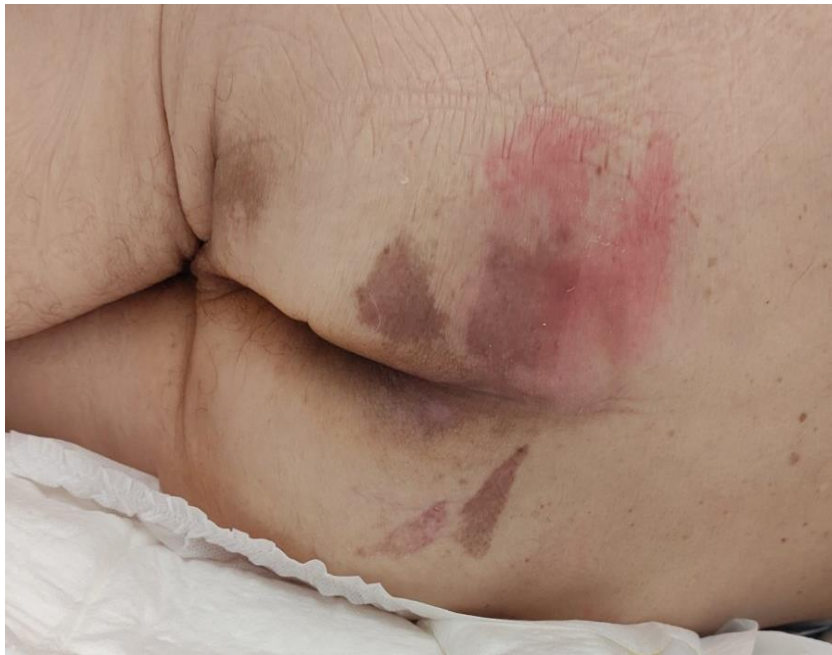
Slika 3.3.1.3.1. Prvi stupanj dekubitusa