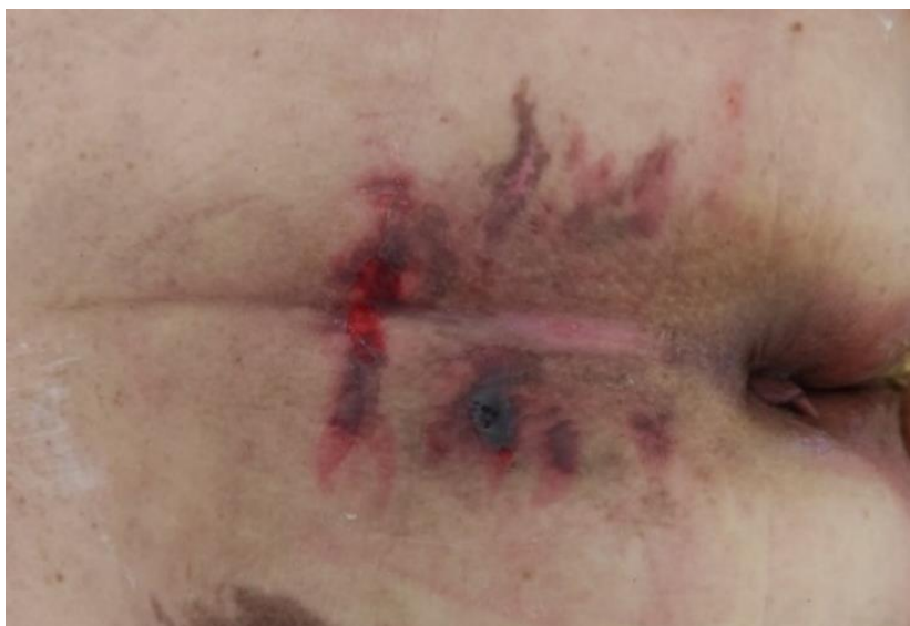
Slika 3.3.1.3.2. Drugi stupanj dekubitusa

Epidermis i dermis zahvaćeni su drugim stupnjem dekubitusa. Karakteriziran je stanjenjem kože, crvenilom koje napreduje do cijanoze te pojavom mjehura i blagog oštećenja kože [11]. U ovom stadiju najvažnija je njega kože te primjena različitih sredstava kako bi se spriječilo daljnje širenje [11].