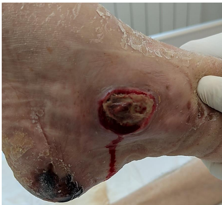
Slika 3.3.1.3.3. Treći stupanj dekubitusa

Kada dođe do toga da je zahvaćeno čitavo potkožno tkivo, epidermis i dermis, tada se govori o trećem stupnju dekubitusa. Smeđa boja kože je karakteristična za ovo stanje, uz prisutnost pojačane pigmentacije okolnog tkiva rane. Specifično za ovu fazu je i postojanje nekroze te vidljivost samoga mišića. U ovom stadiju česta je pojava infekcije, a najvažnije je potaknuti cijeljenje rane i spriječiti infekciju [11].