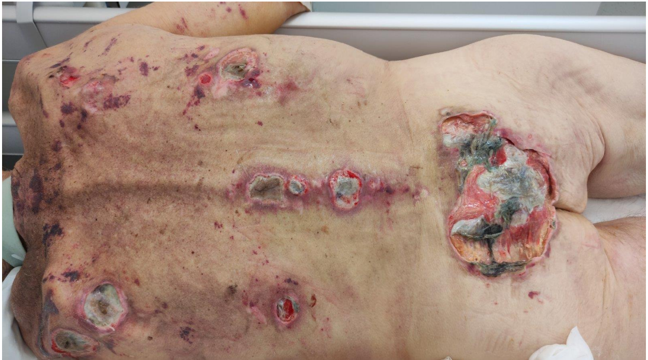
Slika 3.3.1. Prikaz dekubitusa svih stupnjeva na predilekcionim mjestima