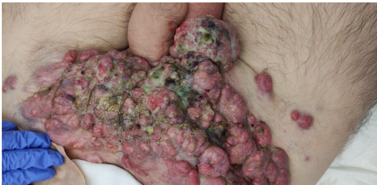
Slika 3.4.3. Maligna rana

Kod malignih rana uobičajeno je i krvarenje. Bilo koji obloga ili zavoj koji dolazi u neposredni kontakt s površinom maligne rane, prilikom skidanja mogu oštetiti površinu rane. To se može spriječiti pomoću mrežice od sintetičkih polimera te neprijanjajućih obloga za ranu [15].