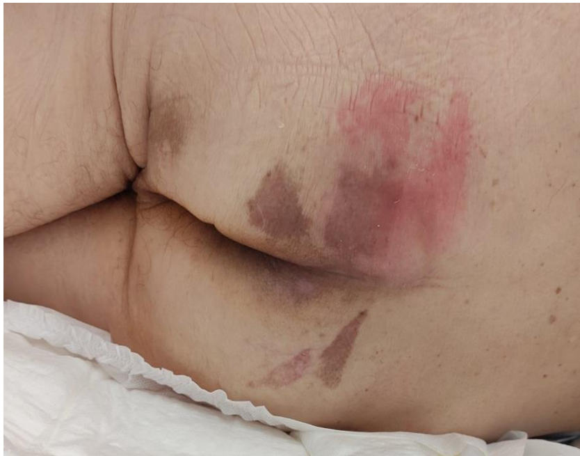
Slika 3.3.1.3.1. Prvi stupanj dekubitusa