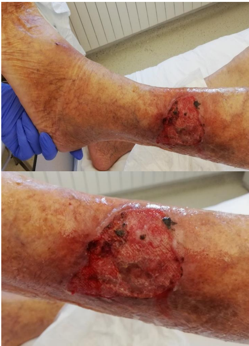
Slika 3.3.2. Venski ulcus

Venski ulcus najčešće nastaje na unutarnjoj strani distalne trećine potkoljenice, mjestu pritiska ili ranije traume, području pete i plantarnoj strani stopala [8]. Bolest započinje pojavom bule iz koje se javlja gnojna sekrecija. Na taj način nastaje kronična rana koja se s vremenom počinje širiti po površini kože. Cijeljenje rane je dugotrajan i intenzivan proces, a najvažnija metoda liječenja venskog ulcusa je primjena adekvatne kompresivne terapije [4, 15].