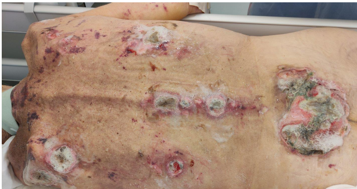
Slika 6.2. Kronične rane (dekubitusi) tretirani 3% vodikovim peroksidom