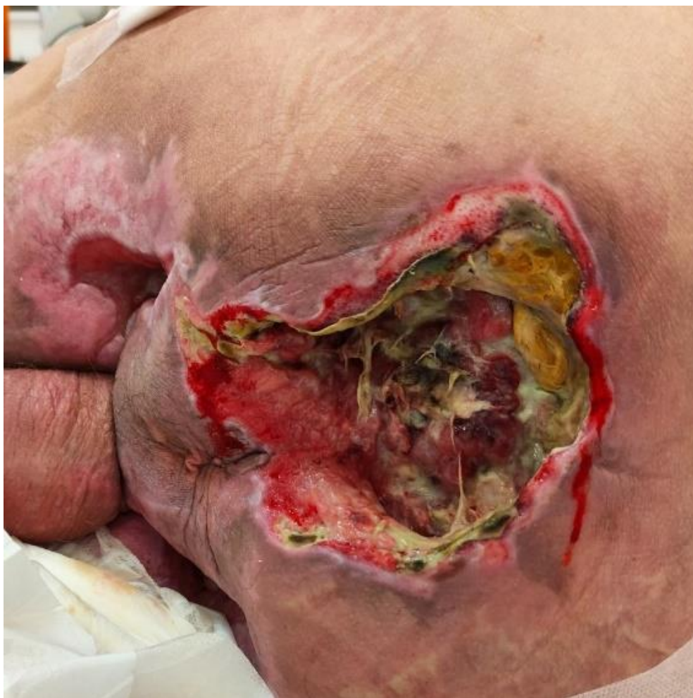
Slika 3.3.1.3.4. Četvrti stupanj dekubitusa