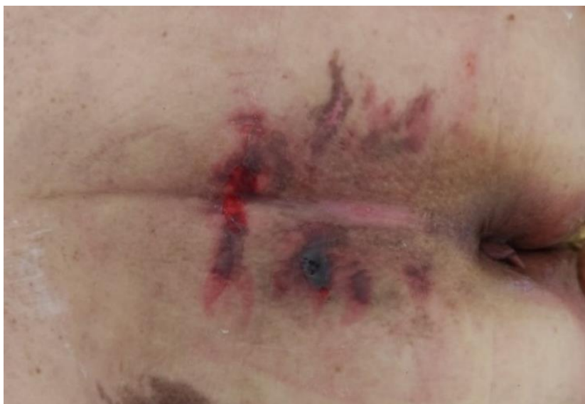
Slika 3.3.1.3.2. Drugi stupanj dekubitusa

Epidermis i dermis zahvaćeni su drugim stupnjem dekubitusa. Karakteriziran je stanjenjem kože, crvenilom koje napreduje do cijanoze te pojavom mjehura i blagog oštećenja kože [11]. U ovom stadiju najvažnija je njega kože te primjena različitih sredstava kako bi se spriječilo daljnje širenje [11].