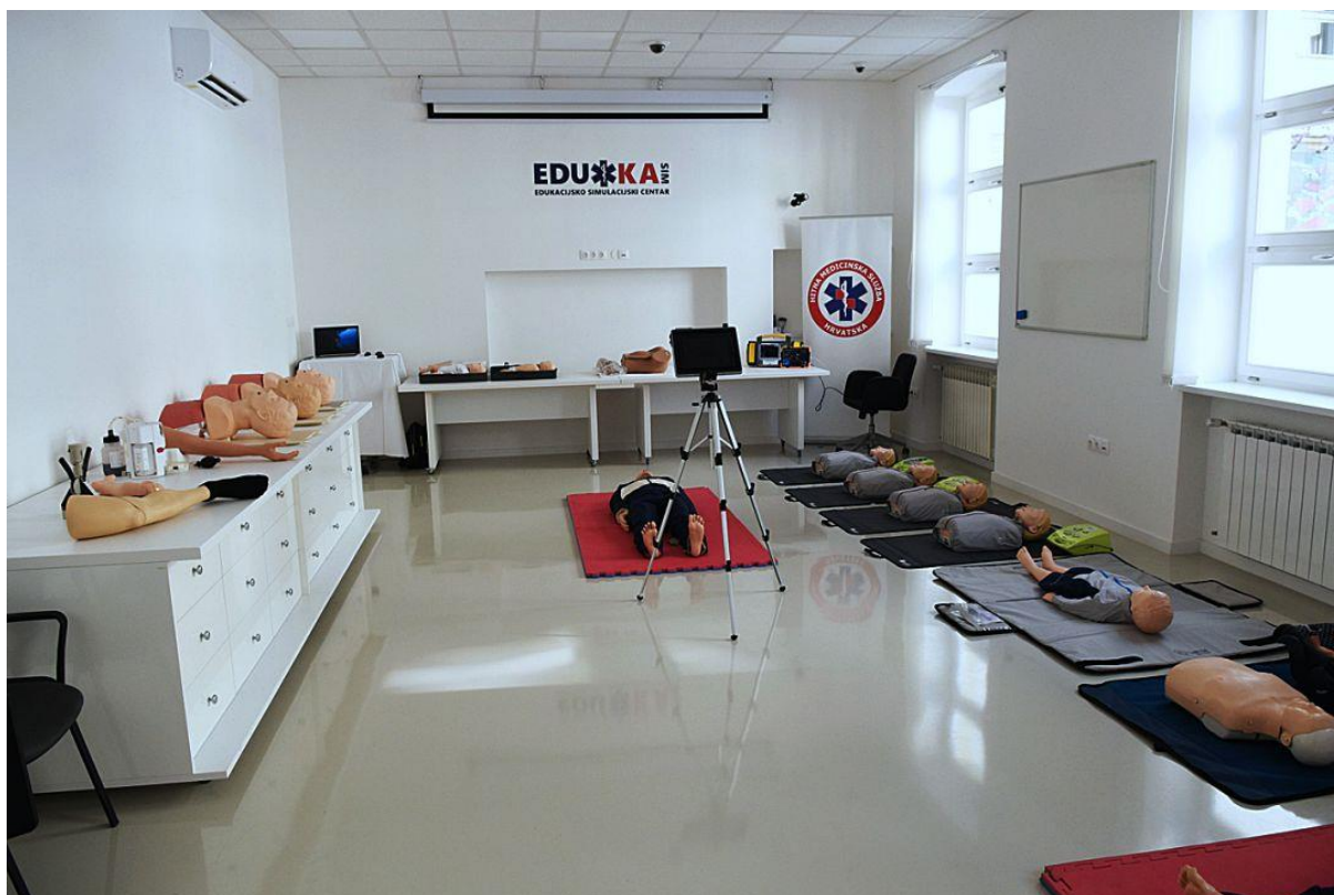
Slika 8 Dvorana za vježbanje EDUKA-SIM centra