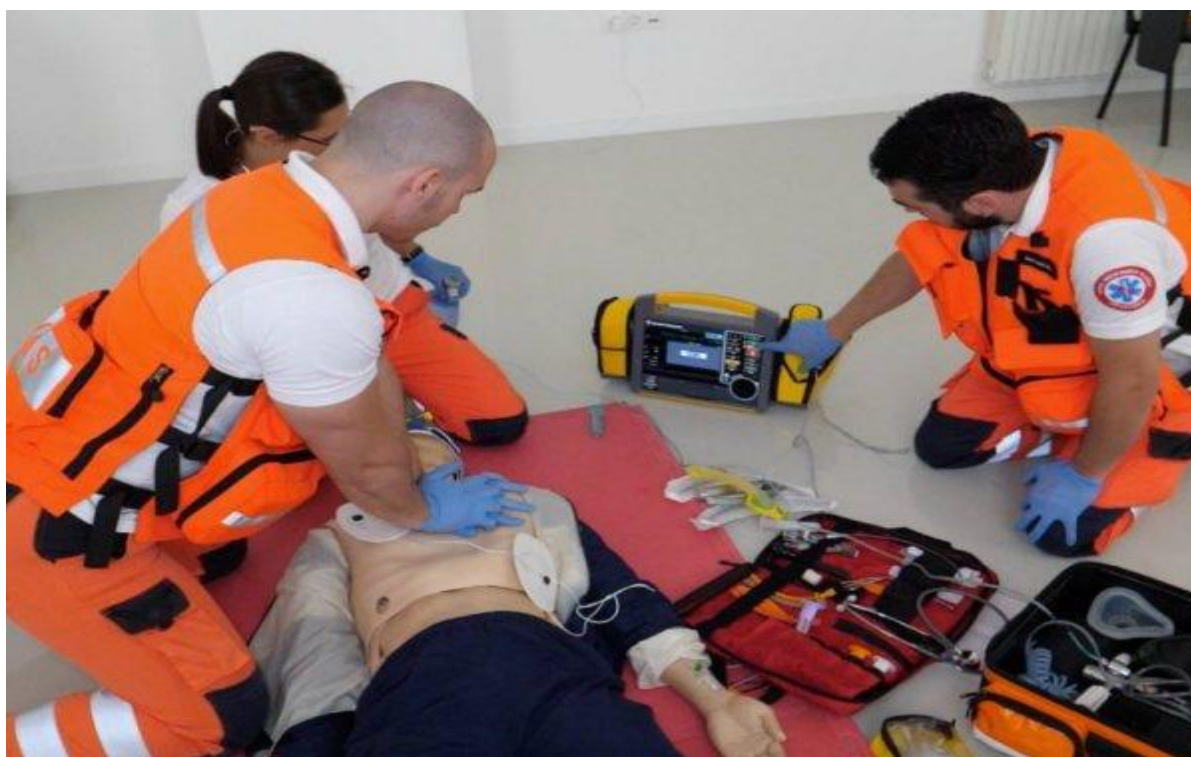
Slika 6 Simulacija reanimacije