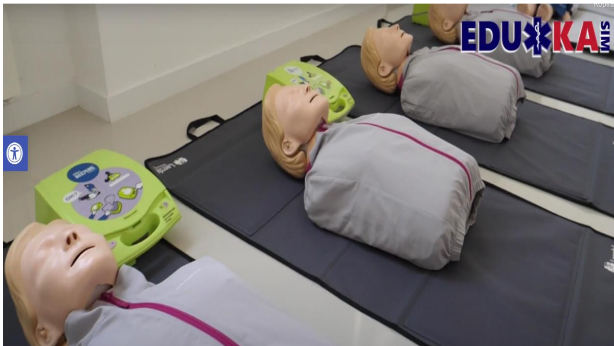
Slika 7 Modeli za vježbanje