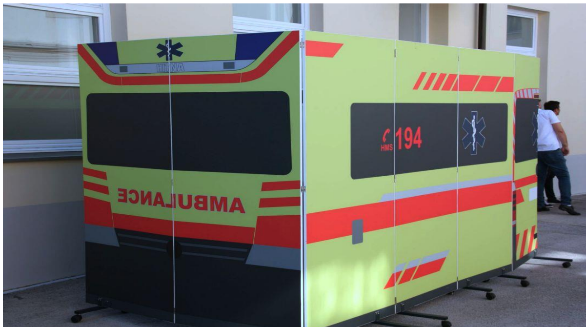
Slika 5 Edikacijsko simulacijsko vozilo