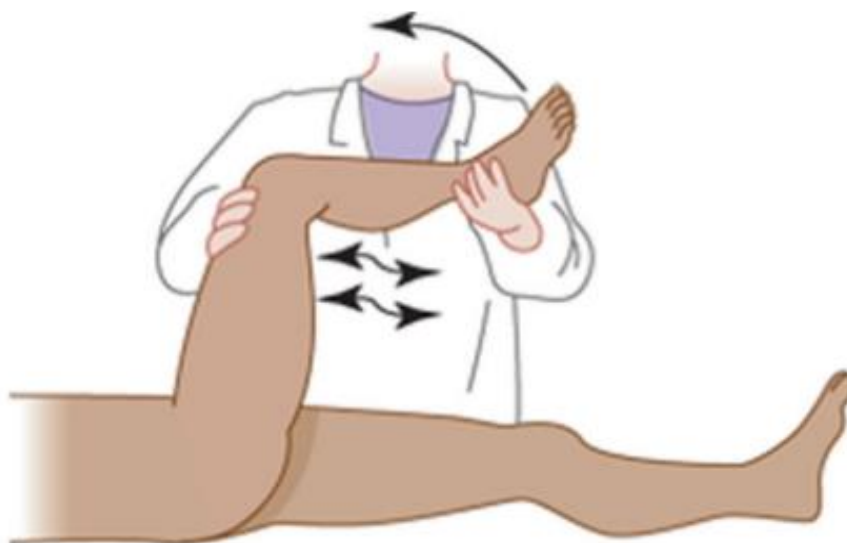
Slika 3.3.1. Kernigov znak