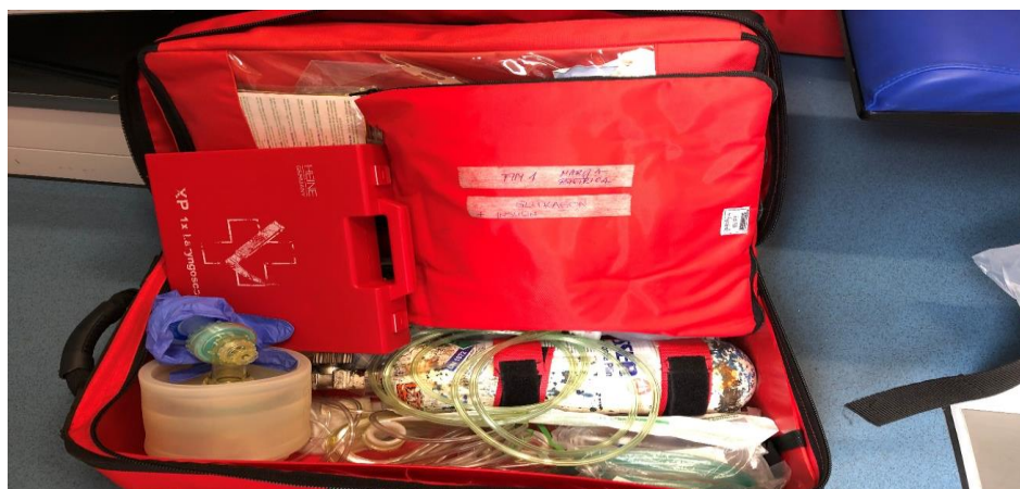
Slika 2.2.1. Torba za kardiopulmonalnu reanimaciju i ALS

Ukoliko tijekom prvog pregleda uočimo da se pacijent nalazi u stanju životne opasnosti, prioritet je samo brzo ABC zbrinjavanje, za takvog pacijenta vrijeme je presudno. [4]