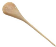
Slika 3.1. Igla za provjeru kvalitete pršuta

Kontrola mirisa pršuta provjerava se u pomoć igle od konjske kosti koja omogućuje kontrolu arome bez otvaranja cijelog pršuta. Karakteristika igle od konjske kosti je ta da zapravo u porama zadržava aromu iz pršuta[9].