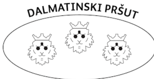
Slika 4.3. Grafički prikaz znaka dalmatinskog pršuta

Pršut za oznakom zemljopisnog podrijetla „Dalmatinski pršut“ smije se stavljati na tržište nakon završetka faze zrenja i nakon odobrenja od strane certifikacijskog tijela. Na tržište se može stavljati kao cijeli pršut ili u komadima, prilikom čega mora biti pravilno narezan i upakiran u zatvorenu ambalažu. Nakon završetka faze zrenja na pršute koje je certificirano tijelo označilo kao u skladu sa svim specifikacijama, nanosi se vrući žig. Masa pršuta u trenutku stavljanja žiga mora iznositi minimalno 6,5 kg. Znak Dalmatinskog pršuta je ovalnog oblika unutar kojeg se nalaze tri lavlje glave, a iznad gornjeg oboda piše „Dalmatinski pršut“ [7].