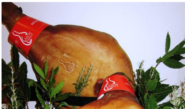
Slika 4.6. Krčki pršut

Krčki pršut je trajni suhomesnati proizvod koji nosi zaštićenu oznaku zemljopisnog podrijetla (od 14. travnja 2015. godine) koji se proizvodi isključivo na području otoka Krka. U to područje spada Grad Krk, općine Baška, Malinska – Dubašnica, Omišalj, Punat i Vrbnik, te se samo na njihovim područjima smije proizvoditi ova vrsta pršuta [10].