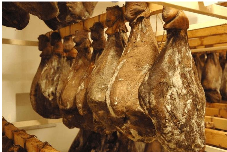
Slika 4.4. Istarski pršut

Istarski pršut je trajni suhomesnati proizvod sa zaštićenom oznakom izvornosti od 2002. godine. Proizvodi se u unutrašnjosti istarskog poluotoka, najviše na području između Pazina i Poreča [9].