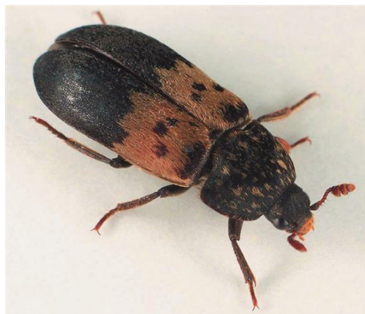
Slika 7.2. Štetnik slaninska gagrica

Sljedeći štetnici koji napadaju pršut su slaninske gagrice, odnosno kukci crne boje koji buše površinu pršuta i ulaze u unutrašnjost. Prisutnost ovih štetnika odaju kanali na površini pršuta, a mogu se otkriti udaranjem pršuta o tvrdu površinu nakon čega ličinke ovog štetnika same izlaze. Kanali s ličinkama se pažljivo mogu izrezati i ukloniti iz pršuta [1].