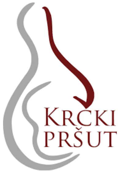
Slika 4.7. Grafički prikaz znaka krčkog pršuta