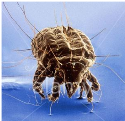
Slika 7.3. Štetnik grinja

Grinje su još jedan veliki štetnik pršuta. Njihova invazija započinje u fazi zrenja ili skladištenja pršuta, kada ulaze u pukotine i šupljine te nagrízaju i izmetom onečišćuju pršut. Njihovu prisutnost odaju praškaste nakupine na površini pršuta, ali vrlo se brzo šire i teško se uništavaju. Redovito čišćenje i optimalni uvjeti tijekom zrenja i skladištenja su najbolja prevencija pojave grinja [1].