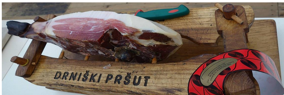
Slika 4.8. Drniški pršut

Drniški pršut je trajan suhomesnati proizvod koji se nalazi na listi proizvoda sa zaštićenom oznakom zemljopisnog podrijetla od 23. srpnja 2015. godine. Proizvodi se u gradu Drnišu i okolici koja obuhvaća općine Ružić, Promina, Biskupija i Unešić na području Šibensko – kninske županije koja je poznata po proizvodnji pršuta još od davnina [8].