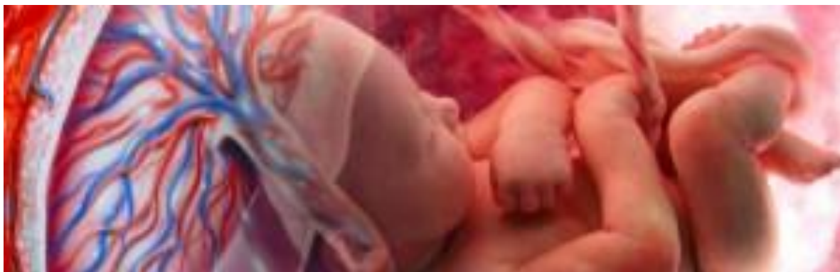
Slika 3.2.1 Posteljica i dijete u utrobi

Svrha posteljice je osiguravanje optimalnih uvjeta za razvoj fetusa. Funkcije posteljice su: izmjena plinova i tvari između ploda i majke, posteljica štiti plod od infekcija te štetnih vanjskih utjecaja, služi za proizvodnju hormona čija je uloga očuvanja trudnoće i razvoj ploda. Posteljica osigurava barijeru među fetusa i majke zbog imunoloških odgovora na implantaciju. U procesu razvoja posteljice dolazi do stvaranja i implantacije blastociste, diferencijacije trofoblasta te ulazak trofoblasta u krvne žile endometrija, te vaskulogeneze i angiogeneze posteljice [17]. Posteljica teži do 1 kilogram. Prosječno teži 500 grama. Posteljica je povezana sa kapilarama dugim 51.5 kilometara koje se povezuju sa stjenkom maternice i preko njih iz majčina krvotoka posteljica uzima kisik i hranu, ali također odbacuje otpadne tvari. Posteljica posjeduje majčinu i fetalnu stranu. Kroz posteljicu svake minute proteče oko 20% majčine krvi. Kada bi posteljicu rastegnuli u potpunosti, bila bi dugačka 36 do 45 metara. Iako je ona izgledom kao disk, tkivo joj je iznimno naborano. Kada bi se tkivo izravnalo, dobila bi se površina jedne manje prostorije [18].