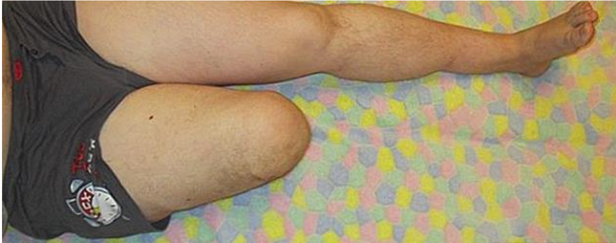
Slika 2.3.1. Primjer amputacije donjeg ekstremiteta kod dijabetesa.

Međutim, amputacije se provode i za niz drugih razloga, uključujući prirodni nedostatak udova, vaskularnu insuficijenciju, rak i traumatske ozljede. Iako se osobe s amputiranim udovima suočavaju s velikim tjelesnim, socijalnim i emocionalnim prilagodbama, prilagodba se među pojedincima jako razlikuje [17].