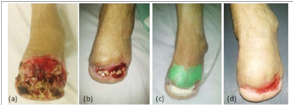
Slika 3.1.1. Primjer ponovne amputacije nakon poslijeoperacijske infekcije.

Infekcija bataljka poslije amputacije česta je pojava i može zahtijevati ponovnu amputaciju, što pacijenta dovodi u daljnje ozbiljne komplikacije (Slika 3.1.1.) [20].