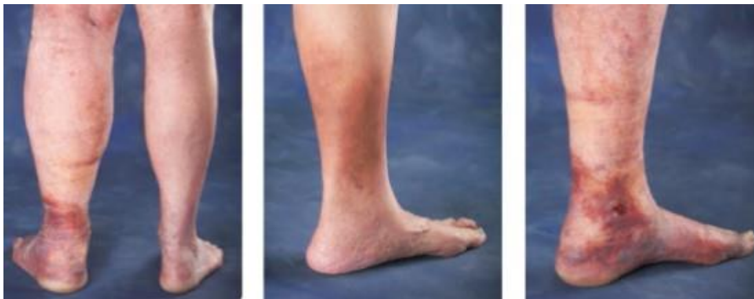
Slika 2.1.1. Manifestacija kronične venske bolesti; edem potkoljenice, hiperpigmentacija kože i razvoj ulkusa

Venski ulkusi uglavnom su plitki i nepravilnih rubova te sadrže granulacijsko ili fibrinsko tkivo [18]. Ponekad mogu obuhvatiti i područje cijele potkoljenice ekstremiteta [14]. Simptomi su tipično lošiji na kraju dana. Venski ulkusi na nogama skloni su infekcijama te mogu napredovati do celulitisa, pogoršanja boli i povećanog eksudata [15].