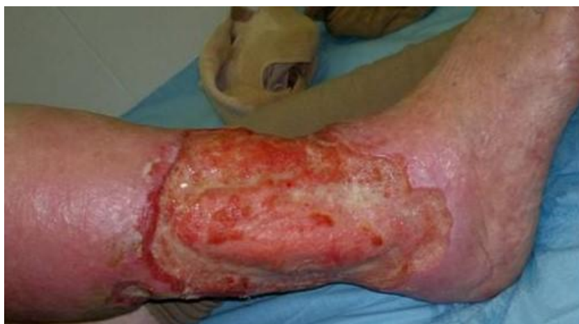
Slika 2.1.2. Venski ulkus potkoljenice

(Izvor: https://northpointemedical.com/2017/10/13/varicose-vein-treatment/ , dostupno 15.09.2021.)