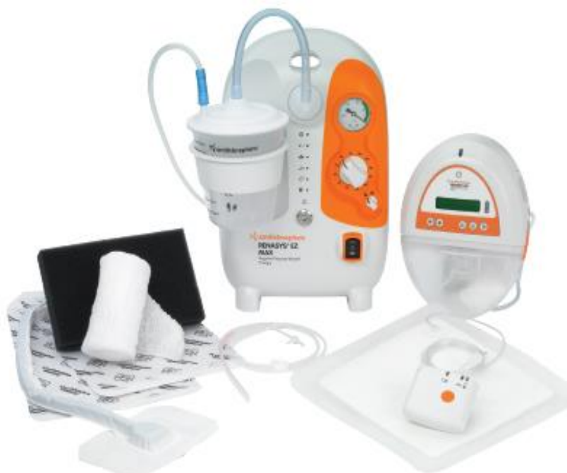
Slika 3.1.1. Sustav za primjenu terapije negativnim tlakom