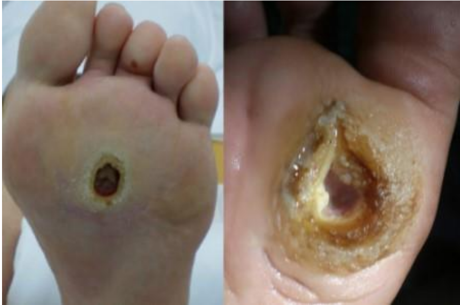
Slika 2.3.1. Neutrofični ulkus

Prvi korak u zacjeljivanju dijabetičkog neuropatskog ulkusa je učiniti debridman do zdravog tkiva koje krvari. Jedna od najbitnijih komponenti za učinkovito cijeljenje neuropatskih ulkusa je smanjiti pritisak na zahvaćeno područje, a smanjenje tlaka iz rane treba biti uravnoteženo s poticanjem pravilne cirkulacije ekstremiteta [24].