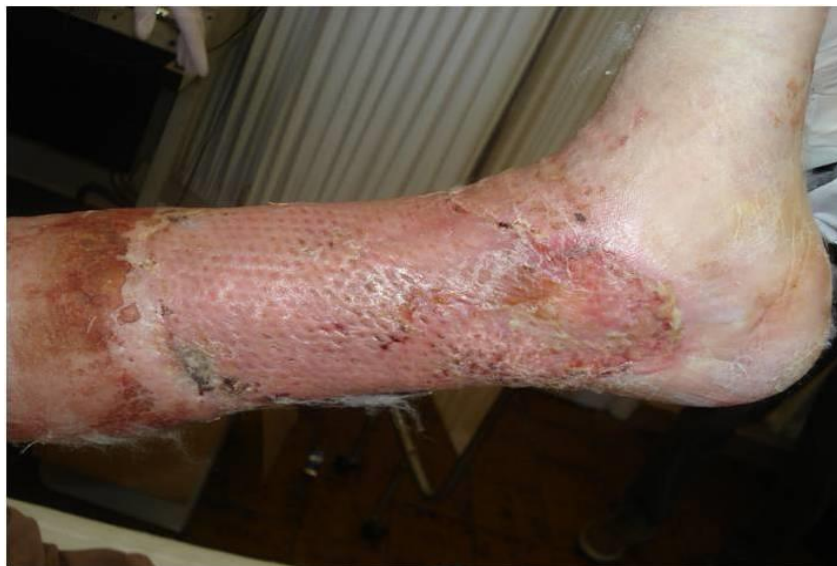
Slika 5.2. Prikaz uspješne transplantacije kože