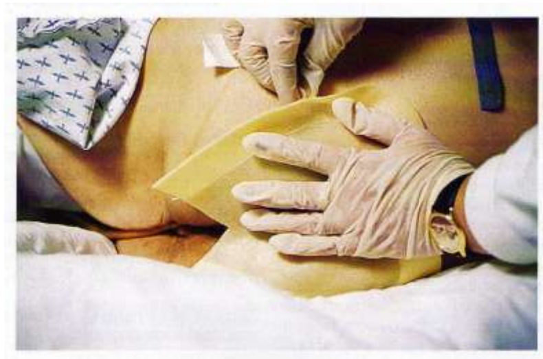
Slika 7.3.1.1. Pravilno apliciranje hidrokoloida sa samoljepivim rubom

Hidrokoloidi su okluzivni, samoljepivi oblozi (slika 7.3.1.1.) koji u strukturi imaju kombinaciju karboksimetilceluloze, želatine i pektina, a prekriveni su poliuretanskim filmom. Primjenjuju se za rane sa srednjom i slabijom sekrecijom. U kontaktu sa sekretom rane nastaje gel koji stvara optimalne uvjete za cijeljenje i potiče autolitički debridman stvarajući vlažan medij. Oblog se mora promijeniti kada gel procuri s ruba.