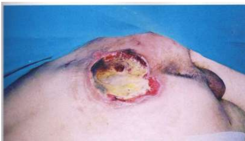
Slika 2.3. Stadij 3. Dekubitus na sakrumu prekriven nekrozama

Potpuni gubitak debljine tkiva. Potkožno masno tkivo može biti vidljivo, ali kost, tetiva ili mišić nisu izloženi/obuhvaćeni. Mrtvo tkivo može biti prisutno, ali ne zasjenjuje debljinu gubitka tkiva (slika 2.3.). Dubina dekubitusa varira prema anatomskom položaju. Most nosa, uho, zatiljak nemaju potkožno tkivo pa treći stadij može biti plitki. S druge strane, na područjima veće debljine mogu se razviti izuzetno duboki dekubitusi trećeg stadija. Kost i tetive nisu vidljive ili izravno opipljive [4].