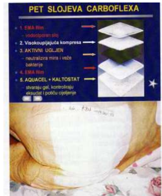
Slika 7.3.5.1. Struktura jednoga od obloga s aktivnim ugljenom

aplikacije i ritam izmjene takvoga obloga bitno se razlikuje kod obloga različitih proizvođača. To ovisi o strukturi obloga i o njegovim značajkama (slika 7.3.5.1.). Primjenjuje se tako da se nakon ispiranja rane fiziološkom otopinom izravno aplicira na ranu. Koristi se kod rana s jakom eksudacijom i intenzivnim mirisom.