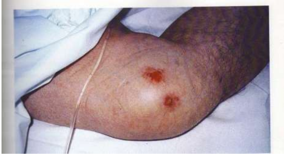
Slika 2.1. Stadij 1. Dekubitalnoga vrijeda na koljenu