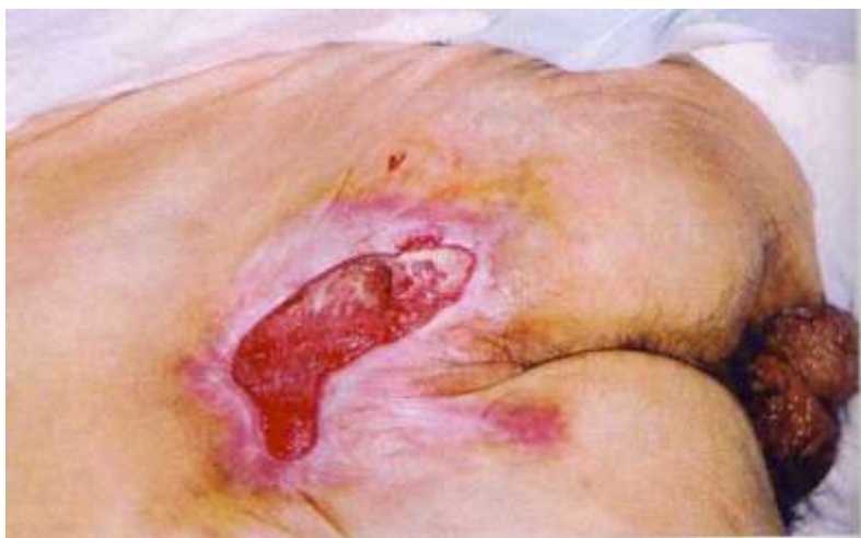
Slika 2.2. Stadij 2. Dekubitusa s torpidnim rubovima i granulacija

Djelomično stanjenje kože koje zahvaća epidermis, dermis ili oboje. Vrijed zahvaća površinske slojeve i klinički se očituje abrazijom, pojavom mjehura ili plitkim kraterom [3]. Dublji dijelovi kože često su zahvaćeni promjenama (slika 2.2.). Briga za nastajanje vrijeda sastoji se u primjeni odgovarajućih obloga, zaštiti i održavanju čistoće područja koje je promijenjeno. Briga o njezi kože mora biti vrlo intenzivna, a sastoji se, osim primjene uobičajenih mjera i u primjeni različitih sredstava kojima se nastoji spriječiti pogoršanje lokalnoga statusa. Tada se očekuje i brzo zacijeljivanje.