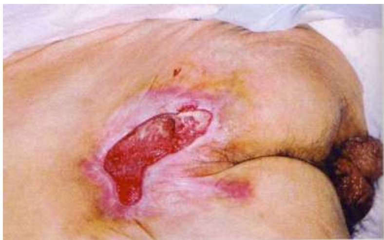
Slika 2.2. Stadij 2. Dekubitusa s torpidnim rubovima i granulacija

Djelomično stanjenje kože koje zahvaća epidermis, dermis ili oboje. Vrijed zahvaća površinske slojeve i klinički se očituje abrazijom, pojavom mjehura ili plitkim kraterom [3]. Dublji dijelovi kože često su zahvaćeni promjenama (slika 2.2.). Briga za nastajanje vrijeda sastoji se u primjeni odgovarajućih obloga, zaštiti i održavanju čistoće područja koje je promijenjeno. Briga o njezi kože mora biti vrlo intenzivna, a sastoji se, osim primjene uobičajenih mjera i u primjeni različitih sredstava kojima se nastoji spriječiti pogoršanje lokalnoga statusa. Tada se očekuje i brzo zacijeljivanje.