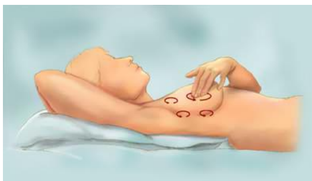
Slika 5.1.2.2. Palpacija u ležećem položaju

Dojku je podijeljena na četvrtine ili kvadrante zamišljajući okomice kroz bradavicu. Razlikujemo gornji unutarnji, gornji vanjski, donji unutarnji i donji vanjski kvadrant. Svaku kvadrant dojke treba popipati temeljito u dva smjera, a tek nakon pregleda svih kvadranta pojedinačno treba pipati cijelu dojku. Kružnim pokretima u smjeru kazaljke na satu, a potom u suprotnom smjeru. Samopregled još obuhvaća palpaciju limfnih čvorova i kontrolu eventualnog iscjetka iz dojki. [9]