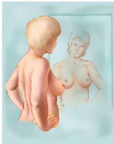
Slika 5.1.1.1. Inspekcija kada ruke obuhvate struk

Kod inspekcije treba dobro pogledati dojke u ogledalu. Pregledava se izgled kože i bradavica, pomičnost dojki kod podizanja obje ruke. Stati ispred ogledala i pažljivo promotriti dojke. Najprije sprijeda kada su ruke ispružene uz tijelo. Promatrati dojke najprije iz prednje strane, a zatim s boka. Zatim s obje ruke obuhvati struk te u tom položaju promatrati dojke kao što je prikazano na slici 5.1.1.1.