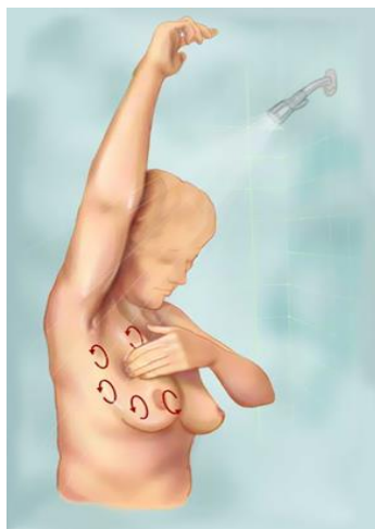
Slika 5.1.2.1. Palpacija u stojećem položaju