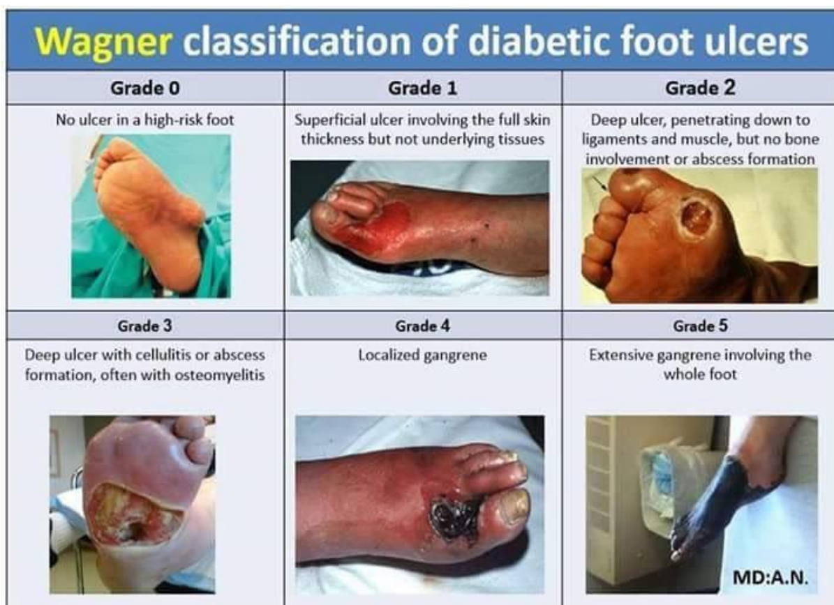
Slika 5.2.: Prikaz stupnjeva dijabetičkog stopala po Wagneru,