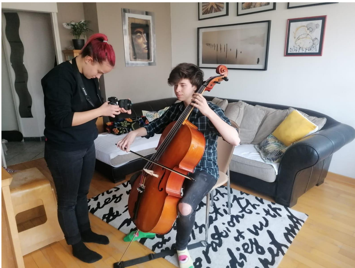
Slika 8.-6 fotografija seta i snimanja sviranja violončela

Nakon montaže jedne od prvih verzija filma shvatila sam da trebam još opservacijskih trenutaka koji su u potpunosti spontani i ne namješteni.