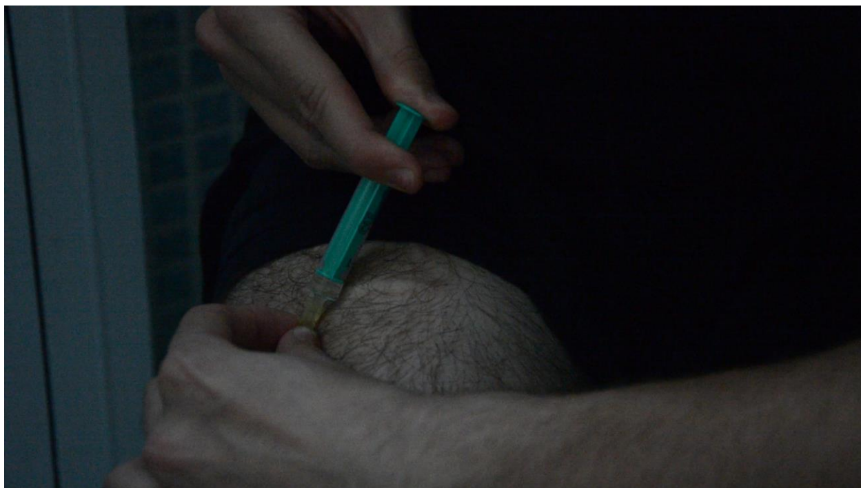
Slika 8. – 7. ubrizgavanje testosterona