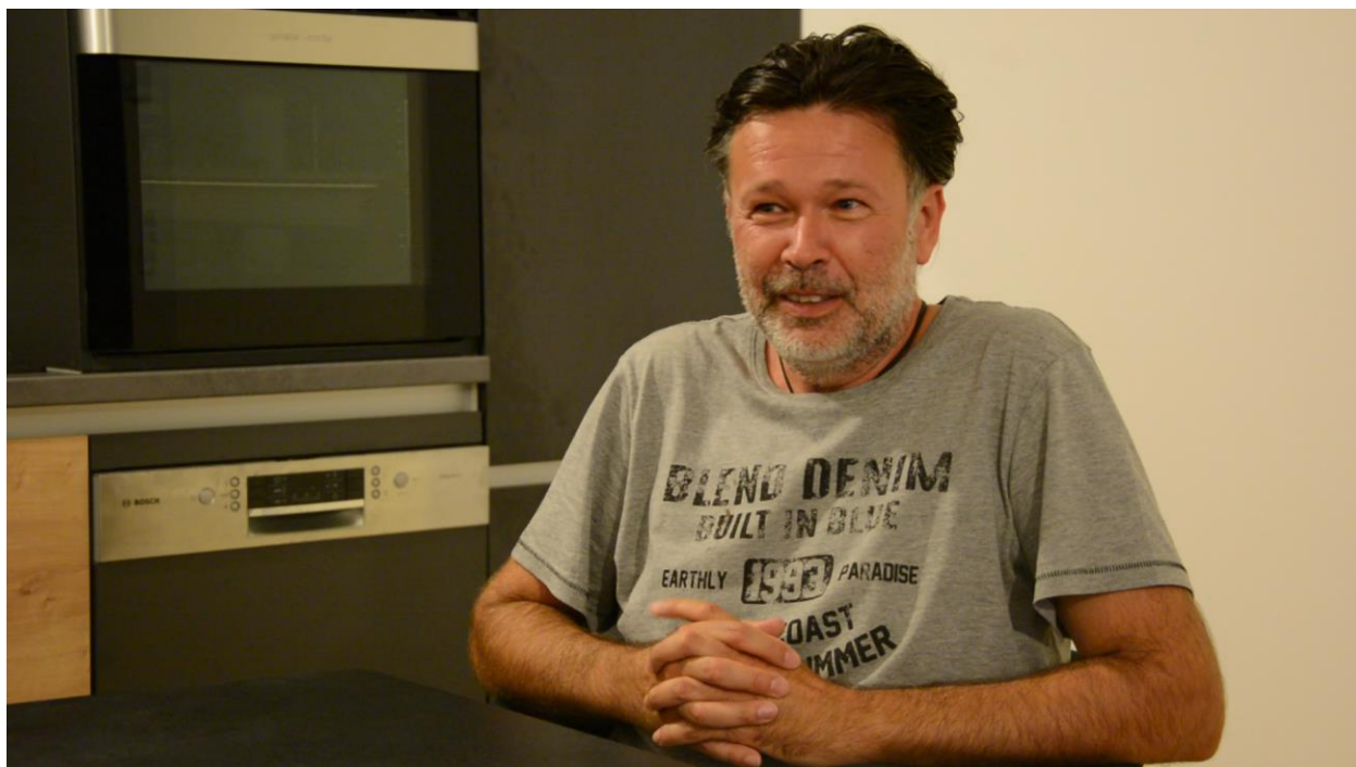
Slika 8. -4 kadar intervjua s ocem

Unatoč istim pitanjima dobila sam različite odgovore. Roditelji su rastavljeni stoga je svaki od intervjua sniman u drugom stanu. Kod snimanja intervjua s ocem došlo je do problema s osvjetljenjem. Vani je bila večer i stan je pozicioniran tako da dnevno svjetlo ne ulazi u prostor u dovoljnoj količini za snimanje. Morali smo upaliti lampe i zbog toga kadar ima narančasti ton. U finalnoj verziji filma intervju s ocem je izbačen.