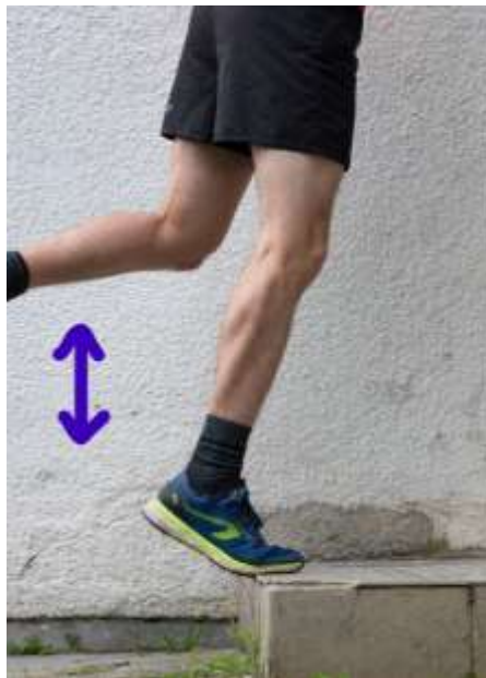
Slika 6.7 Dizanje jedne pete na stepenici