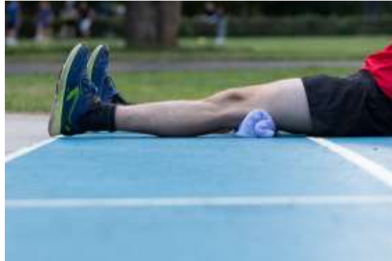
Slika 3.1 Izometrička vježba kvadricepsa

Tijelo se nalazi u supiniranom položaju. Ispod natkoljenice stavimo presavinuti ručnik. Podižemo stopalo i zadržavamo 5-7 sekundi odmor je dvostruko duži.