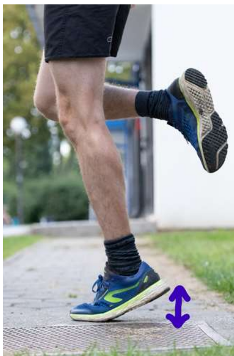
Slika 6.3 Stajanje s jednom nogom na prstima