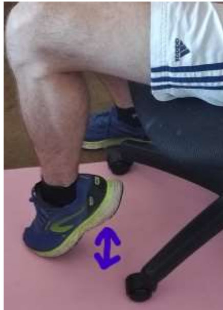
Slika 6.4 Podizanje pete iz sjedećeg položaja