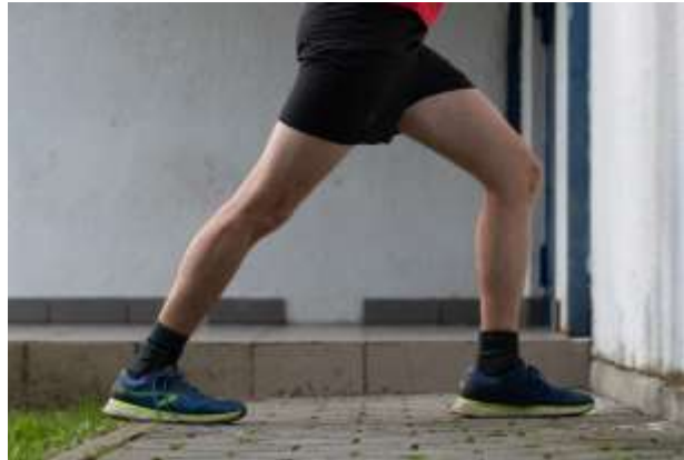
Slika 7.3 Vježba istezanja lista

Prislonimo ruke na zid. Postavimo zdravu nogu ravno ispred, a bolna noga neka bude iza. Noga koja je iza mora biti ispružena dok je prednja noga savijena. Prebaciti težinu na nogu koja je iza i držati petu na podlozi te tako istežemo list. Držimo 45 sekundi ponovimo 2-3 puta. Vježbu možemo izvesti 4-6 puta dnevno.