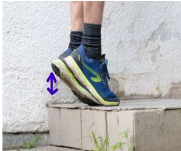
Slika 6.6 Podizanje obje pete na stepenici