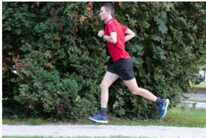
Slika 2.5 Početni zamah

Početni zamah je faza u kojoj se stopalo odvaja od tla i noga prelazi u fazu zamaha. Tijelo je u fazi leta gdje su obje noge u zraku odnosno nisu na podlozi. Tijekom djelovanje sila na nogu koja se odvojila od podloge koljeno prelazi u fleksiju. M. rectus femoris i m. iliopsoas pridonosi fleksiji kukova te nogu pomiču naprijed. Dorzifleksija stopala se događa kako stopalo ne bi zapelo tijekom prelaska noge naprijed[7].