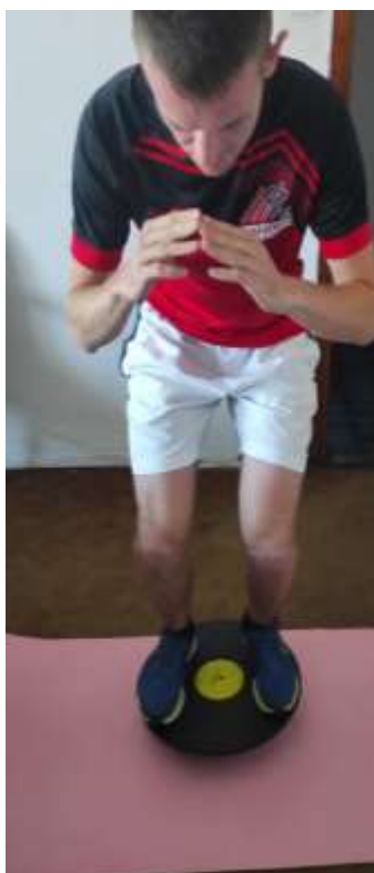
Slika 3.5 Vježba balansa na balans ploči

Na platformi za ravnotežu pokušavati održavati balans kad se spušta u čučanj.