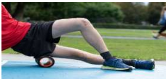
Slika 4.5 Istezanje TIT s foam rolerom