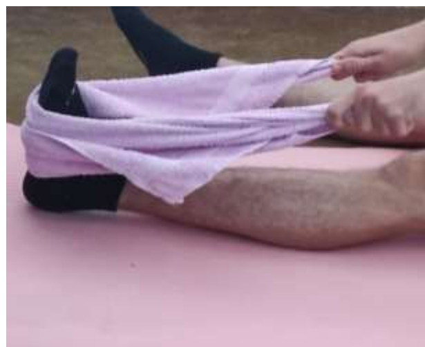
Slika 7.4 Istezanje lista ručnikom

Držimo 45 sekundi, ponovimo 2-3 puta. Vježbu možemo izvesti 4-6 puta dnevno.