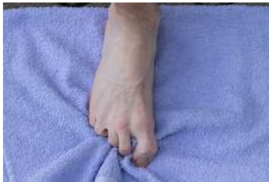
Slika 7.1 Vježba s ručnikom

Stavimo mali ručnik na pod. Koristimo ozlijeđenu nogu tako što samo nožnim prstima pokušavamo skupiti ručnik i pustimo. Ponovimo to 10 puta jednom ili 2 puta dnevno.