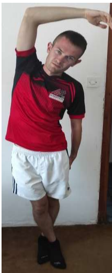
Slika 4.4 Istezanje iliotibijalnog traktusa