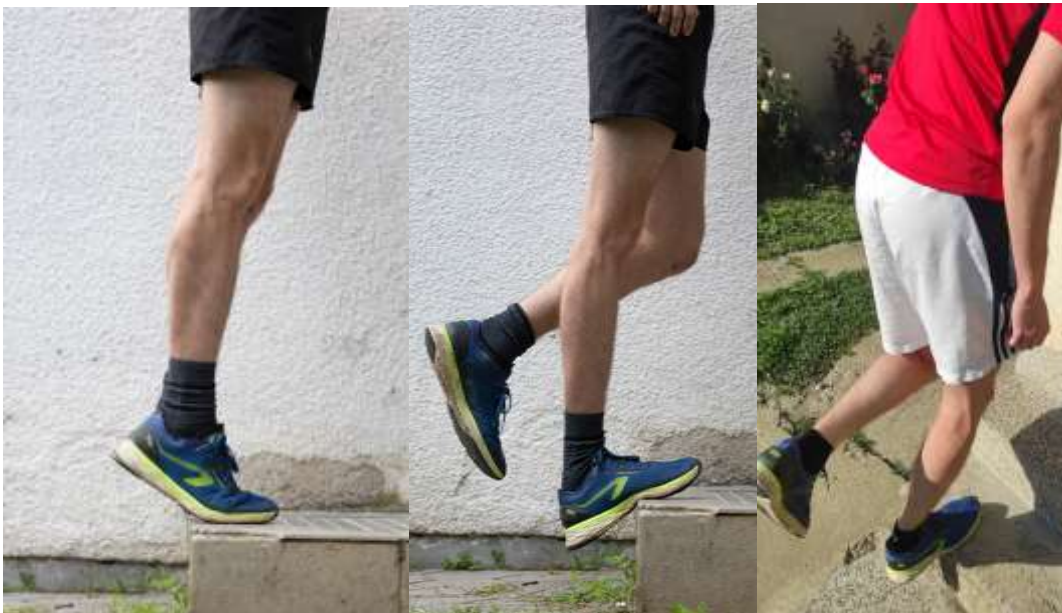
Slika 6.1 Alfredsonov protokol