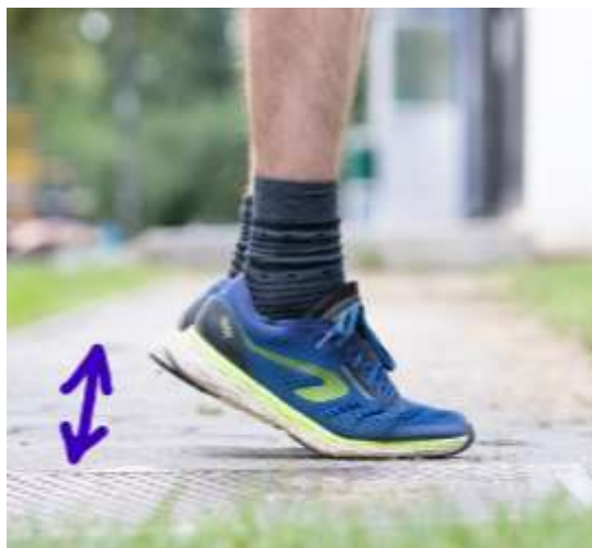
Slika 6.2 Stajanje na prstima s podignutim petama

Promovira vježbanje jedan put dnevno koristeći koncentrične odnosno ekscentrične vježbe. Ovaj program pokazuje dobre rezultate u kraćem i dužem periodu.