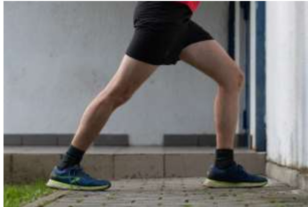
Slika7.3 Vježba istezanja lista

Prislonimo ruke na zid. Postavimo zdravu nogu ravno ispred, a bolna noga neka bude iza. Noga koja je iza mora biti ispružena dok je prednja noga savijena. Prebaciti težinu na nogu koja je iza i držati petu na podlozi te tako istežemo list. Držimo 45 sekundi ponovimo 2-3 puta. Vježbu možemo izvesti 4-6 puta dnevno.