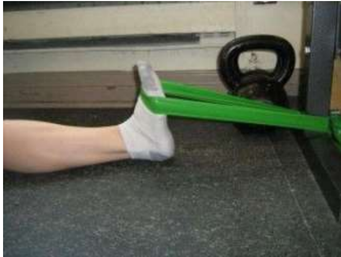
Slika 5.2 Jačanje m. tibialis anterior

Raditi 10 do 20 ponavljanja 2-3 puta dnevno