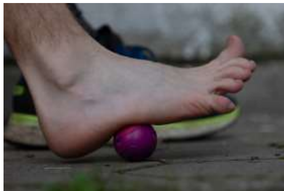
Slika Vježba 7.6 Hladna masaža svoda stopala

Ponavljamo 2-3 minute i to 2 puta dnevno.