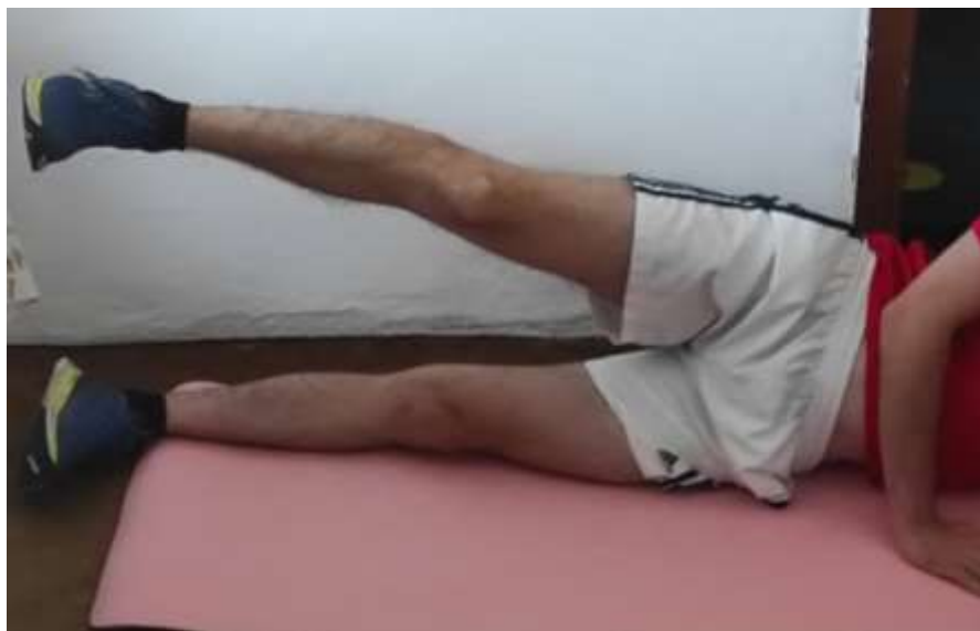
Slika 3.3 Vježba za jačanje m. gluteus medius

Tijelo postavimo u bočni položaj. Dlanovi su nam prislonjeni na tlo i podižemo nogu koja nam je udaljenija od tla. 3 serije po 8 ponavljanja.