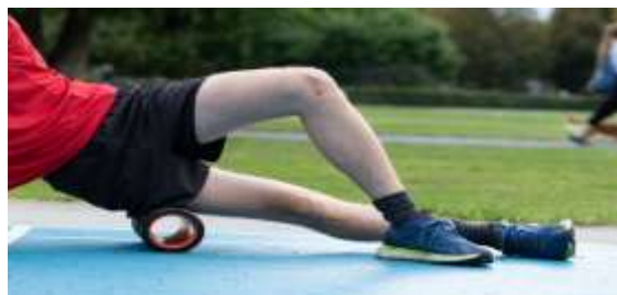
Slika 4.5 Istezanje TIT s foam rolerom