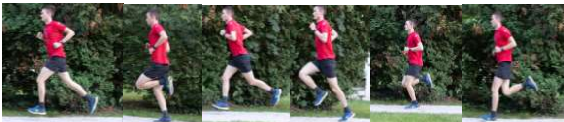
Slika 2.1 Osnovne faze biomehanike trčanja

Po zakonima lokomotornog sustava trčanje je slično hodanju, ali s jednom ključnom razlikom. Ako osoba ima mogućnost hodanja to ne znači da osoba ima mogućnost trčanja. Trčanje zahtjeva veću ravnotežu, veći opseg pokreta zglobova i veću snagu. Potreba za boljim balansom proizlazi zbog faze dvostrukog oslonca koje u trčanju nema. Uz to, u trčanju postoji i faza kad noge uopće nisu na podlozi, što je više u letu to je trkač brži. Mišići moraju proizvoditi veću energiju kako bi trup više uzdignule nego kod hodanja[6]. Mišići i zglobovi moraju biti spremni apsorbirati povećanje energije kako bi mogli kontrolirati težinu tijela. Tijekom trčanja sila reakcije podloge na centar ravnoteže povećava se 250% od težine tijela. Trčanje je radnja koja se ponavlja odnosno jedan ciklus bi se mogao podijeliti u 2 faze[2]. Jedna je faza oslonca dok je druga faza zamaha. U fazi oslonca noga je na podlozi a u fazi zamaha to nije. Faza oslonca čini otprilike 40% pokreta u trčanju i traje od trenutka kad stopalo dodirne podlogu do trenutka kada se odgurnemo prstima stopala[7]. Kod faze zamaha noga je stalno u zraku. Ona traje od trenutka odgurivanja prstiju stopala do kada stopalo opet ne dotakne tlo. Maksimalno opterećenje na ljudsko tijelo stvaraju prva i posljednja faza oslonca. Vertikalna sila reakcije je između 2000 do 2500 N. Snage reakcije kod hoda su tri puta manje. Stopalo je jedan od najopterećenijih segmenata lokomotornog sustava tokom trčanja[2].