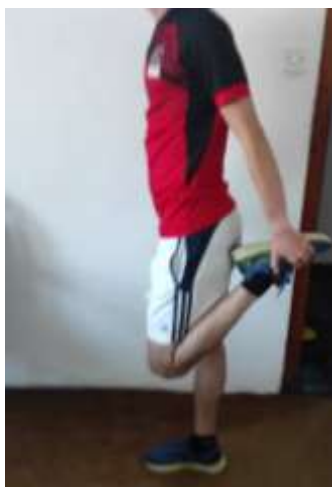
Slika 3.4 Istezanje m. quadriceps

Stojimo uspravno te jednom rukom primiti nogu. Rukom povlačiti nogu prema stražnjici tako da se osjeti istežanje u prednjem djelu natkoljenice.