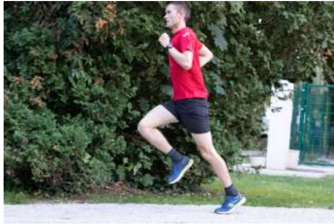
Slika 2.4 Faza odgurivanja

svih ovih uvjeta dolazi do maksimalne sile faze oslonca koja se projicira neposredno prije odvajanja stopala od podloge te započinje faza zamaha[7].