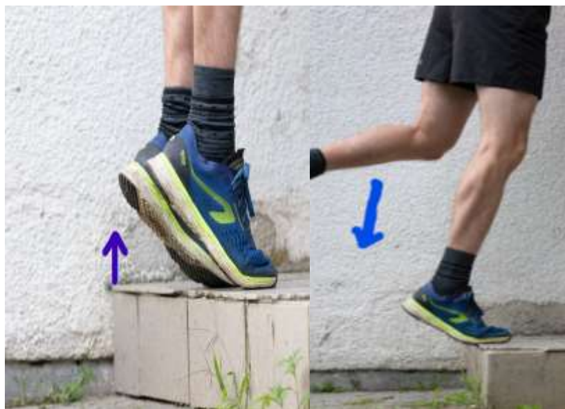
Slika 6.8 Ekscentrično podizanje peta na stepenici