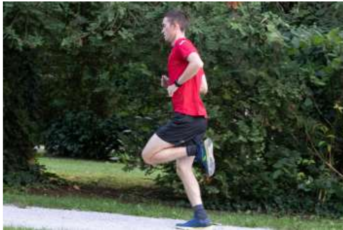
Slika 2.6 Faza srednjeg djela zamaha

Završni dio zamaha je faza u kojoj se suprotna noga odvaja od tla, tu dolazi do zamaha i kreće druga faza lebdenja. Ona noga koja je u završnoj fazi zamaha počinje se pripremati za kontakt s podlogom i novi ciklus. Tijekom ove faze u kuku završava fleksija i počinje ekstenzija, a koljeno se počinje ekstenzirati, što je rezultat aktivacije m. rectusa femoris i momenta sile [7].