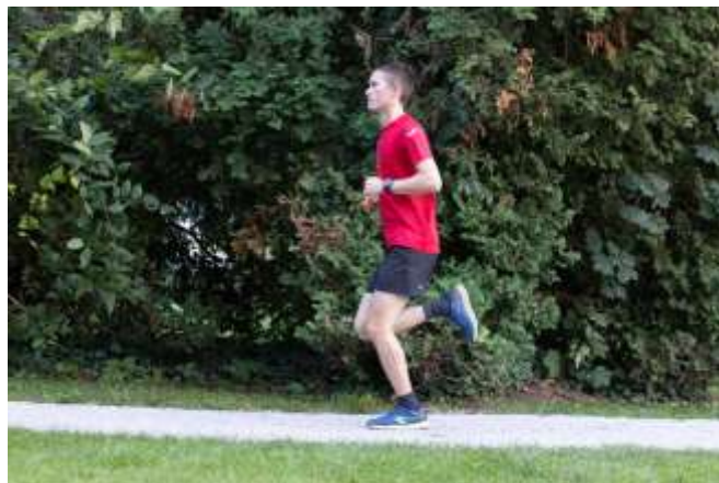
Slika 2.3 Srednja faza oslonca

Srednja faza oslonca je faza u kojoj je stopalo u punom kontaktu s tlom. Tijekom ove faze potkoljenica kreće prema naprijed te se na taj način povećava dorzifleksija stopala. Najveća dorzifleksija je u trenutku kad se centar gravitacije nalazi ispred stopala. Točka najveće pronacije označava kraj faze amortizacije sile podloge i počinje propluzivna faza[7] [8].