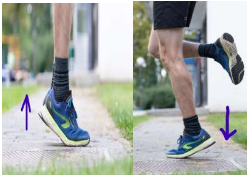
Slika 6.5 Ekscentrično podizanje pete