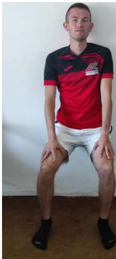
Slika 3.2 Vježba stolica, Izvor: Privatna galerija

Leđima se oslonimo na zid, koljena su nam savinuta do 90 stupnjeva zadržimo 5- 7 sekundi i ponovimo 10 puta.