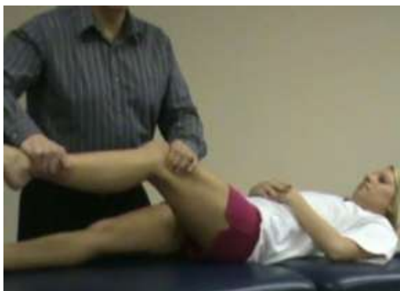
Slika 4.2. Noble test

Pacijent se nalazi u supiniranom položaju ili bočno ležeći s ozlijeđenom nogom prema gore. Pacijenta se primi malo iznad gležnja i polako savijamo koljeno do 90 stupnjeva. Napravimo pokret nekoliko puta dok drugom rukom palpiramo i pritišćemo lateralni epikondil bedrene kosti. Opipljivo trljanje ili krepitacije te lokalizirana bol koja se povećava na ili iznad epikondila (često 30 stupnjeva savijanja) ukazuje na TIT sindrom[16].