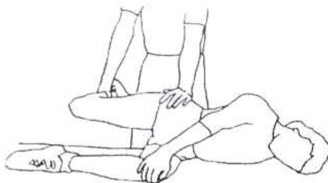
Slika 4.3. Oberov test