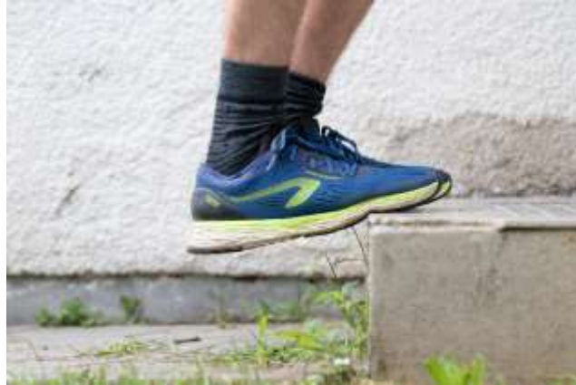
Slika 7.5 Vježba istezanje lista na stepenici, Izvor: Privatna galerija

Držimo 45 sekundi, ponovimo 2-3 puta. Vježbu možemo izvesti 4-6 puta dnevno.