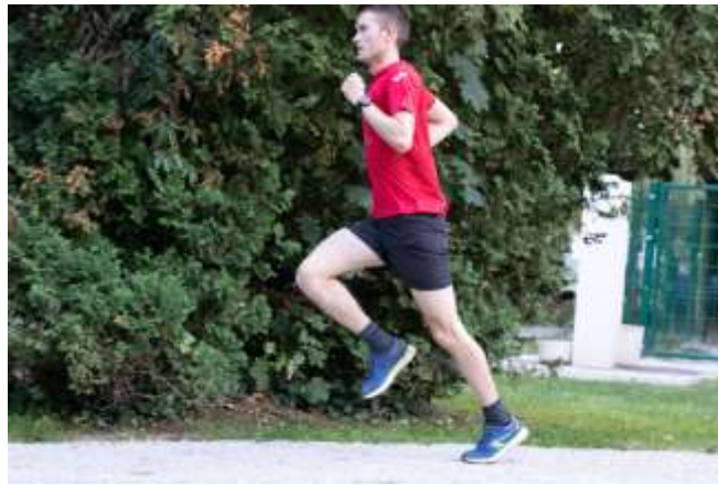
Slika 2.4 Faza odgurivanja

svih ovih uvjeta dolazi do maksimalne sile faze oslonca koja se projicira neposredno prije odvajanja stopala od podloge te započinje faza zamaha[7].