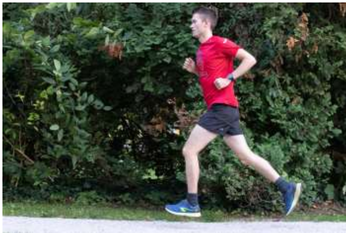
Slika 2.7 Početni dio završnog djela zamaha

Završni dio zamaha je faza u kojoj se suprotna noga odvaja od tla, tu dolazi do zamaha i kreće druga faza lebdenja. Ona noga koja je u završnoj fazi zamaha počinje se pripremati za kontakt s podlogom i novi ciklus. Tijekom ove faze u kuku završava fleksija i počinje ekstenzija, a koljeno se počinje ekstenzirati, što je rezultat aktivacije m. rectusa femoris i momenta sile [7].