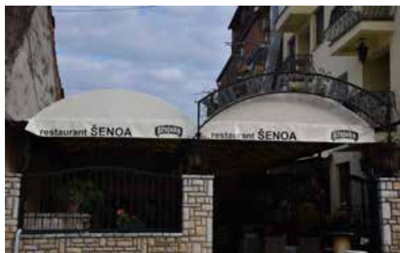
Bistro Pavić ULICA HRVATSKOG PROLJEĆA 6