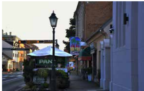
Bakina Kuhinja PRILAZ ANDRIJE HEBRANGA 8