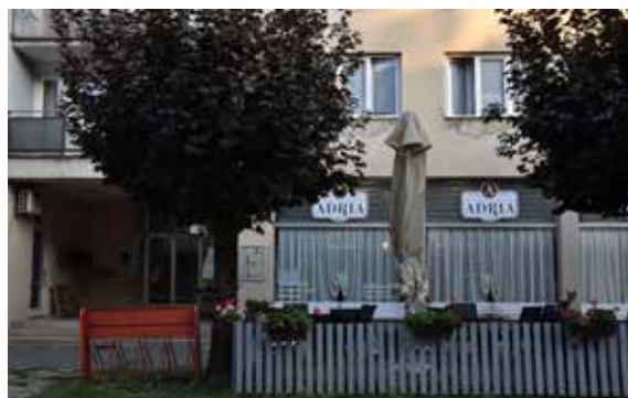
Restoran Zrinski ULICA KRISTE FRANKOPANA 7A