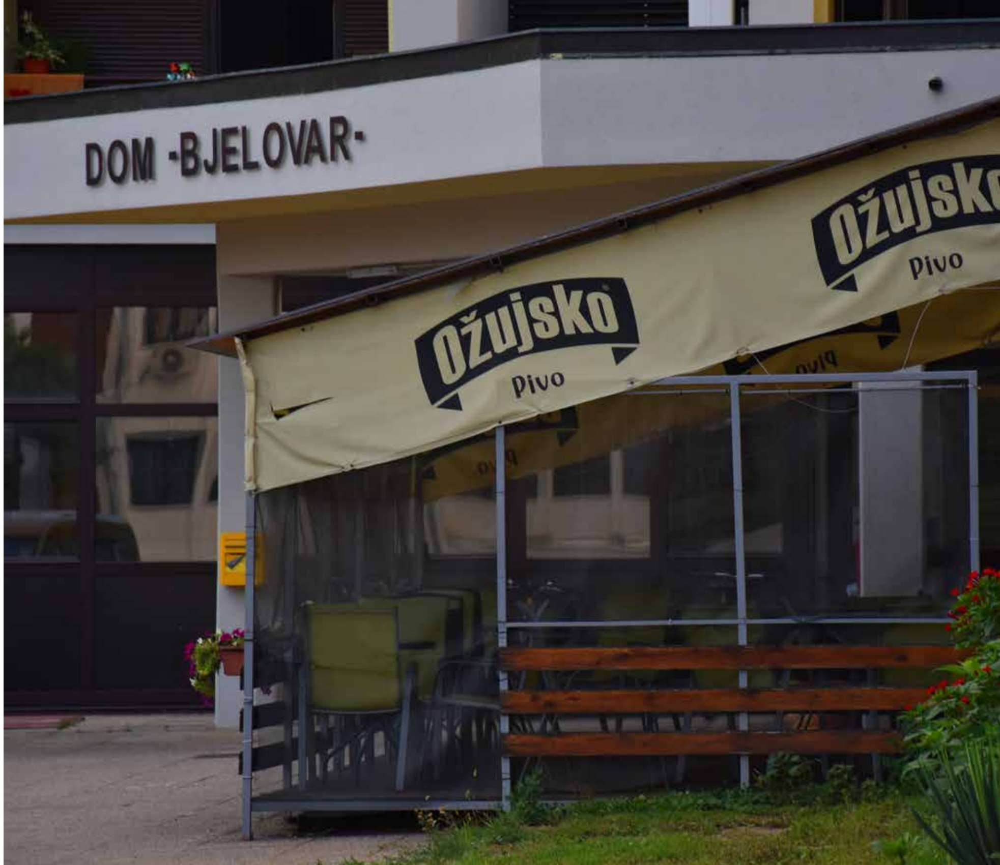
Caffe Bar IN FRANJEVAČKA ULICA 11A