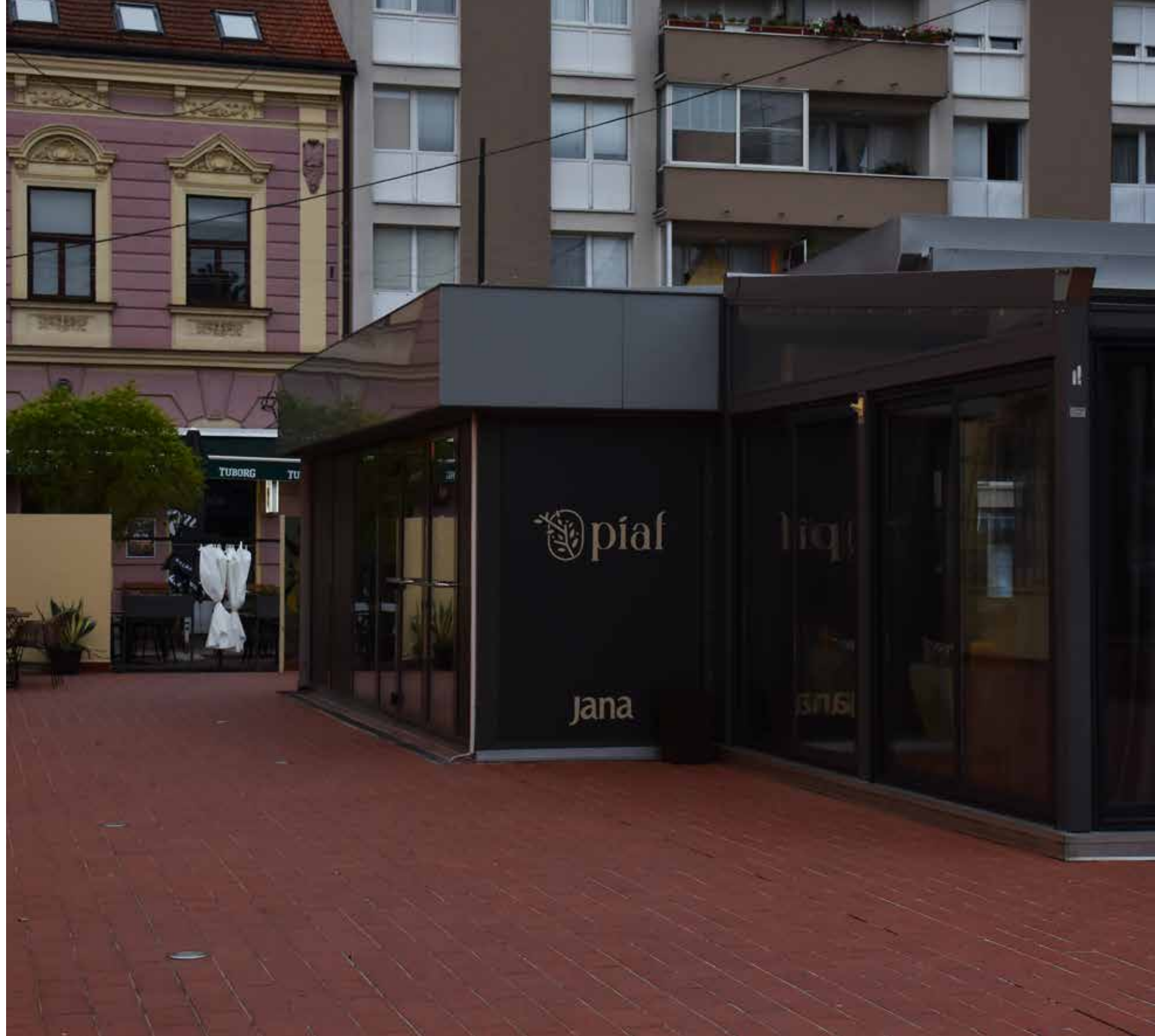
Kavana Piaf TRG EUGENA KVATERNIKA 7A