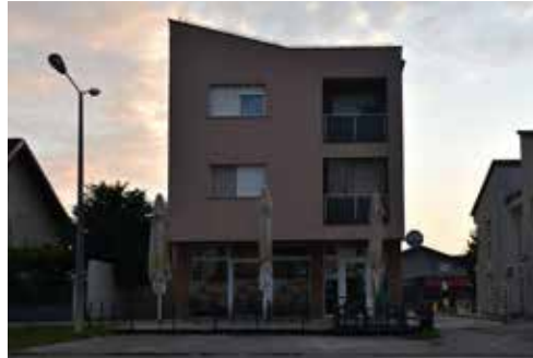
Caffe Bar Old School PRILAZ ANDRIJE HEBRANGA 3