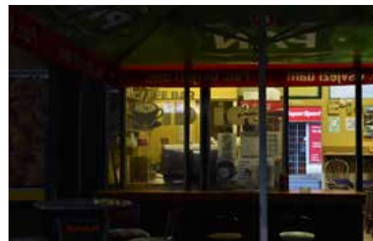
Caffe Bar Marijana ŠETALIŠTE DR. IVŠE KEBOVIĆA 51