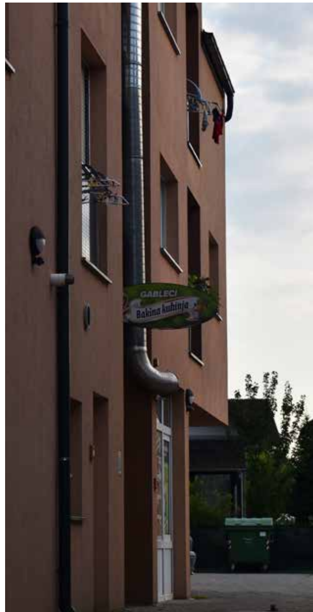
Pačalinke TRG HRVATSKIH BRANITELJA 21