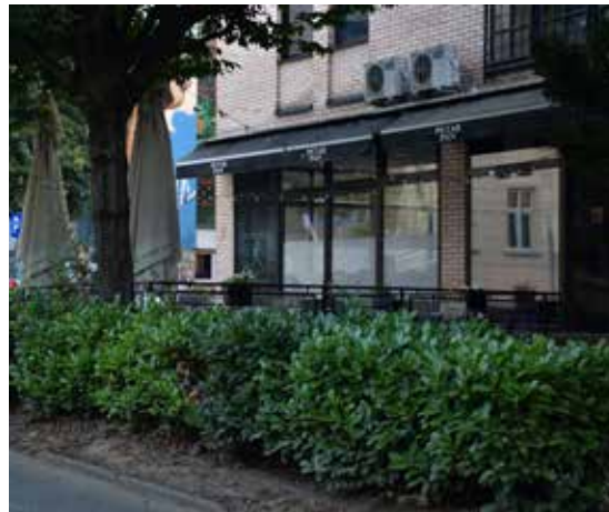
Caffe Bar Arteria ULICA MATICE HRVATSKE 14 A