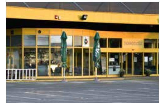
Caffe Bar 5 PAKRAČKA ULICA 7