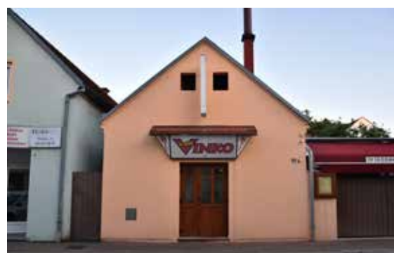
Pizzeria Garfield ULICA SVETOG NIKOLE TAVELIČA 21