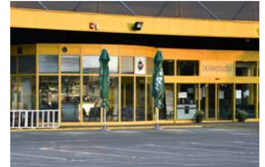
Caffe Bar 5 PAKRAČKA ULICA 7