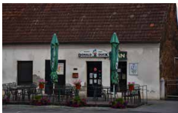
Vinko Grill ULICA AUGUSTA ŠEONE 11B