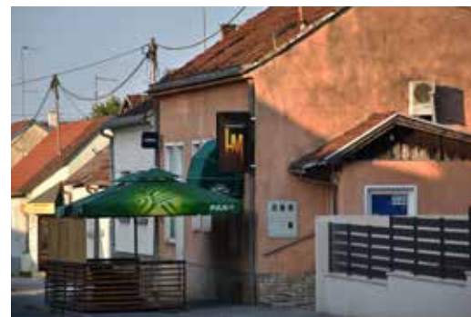
Caffe Bar Mozart ULICA VLADIMIRA VIDRIČA 3