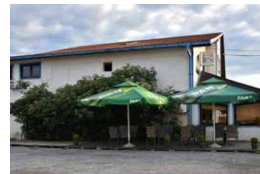
Caffe Bar HM ULICA IVANA GORANA KOVAČIČA 6