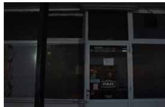
Caffe Bar Ibica ŠETALIŠTE DR. IVŠE KEBOVIĆA 51