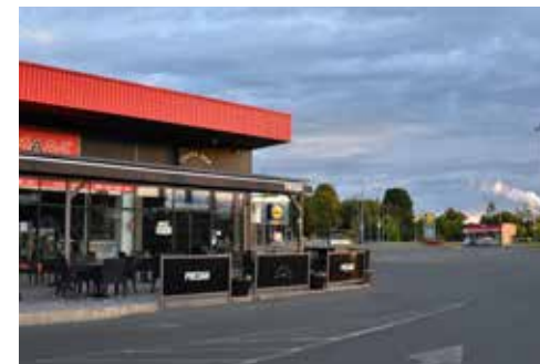
Caffe Bar Fun SLAVONSKA CESTA 2A