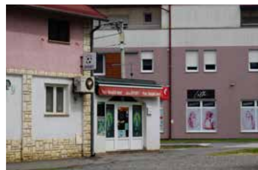
Caffe Bar Pero ULICA ANDRIJE HEBRANGA 57