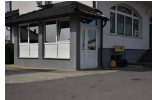
Caffe Bar Kalnik FRANJEVAČKA ULICA 16