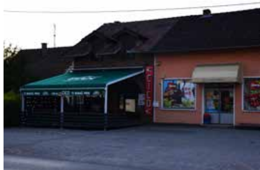
Caffe Bar Stars CVJETNA ULICA 29