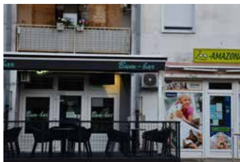
Caffe Bar Bum-Bar TRG HRVATSKIH BRANITELJA 21