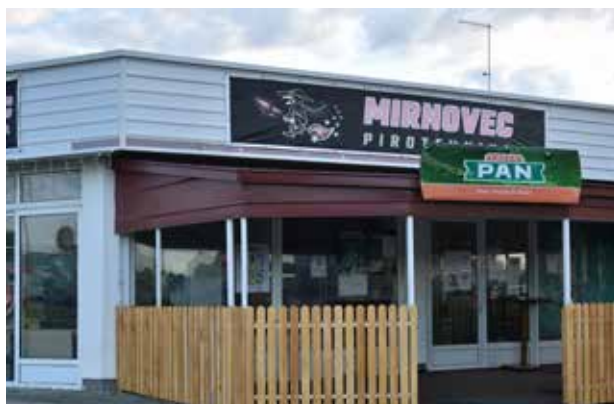
Caffe Bar Pajdo ULICA BLAJBURŠKIH ŽRTAVA 17