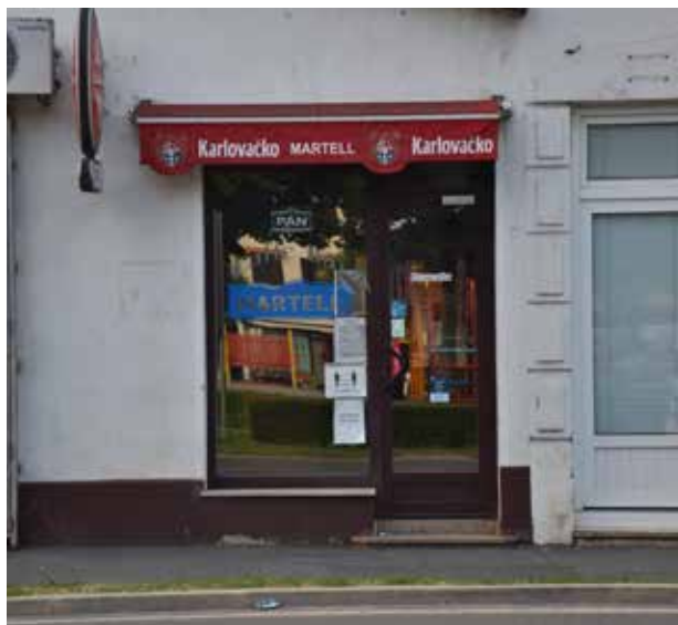
Caffe Bar Mali Spas ULICA VLADIMIRA NADZORA 3