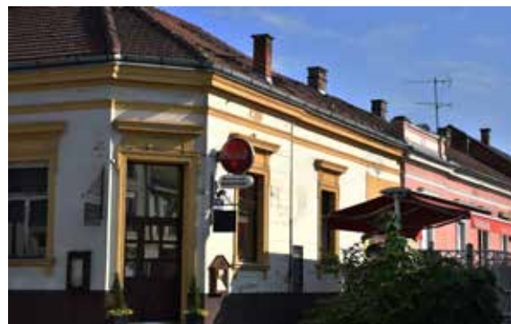
Caffe i bistro Franz TRG EUGENA KVATERNIKA 7