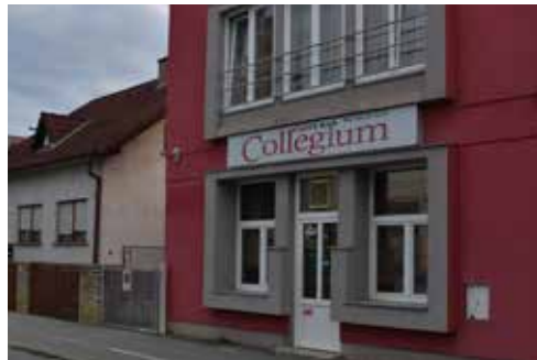
Caffe Bar Collegium PRILAZ ANDRIJE HEBRANGA 13