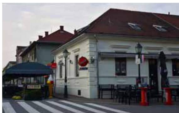
Caffe Bar Sinatra ULICA FRANA SUPILA 11