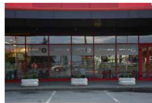
Caffe Bar Samo Fin ULICA ANDRIJE HEBRANGA 2B