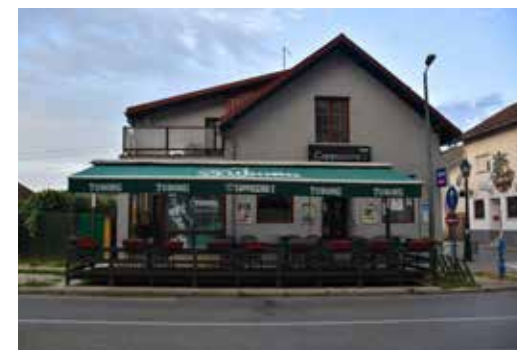
Caffe Bar Merlin ULICA ANTUNA MIHANOVIĆA 31A