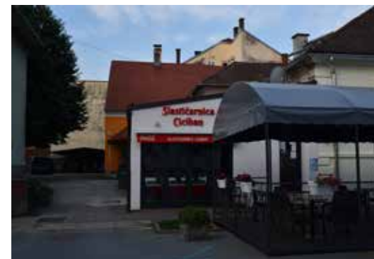
Kavana i Slastičarnica Zagorje ULICA IVANA VITEZA TRNSKOG 15