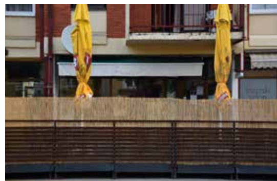
Caffe Bar Speed