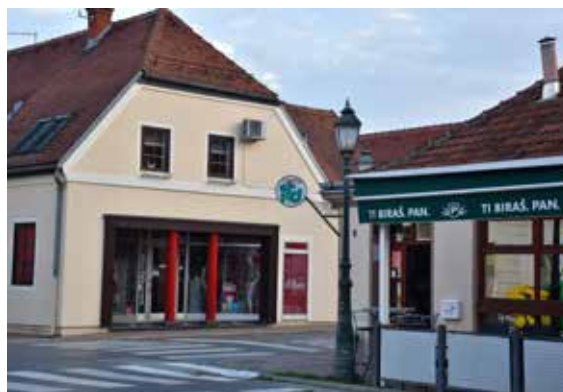
Caffe bar Asturias ULICA IVANA GUNDULIĆA 2