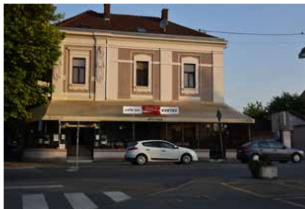
Caffe Bar Pikova Dama ULICA TOMAŠA GARIKA MASARYKA 4