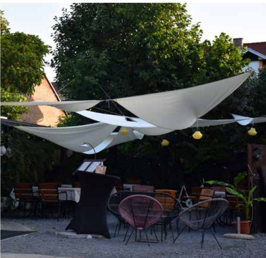
Bistro Stari Bjelovar ULICA MATICE HRVATSKE 8