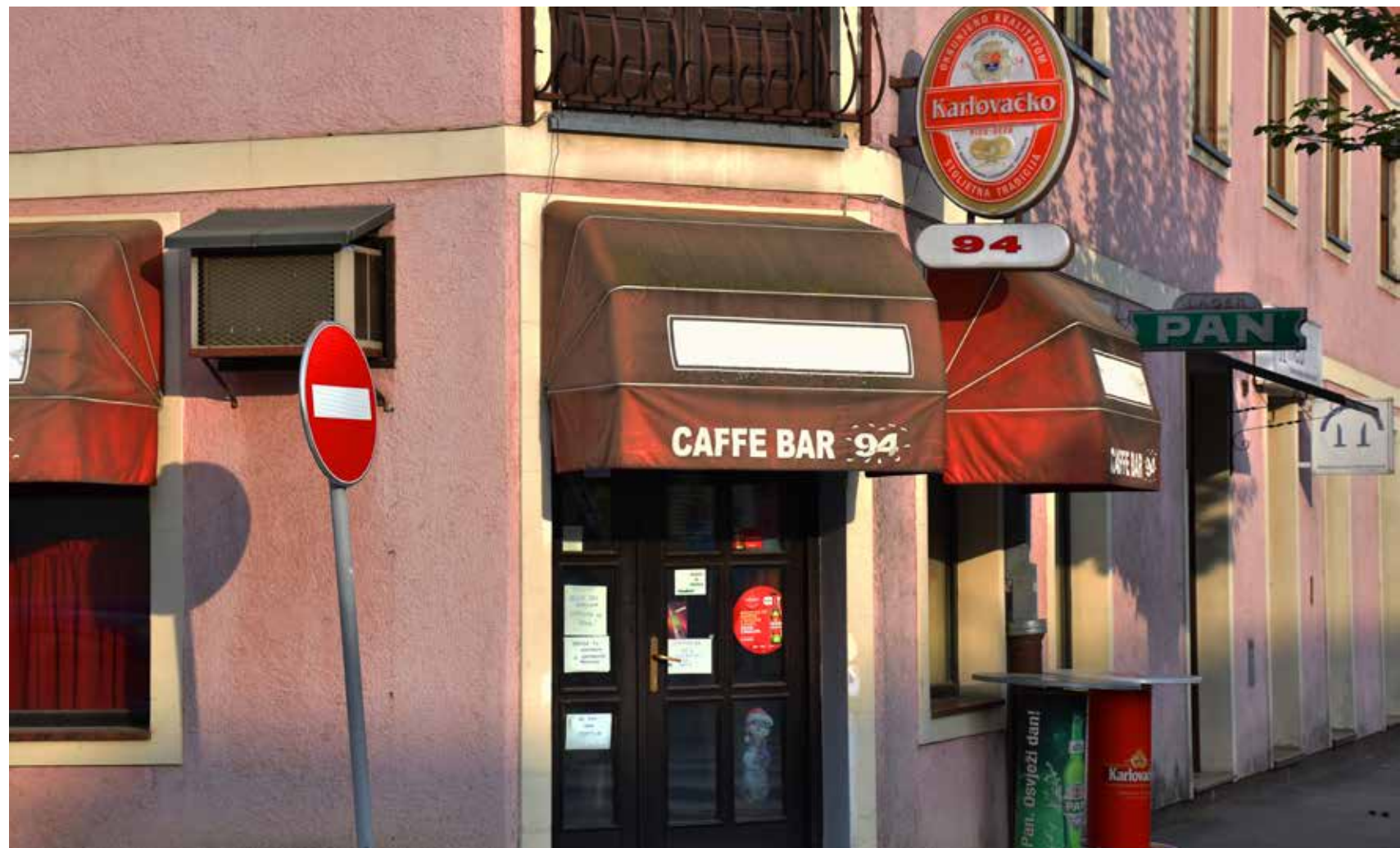
Caffe Bar 94 ULICA ANTUNA MIHANOVIĆA 7