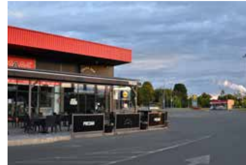
Caffe Bar Fun SLAVONSKA CESTA 2A