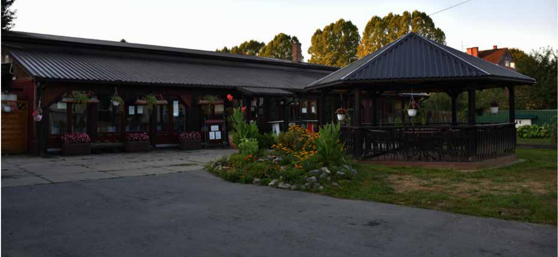
Golub FRANJEVAČKA ULICA 6A