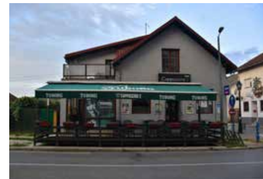
Caffe Bar Merlin ULICA ANTUNA MIHANOVIĆA 31A