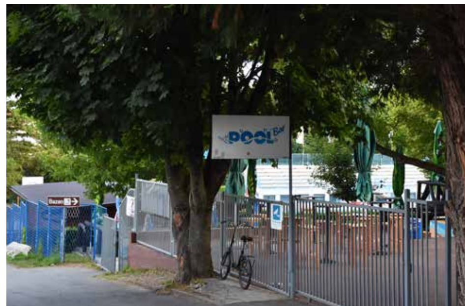
Caffe Bar Mario TRG EUGENA KVATERNIKA (PARK)