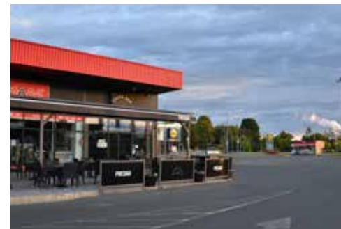
Caffe Bar Fun SLAVONSKA CESTA 2A