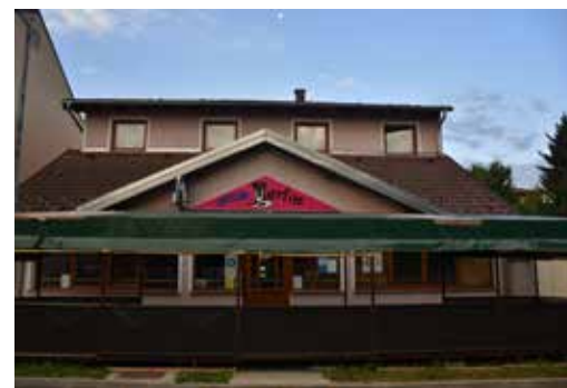
Caffe Bar Minus FRANJEVAČKA ULICA 11A