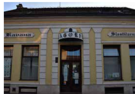
Caffe Bar Zagreb ULICA ANTUNA BRANKA ŠIMIĆA 6