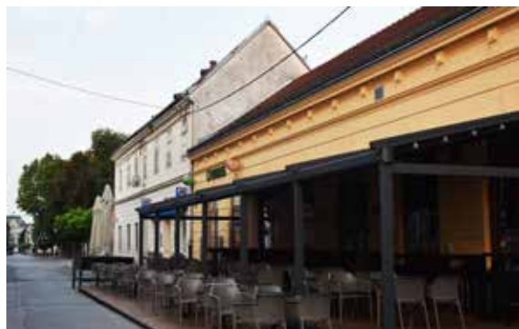
Caffe Bar Story ULICA FRANA SUPILA 5