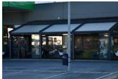
K caffe ULICA ANDRIJE HEBRANGA 2A