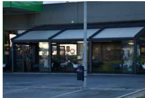
K caffe ULICA ANDRIJE HEBRANGA 2A