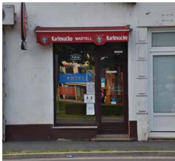
Caffe Bar Mali Spas ULICA VLADIMIRA NADZORA 3