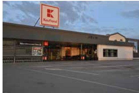
Caffe Bar Predah JUŽNA OBILAZNICA 2A