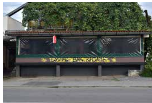
Caffe Bar Marijan ULICA BANOVIĆA HRVATSKE 39