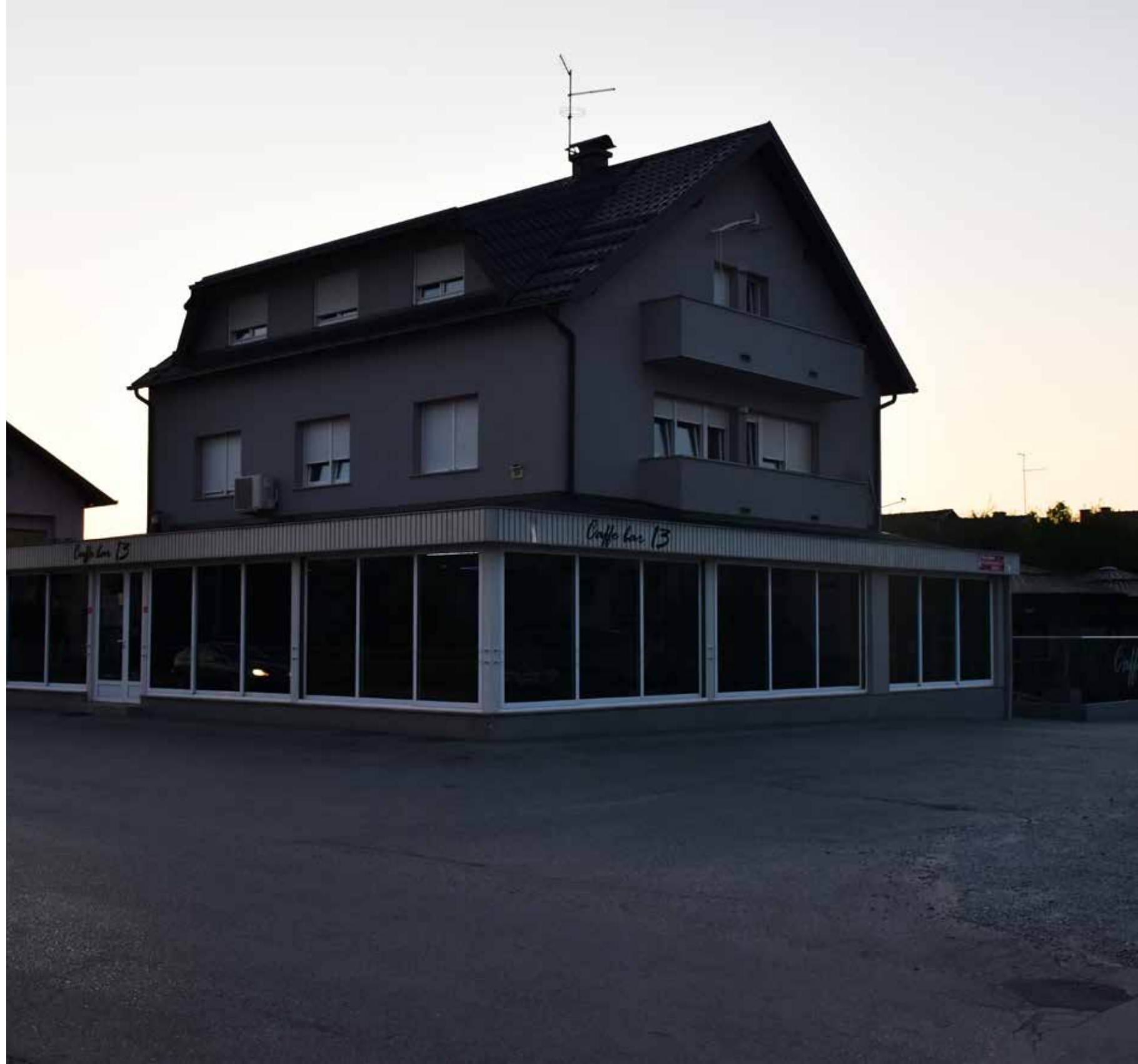
Caffe Bar 13 ULICA JAKOVA GOTOVCA 34