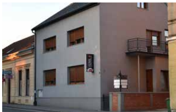
Bistro Pod Starim Krovovima SLAVONSKA CESTA 9