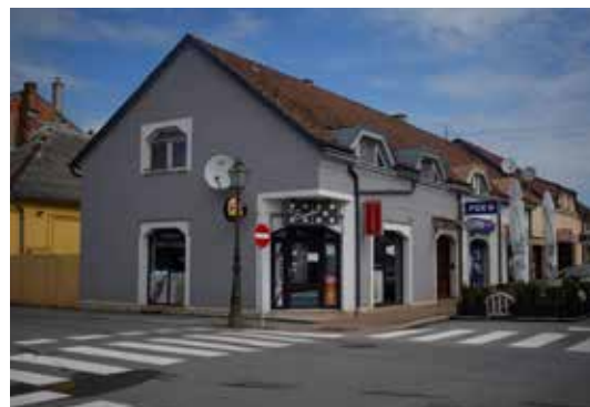
Slastičarnica Ciciban ULICA FRANE SUPILA 6