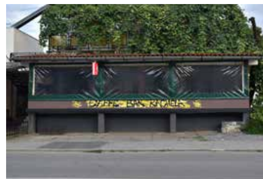
Caffe Bar Marijan ULICA BANOVINI HRVATSKE 39