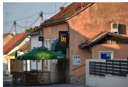
Caffe Bar Mozart ULICA VLADIMIRA VIDRIČA 3