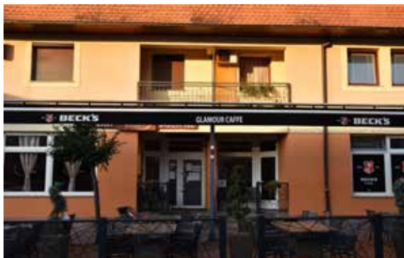
Bistro i caffe Glamur ULICA LJUDEVITA GAJA 3