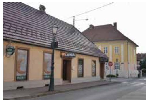
Caffe Bar Galerija ULICA AUGUSTA ŠENOJE 15