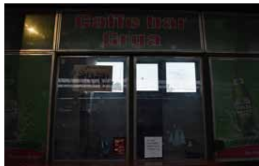
Caffe Bar Plac ŠETALIŠTE DR. IVŠE KEBOVIĆA 51