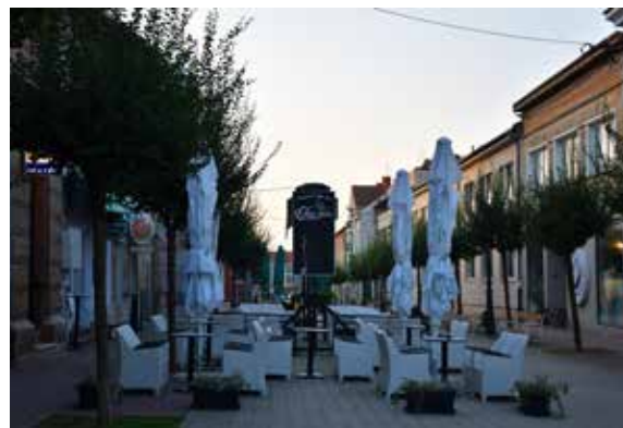
Caffe Bar Chill Out ULICA JURJA HAULIKA 14A