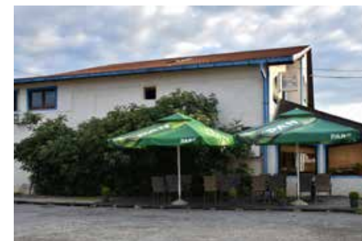
Caffe Bar HM ULICA IVANA GORANA KOVAČIČA 6