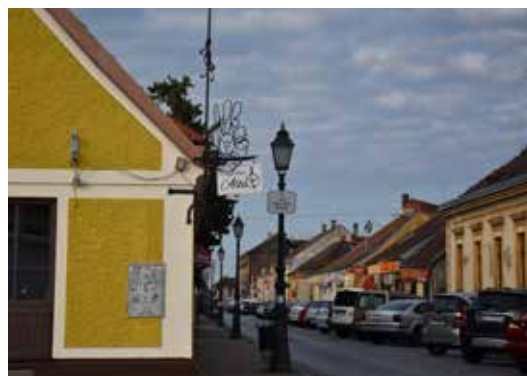
Caffe Bar History ULICA JOSIPA JURJA STROSSMAYERA 2A