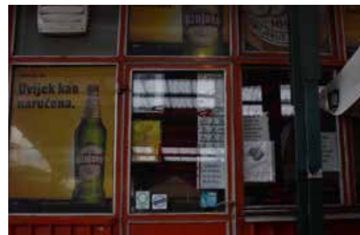
Caffe Bar Grga ŠETALIŠTE DR. IVŠE KEBOVIĆA 51