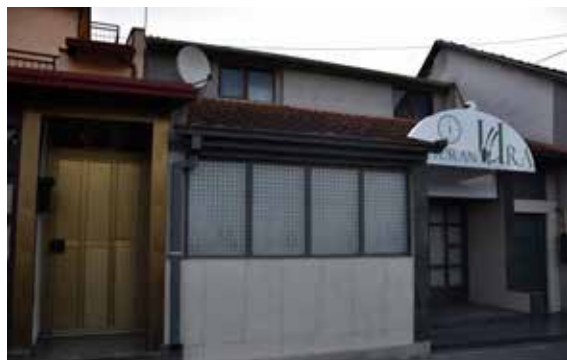
Restoran Snježana PAKRAČKA ULICA 1