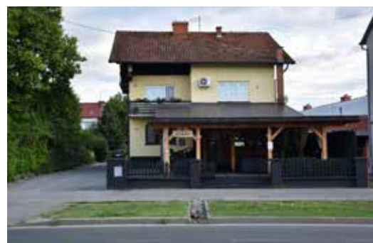
Caffe Bar Šport ULICA ANDRIJE HEBRANGA 33