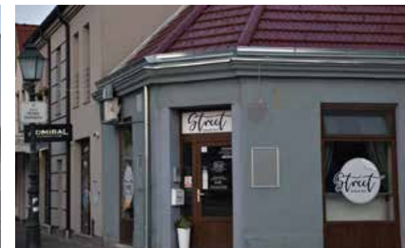
Feral ŠETALIŠTE DR. IVŠE LEBOVIČA 9B