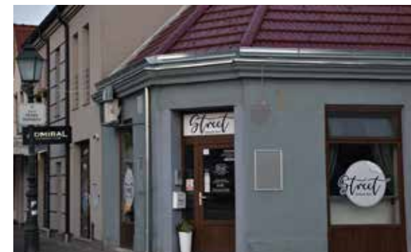
Feral ŠETALIŠTE DR. IVŠE LEBOVIČA 9B