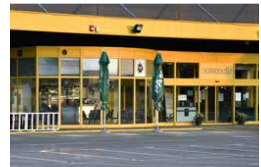
Caffe Bar 5 PAKRAČKA ULICA 7