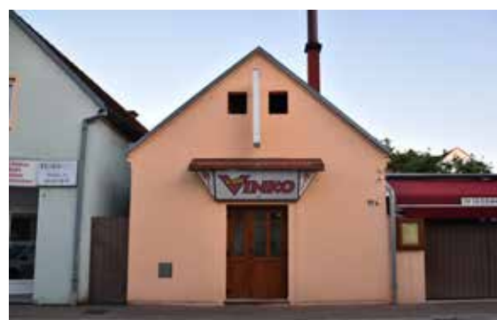
Pizzeria Garfield ULICA SVETOG NIKOLE TAVELIČA 21