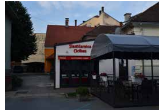
Kavana i Slastičarnica Zagorje ULICA IVANA VITEZA TRNSKOG 15