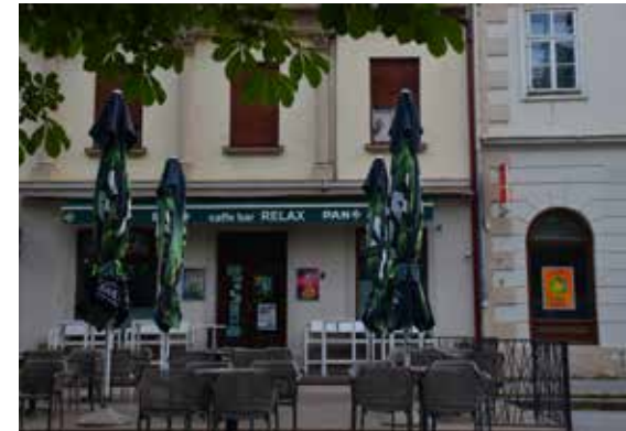
Caffe bar Relax TRG EUGENA KVATERNIKA 10