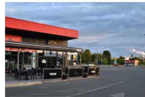
Caffe Bar Fun SLAVONSKA CESTA 2A