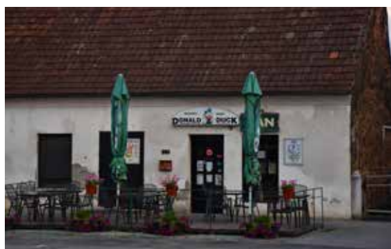
Vinko Grill ULICA AUGUSTA ŠEONE 11B