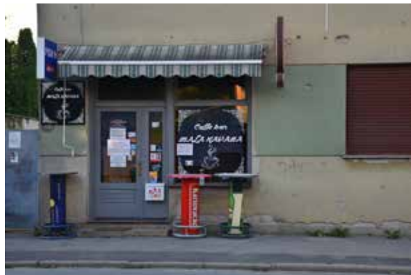
Zeppelin ULICA MATICE HRVATSKE 6