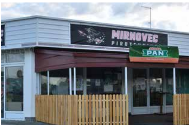
Caffe Bar Pajdo ULICA BLAJBURŠKIH ŽRTAVA 17