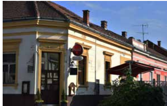
Caffe i bistro Franz TRG EUGENA KVATERNIKA 7