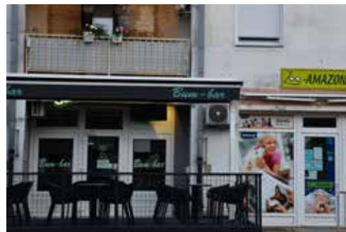
Caffe Bar Bum-Bar TRG HRVATSKIH BRANITELJA 21