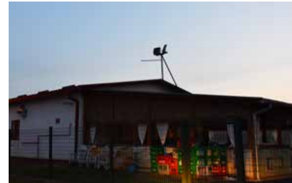
Restoran Adria ULICA IVANA GUNDULIĆA 12B