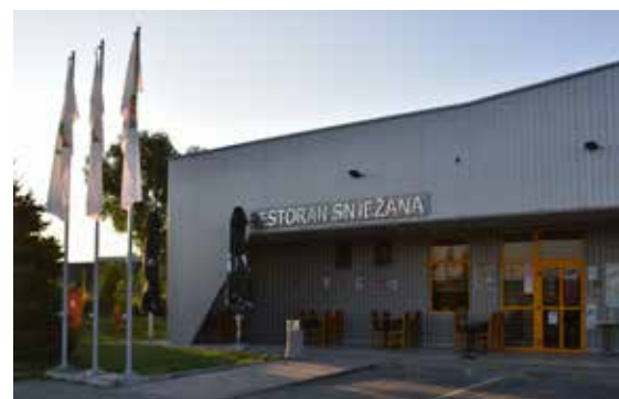
Snack Bar Street ŠETALIŠTE DR. IVŠE LEBOVIČA 17