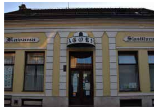
Caffe Bar Zagreb ULICA ANTUNA BRANKA ŠIMIĆA 6