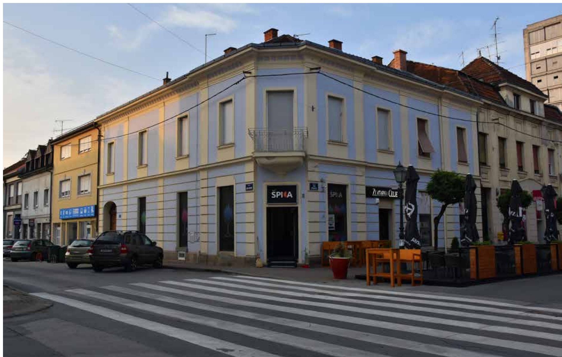
Caffe bar Špica ULICA JURJA HAULIKA 18