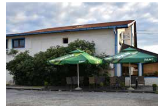
Caffe Bar HM ULICA IVANA GORANA KOVAČIĆA 6