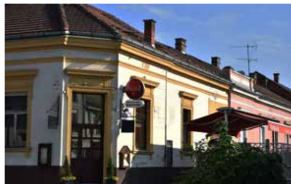
Caffe i bistro Franz TRG EUGENA KVATERNIKA 7