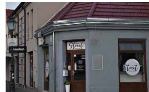
Feral ŠETALIŠTE DR. IVŠE LEBOVIČA 9B