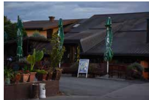
Caffe Bar Tennis ULICA FERDE LIVADIĆA 16