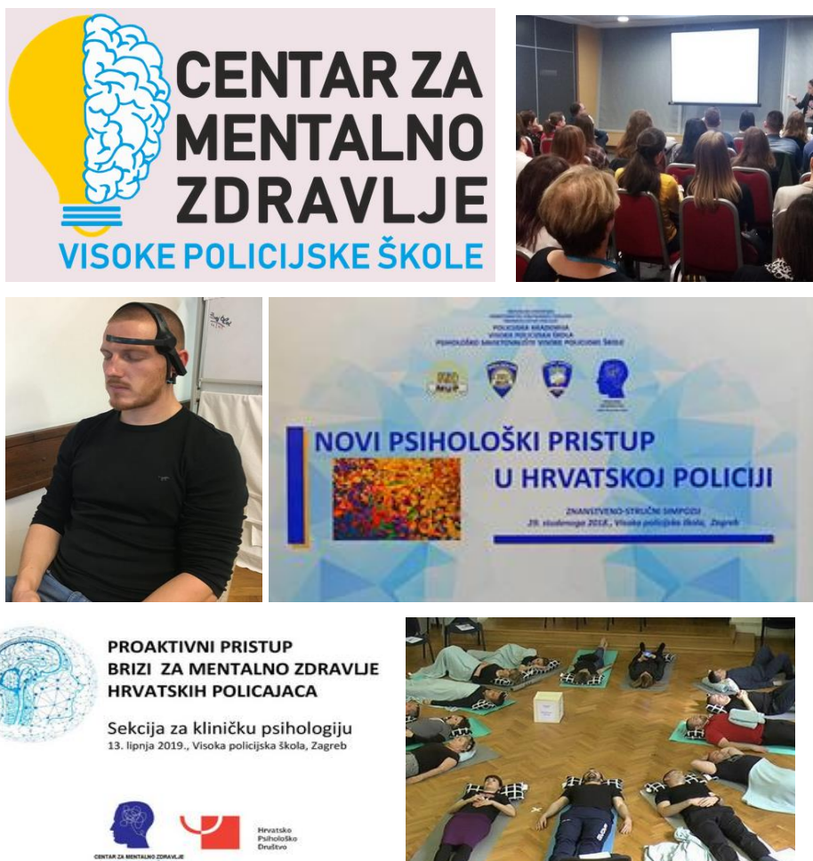
Slika 2. – 7. Fotogalerija Centra za mentalno zdravlje Visoke policijske škole, Izvor: https://cmzvps.com.hr/fotogalerija/

pomoći policijskim službenicima MUP – a RH (Širić 2019: 18). U sklopu Visoke policijske škole MUP – a RH, 2016.godine osnovan je Centar za mentalno zdravlje Visoke policijske škole 5 . Centar se bavi znanstveno – istraživačkim radom, edukacijom i pružanjem psihološke pomoći studentima koji su većinom policijski službenici, ali i drugim policijskim službenicima. Neki od ciljeva centra su edukacija, poboljšanje kvalitete života, razvoj životnih i akademskih vještina (poput komunikacijskih i socijalnih vještina, vještina ovladavanja stresom i tako dalje), tretman i rješavanje trenutnih tegoba te prevencija razvoja psihičkih poremećaja. Također, stručni djelatnici se bave znanstveno-istraživačkim radom u cilju ispitivanja djelotvornosti primijenjenih tehnika te evaluacije rada Centra. Za potrebe ovog rada, važno je istaknuti kako se u sklopu Centra provodi trening mindfulnessa , što predstavlja potpuno novi i proaktivni pristup u brizi za mentalno zdravlje hrvatskih policajaca.