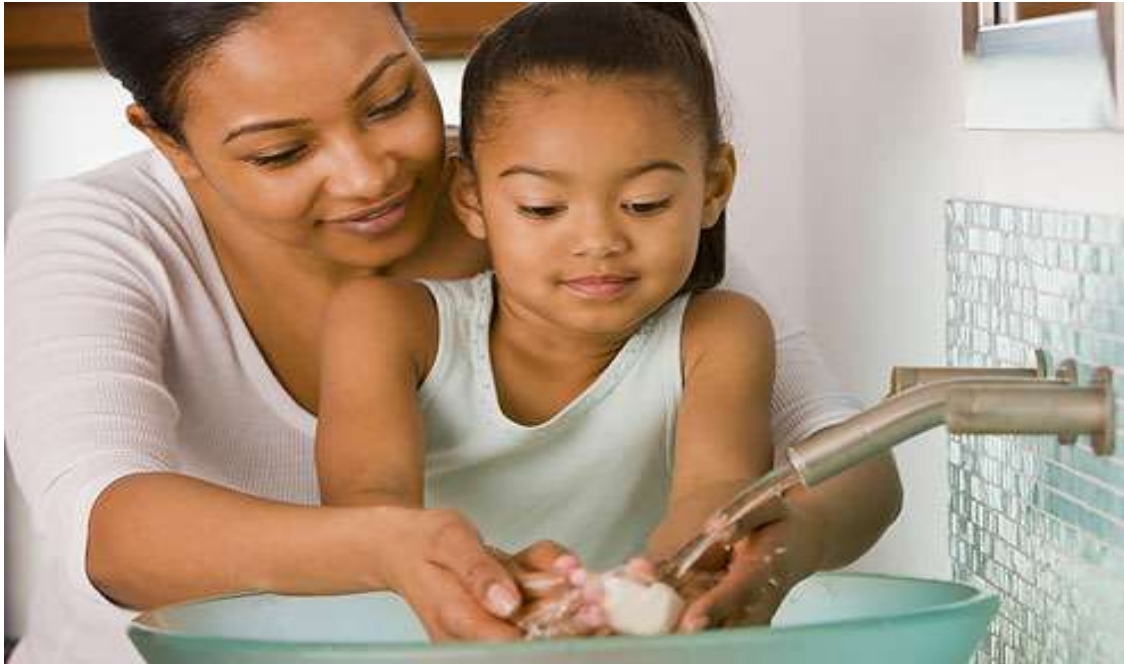
Slika 5.9.1. Zdravstveni odgoj djece

naviku pranja ruku prije i nakon obavljanja nužde. Slika 5.9.1. prikazuje zdravstveni odgoj djevojčice. U djece treba razvijati i pravilne navike u prehrani. [18]