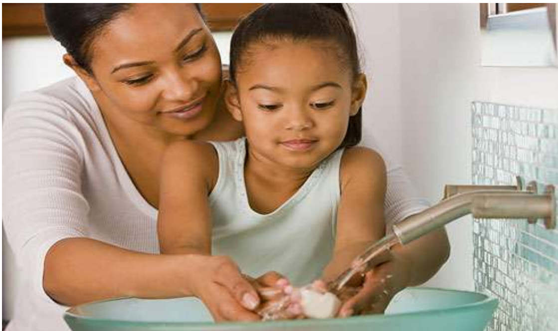
Slika 5.9.1. Zdravstveni odgoj djece

naviku pranja ruku prije i nakon obavljanja nužde. Slika 5.9.1. prikazuje zdravstveni odgoj djevojčice. U djece treba razvijati i pravilne navike u prehrani. [18]