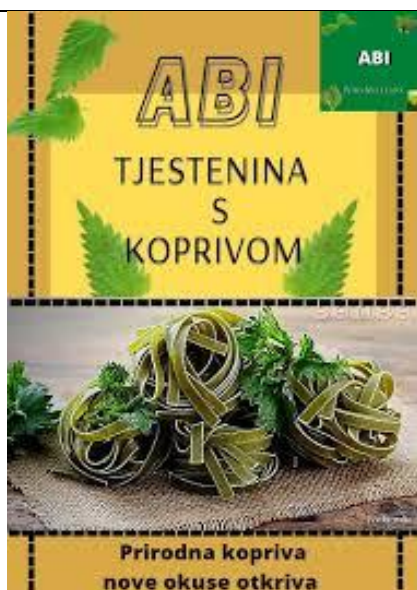
Slika 18. Tjestenina s koprivom

Za pripremu tjestenine od koprive najčešće se koriste durum griz i liofilizirana trava koprive, no postoje različiti načini proizvodnje koji ovise o recepturi proizvođača [36, 37]. Tjestenina s koprivom (rezanci i pužići ) prikazana je na Slici 18 i 19.