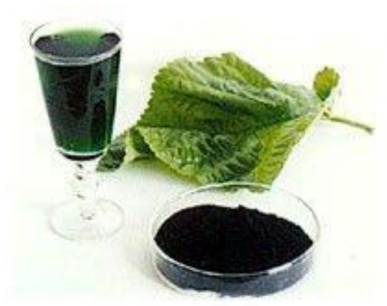
Slika 20. Klorofil

E140 klorofil je dopušten za bojenje engleskog vrsta sira Sage Derby , marmelada, pekmeza, džema i sličnih voćnih pripravaka i proizvoda smanjene energetske vrijednosti. Upotrebljava se u masama za punjenje, topljenom siru, voćnom jogurtu, preljevima, za ukrase kod pekarskih proizvoda, kiselom mlijeku, sladoledu, raznim umacima, preljevima za salate i bombone, prašcima za pudinge, deserte, kreme, bezalkoholnom piću, juhama, koncentratima za umake i juhe, dodacima jelima, senfu, majonezi, grickalicama, začinskim mješavinama te dodacima prehrani [38].