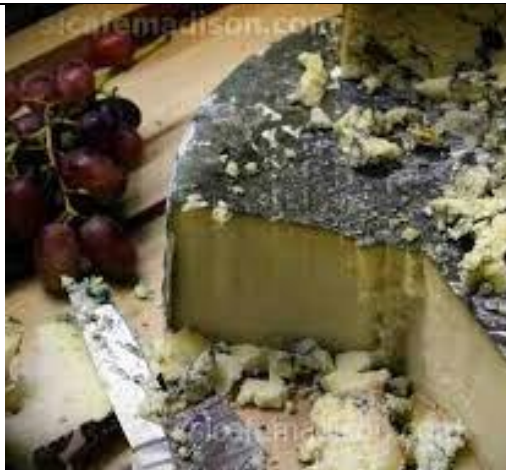
Slika 13. Cornish sir