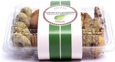
Slika 16. Čajni kolačići s koprivom, izvor: https://ducan- mrkvica.hr/proizvod/koprivini-cajni- kolacici/