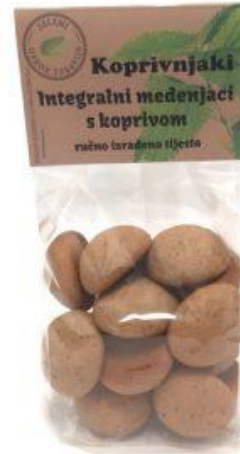
Slika 17. Integralni medenjaci s koprivom, izvor: https://vocarna.hr/trgovina/keksi- kolaci-med-slatko/koprivnjaki-integralni- 150g-zeleni-obrok/