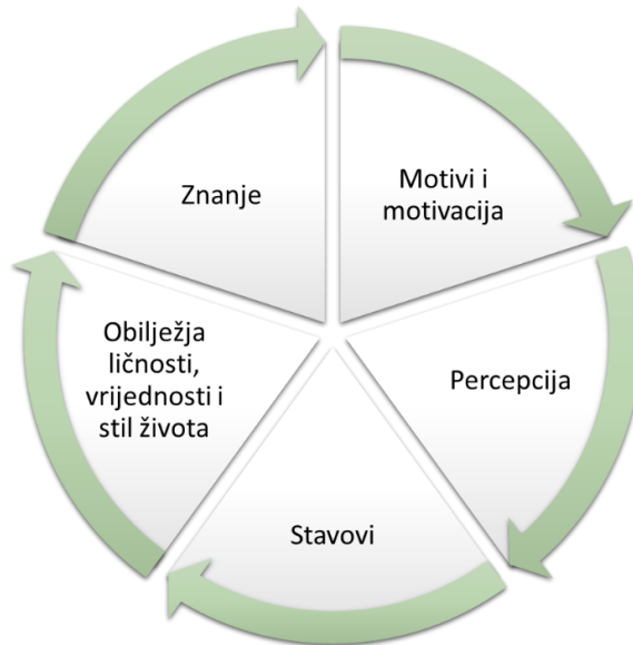
Slika 2. Osobni čimbenici potrošačkog ponašanja