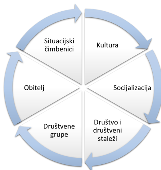
Slika 1. Društveni čimbenici potrošačkog ponašanja

Razlikuju se dvije skupine čimbenika potrošačkog ponašanja: društveni i osobni čimbenici. Društveni čimbenici podrazumijevaju sljedeće: kulturu, socijalizaciju, društvo, društvene staleže, društvene grupe, obitelj i situacijske čimbenike, što je vidljivo na Slici 1.