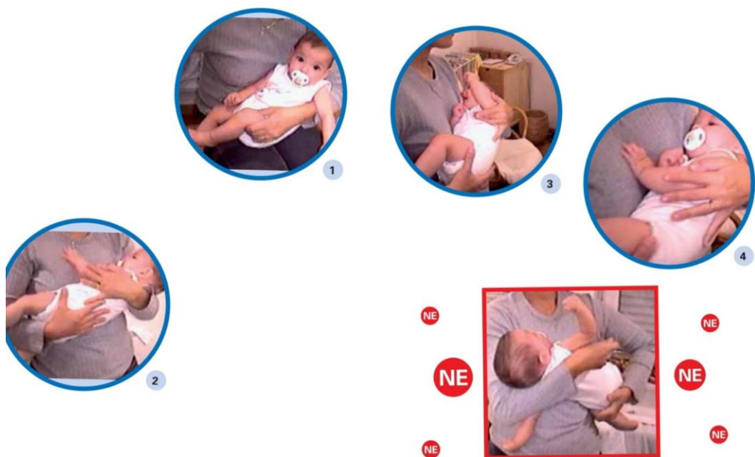
Slika 4. Hranjenje djeteta