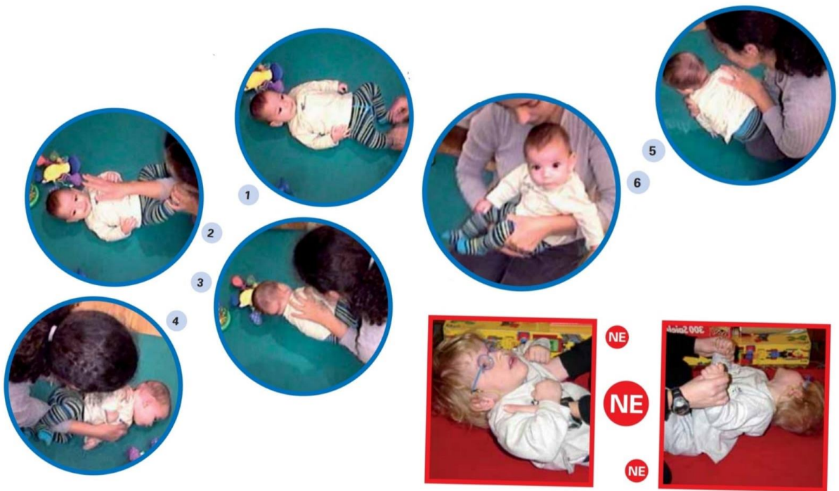
Slika 1. Podizanje djeteta