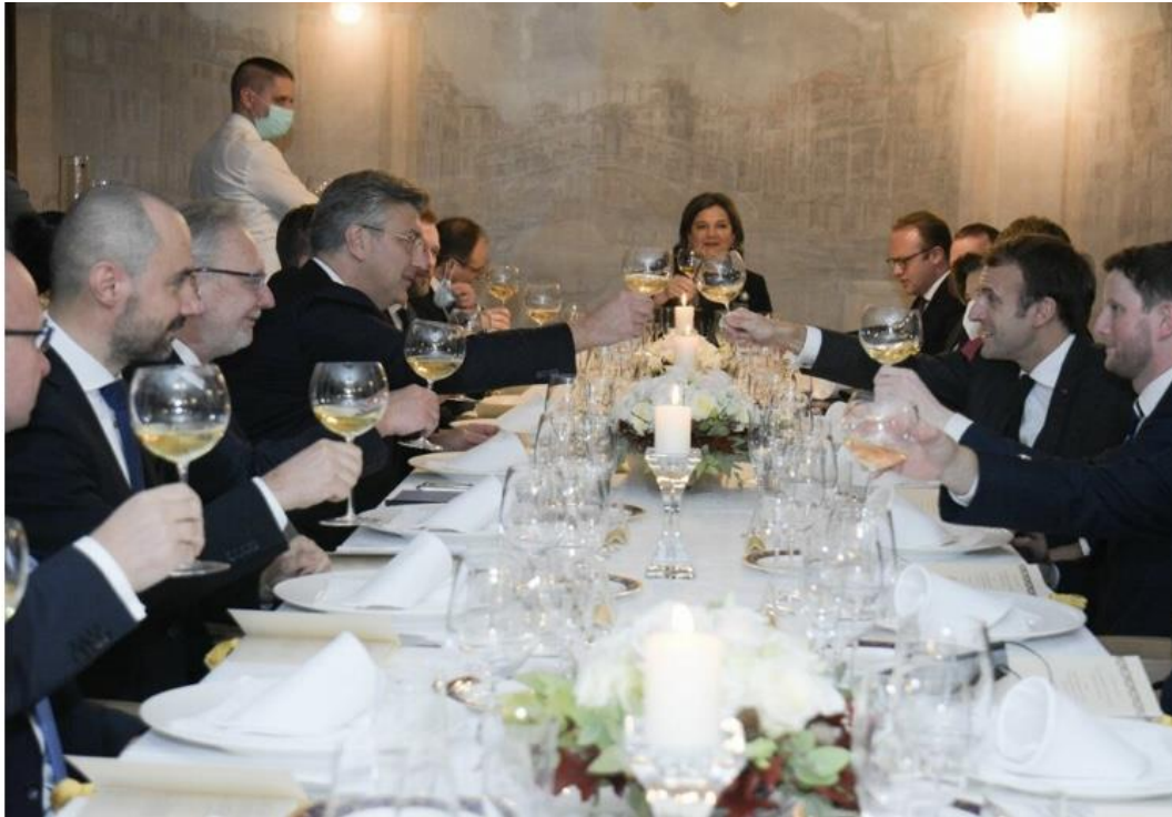
Slika 2. Radna večera francuskog predsjednika i hrvatskog premijera u restoranu u Zagrebu