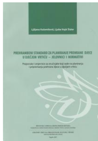
Slika 2. Prehrambeni standard za planiranje prehrane djece u dječjem vrtiću - jelovnici i normativi

specifične bolesti poput celijakije ili dijabetesa). U suradnji s glavnim kuharom planira nabavu namirnica, odgovara za kvalitetu i kvantitetu prehrane, mikrobiološku ispravnost hrane te prati i valorizira kako djeca prihvaćaju određene obroke. Mnoga su djeca upravo u predškolskim ustanovama u društvu druge djece i odgojitelja kušala mnoga jela i namirnice koja kod kuće nisu imala prilike ili želje kušati. Na formiranje zdravih navika i odnosa prema vlastitom tijelu i drugim ljudskim bićima utječe okruženje u kojem djeca svakodnevno žive. Stoga posebnu odgovornost odraslih i mnoge mogućnosti za pravilan i cjelovit rast i razvoj djece rane dobi vidim upravo u kvalitetno osmišljenim programima i okruženju u predškolskim ustanovama.