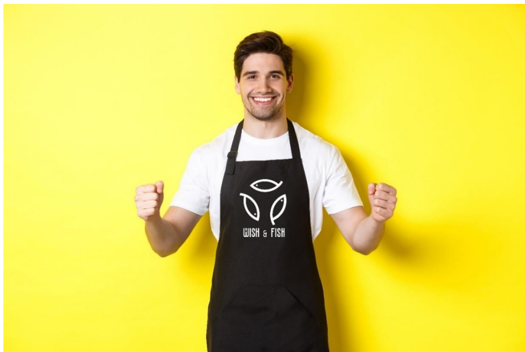
Slika 22. Personalizirana pregača za konobare