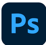
Slika 2. Ikona programa Adobe Photoshop 2020.