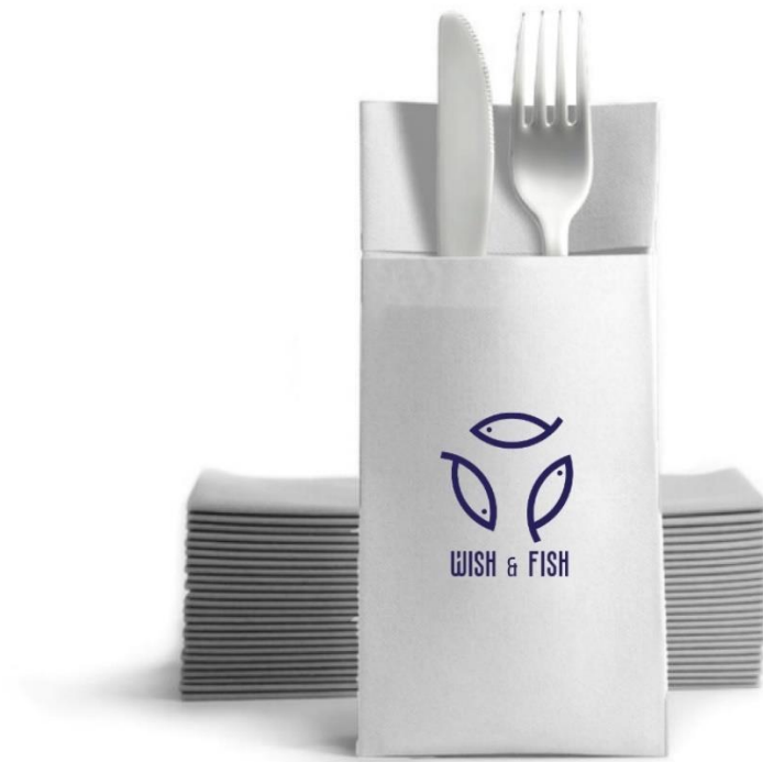
Slika 17. Izgled bijele personalizirane salvete