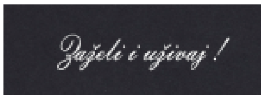
Slika 12. Slogan

Na dnu stranice stavljen je naš slogan „Zaželi i uživaj!“. Želja je bila ukomponirati slogan sa nazivom restorana i logotipom. Za tipografiju slogana korišten je font Embassy BT.