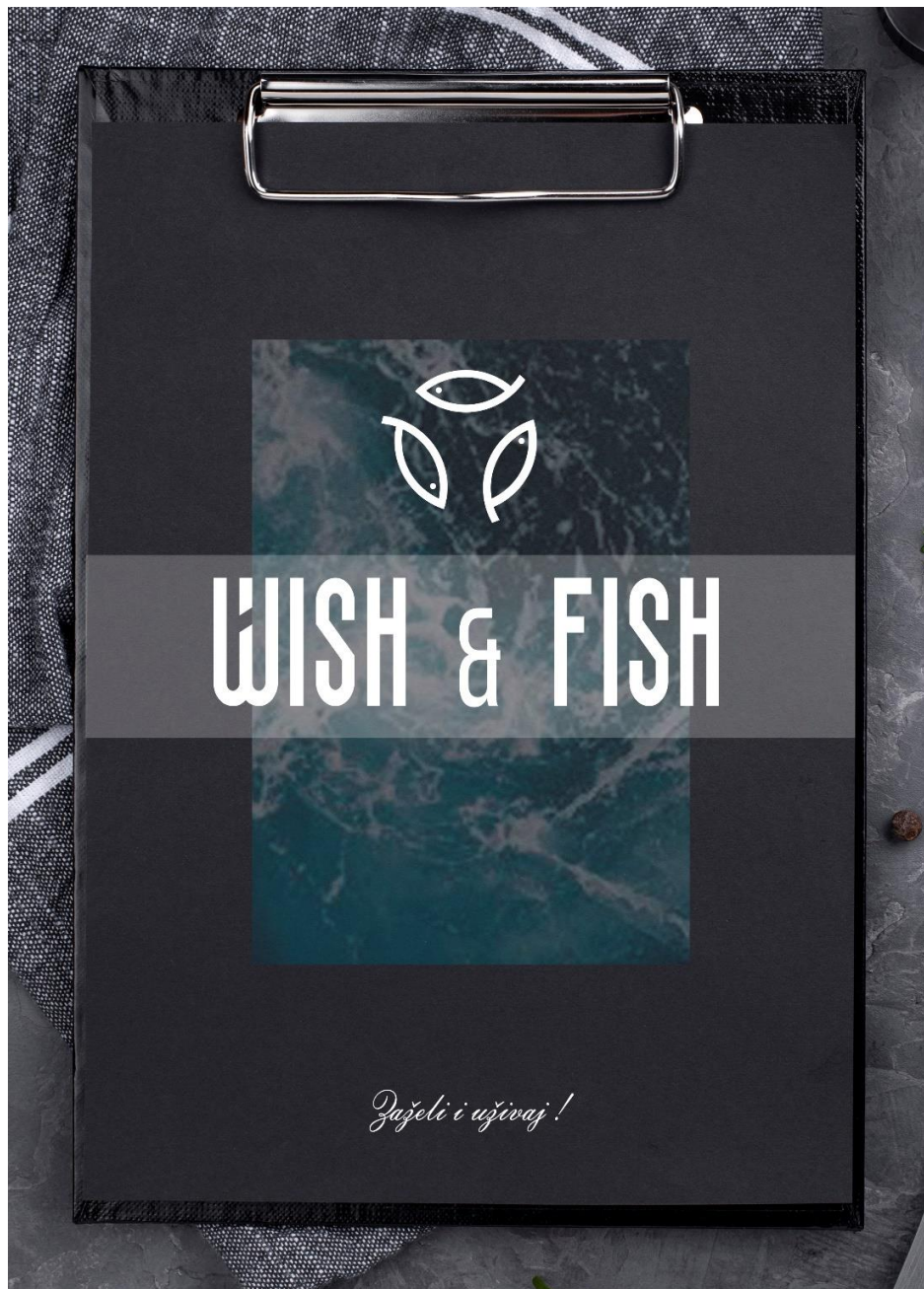
Slika 11. Izgled prednje stranice jelovnika

Na prednjoj strani jelovnika koji će biti dostupan gostima na korištenje nalazi se logotip te kako je želja bila istaknuti naziv restorana, naziv je u ovom slučaju veći od logotipa. Kako bi se razbila monotonija kao pozadinu iza tipografije i logotipa stavljen je motiv mora. Format jelovnika je 210x297.