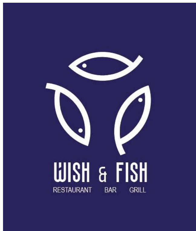
Slika 5. Negativni prostor – logotip