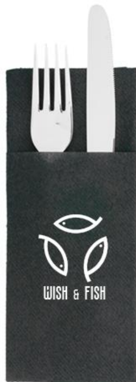
Slika 18. Izgled crne personalizirane salvete