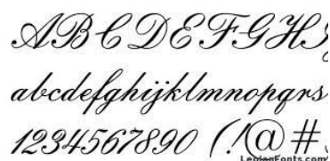
Slika 13. Font „Embassy BT“

Na zadnjoj strani stavljen je logotip u pozadinu te mu je smanjen Opacity na 14%, a Fill na 42%. Font korišten za ovaj tekst je Arial.