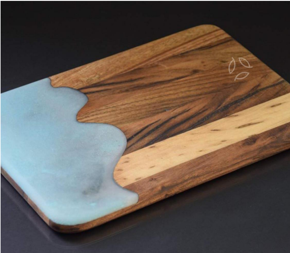
Slika 20. Izgled personalizirane daske za serviranje hrane