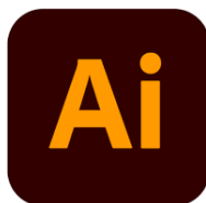
Slika 1. Ikona programa Adobe Illustrator 2019.

Programi korišteni kod izrade logotipa, posjetnica, jelovnika te ostalog popratnog sadržaja su Adobe Illustrator ( Slika 1.) i Adobe Photoshop ( Slika 2. ).