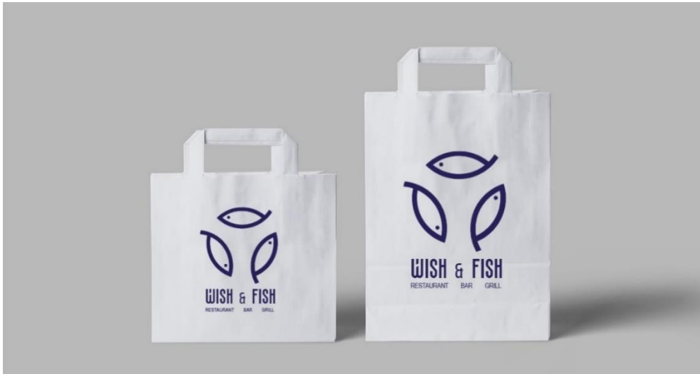
Slika 19. Izgled personaliziranih vrećica