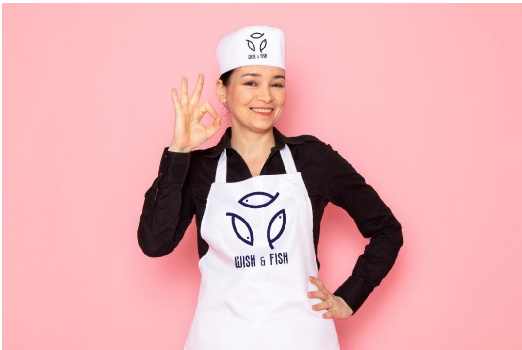
Slika 21. Personalizirana pregača za kuhare