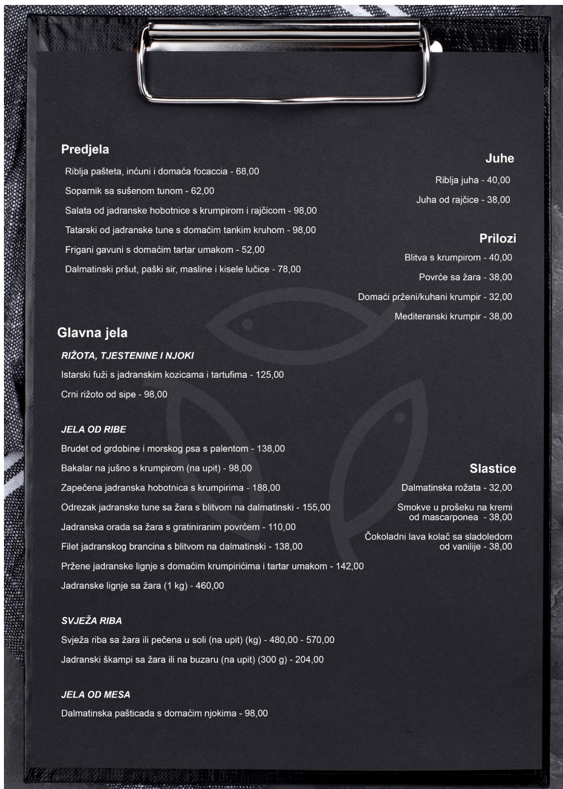
Slika 15. Izgled zadnje stranice jelovnika