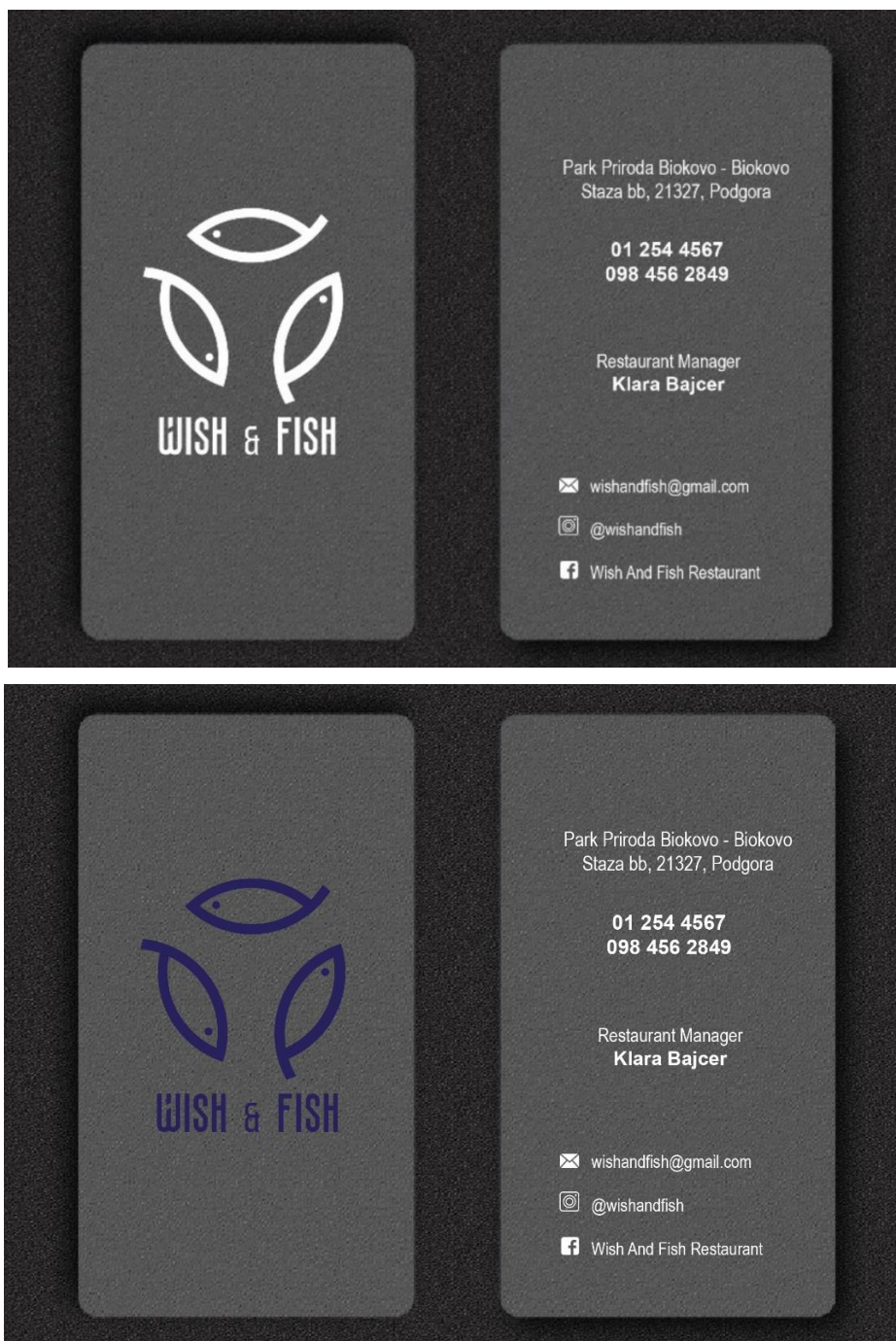
Slika 16. Izgled posjetnica

Kako je posjetnica ustvari fizički način prenošenja informacija, na prednjoj se strani nalazi logotip, a na stražnju stranu smještena je adresa restorana, kontakt brojevi, ime menadžera restorana te društvene mreže. Odabrana veličina posjetnice je 90x50 milimetara.