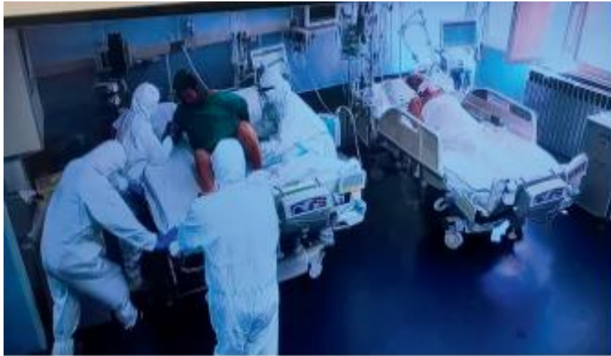
Slika 1.5.1. Respiracijski COVID centar (CRC) Rijeka; pacijent je u fazi otpuštanja s COVID-19 jedinice intenzivnog liječenja na Odjel za infektologiju (Alen Protić, COVID-19 u jedinicama intenzivnog liječenja)

tehničara uvelike se promijenio dolaskom novih protokola i smjernica za daljnji rad. To su smjernice i protokoli koji se moraju proći i raditi po pravilima, a to dodatno otežava i druge aktivnosti koje medicinska sestra mora izvršiti u svom određenom radnom vremenu. Upravo medicinske sestre izvještavaju i obavljaju potrebne sastanke kod edukacija cjelokupnog djelokruga bolnice o novim zadacima, protokolima i smjericama rada. Svojom komunikacijom i sposobnošću kod organizacije rada pokušavaju umanjiti napetost i dokinuti stresore te imaju veliku ulogu u prenošenju znanja i iskustava u svim situacijama [17].