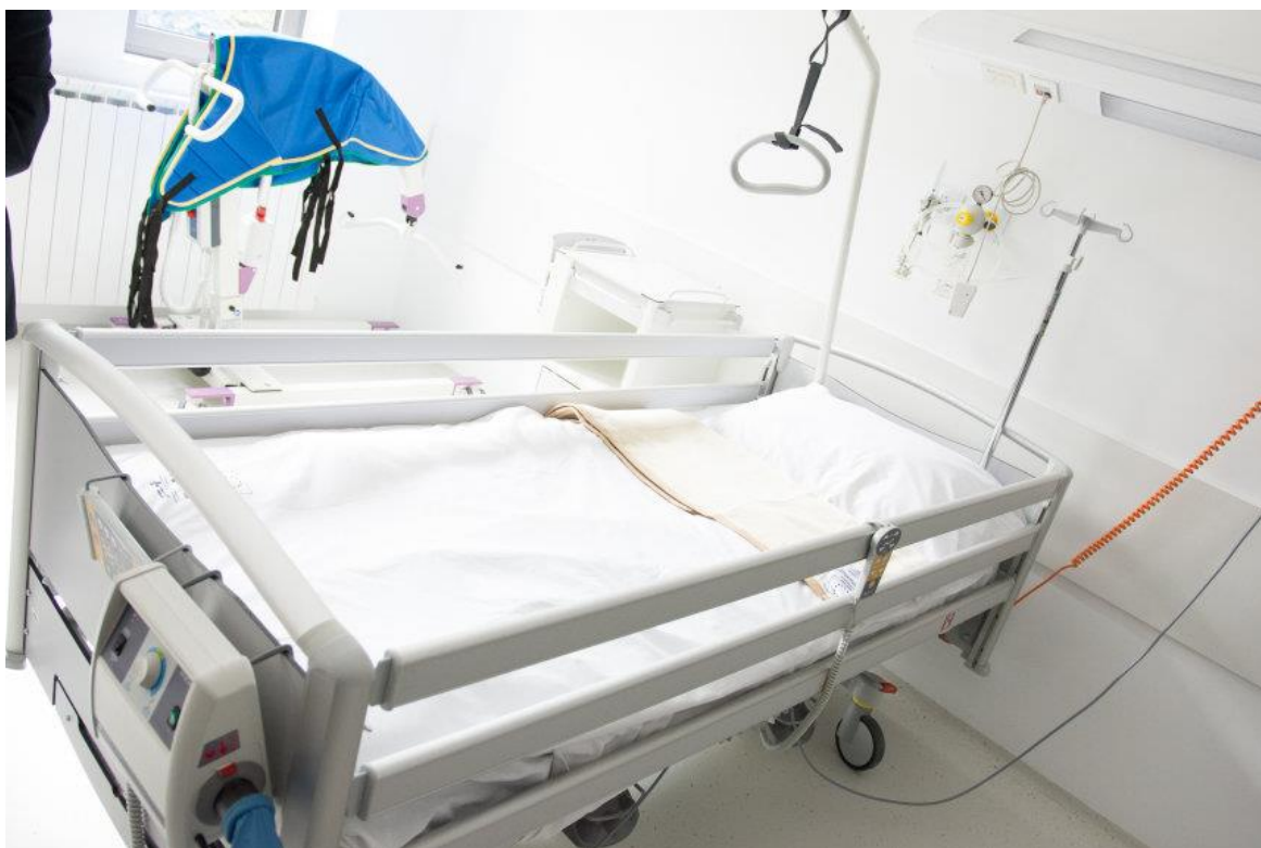
Slika 3.3.1. Krevet s antidekubitalnim madracom

U sklopu Opće bolnice Varaždin djeluje Služba za produženo liječenje i palijativnu skrb Novi Marof od 2013. godine kada je na snagu stupila odluka Vlade. Od početka prati i primjenjuje preporuke od strane Ministarstva zdravstva za implementaciju Strateškog plana razvoja palijativne skrbi u Republici Hrvatskoj, te glasi kao najmoderniji centar za palijativnu skrb u Republici Hrvatskoj. Palijativni bolnički tim broji 58 medicinskih tehničara, 2 kardiologa, interniste, socijalne radnike, psihologe, ljekarnike, fizioterapeute, psihijatre i drugo pomoćno osoblje koje je uključeno u skrb. Na slikama 3.3.1. i 3.3.2. prikazan je dio opreme koja dostupna djelatnicima Novog Marofa, prilagođena je potrebama palijativnih pacijenata te značajno olakšava provođenje skrbi i djelatnosti se obavljaju prema Zakonu o zdravstvenoj zaštiti, uključujući specijalističko – konzilijarnu zaštitu, bolničku zdravstvenu djelatnost o djelatnost pružanja stacionarnog smještaja pacijenta uz osobno plaćanje. Raspolaze s 291 posteljom, čiji su korisnici pretežno stanovnici Varaždinske županije te s područja Grada Zagreba kao i Zagrebačke županije, no prihvaća pacijente iz cijele sjeverozapadne i središnje Hrvatske [17, 18].