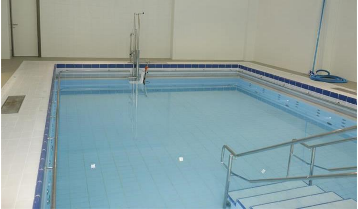
Slika 3.3.2. Bazen za provođenje hidroterapije