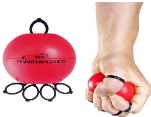
Slika 7.6.6. Handmaster