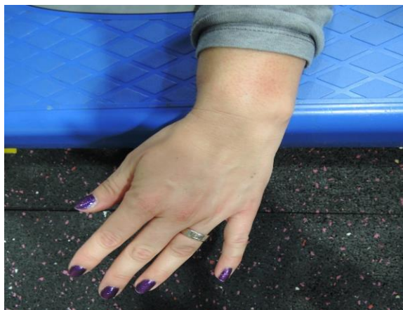
Slika 7.6.3. Aktivni pokret radijalne devijacije