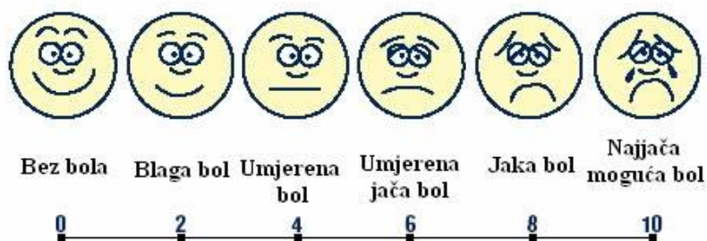
Skala za određivanje jačine bola

VAS (Vizualna analogna skala, slika 5.1.1.) se koristi kod procjene pacijentove ukočenosti i boli. Označava se od 0 do 10, ocjena 0 znači da nema boli dok ocjena 10 označava najjaču bol [6].