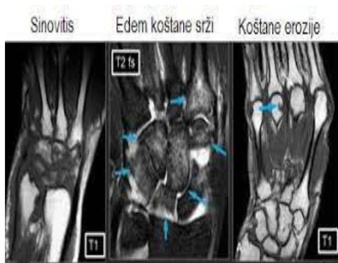
Slika 4.2.1. Prikaz magnetske rezonance šake,