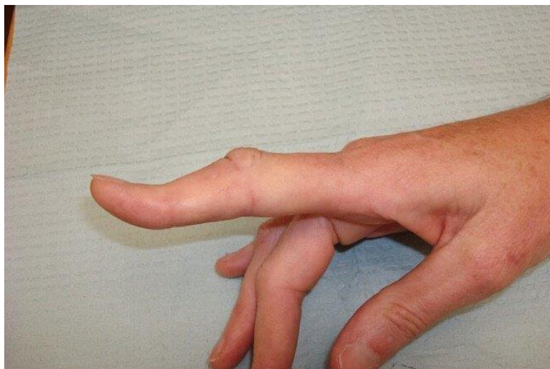
Slika 3.1.2. Deformitet „rupica za gumb“