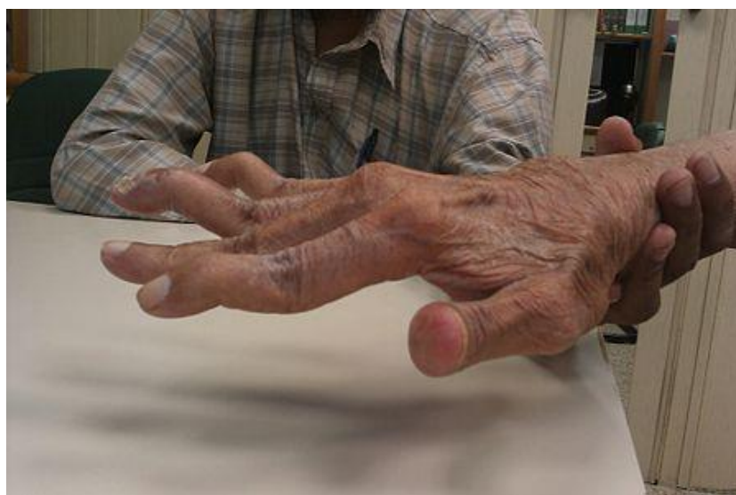
Slika 3.1.3. Deformitet „labuđi vrat“

Deformacija „labuđi vrat“ (slika 3.1.3.) nastaje kada je proksimalni interfalangealni zglob u položaju hiperekstenzije, a distalni interfalangealni zglob u položaju fleksije.