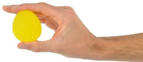
Slika 7.6.4. Jaje za jačanje šake

Često dolazi do gubitka snage u mišićima te se tada primjenjuju vježbe snaženja. Mogu se podijeliti na statičke i dinamičke vježbe. Vježbe se najčešće izvode uz pomoć pomagala: jaje za jačanje šake (slika 7.6.4.), Flex- ion (slika 7.6.5.), Handmaster (slika 7.6.6.) [14].