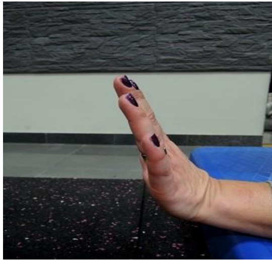
Slika 7.6.1. Aktivni pokret dorzalne fleksije

Primjeri aktivnih vježbi u ručnome zglobu (Slike 7.6.1. – 7.6.3.)