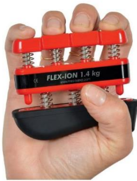
Slika 7.6.5. Flex-ion