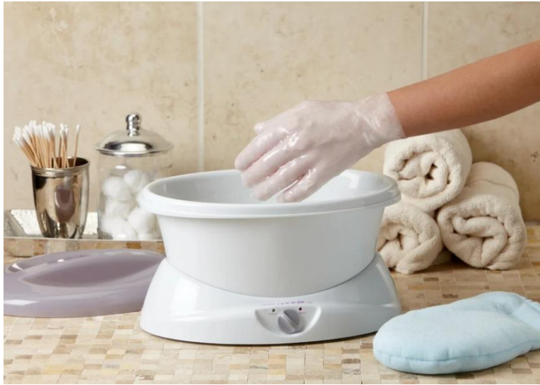
Slika 6.2.1. Parafinska rukavica

Neke od kontraindikacije terapije parafinom su : otvorene rane, kožna oboljenja, zloćudni tumori, hipertenzija.