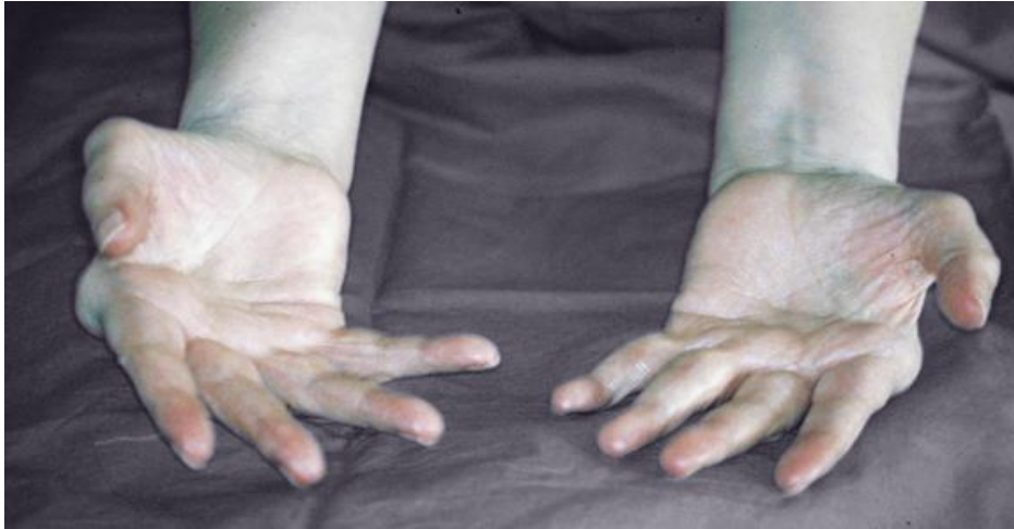
Slika 3.1.1. Deformitet „ulnarna devijacija“

U razini metakarpofalangealnih zglobova uglavnom se razvija fleksorna kontraktura te se prsti savijaju prema dlanu. Šaka tada poprima izgled „leđa devine grbe“ – deformacija „devina grba“. U Kasnijoj fazi dolazi do oštećenja zglobova, tetiva i ligamenata te prsti skrenu u ulnarnu stranu – deformacija „ulnarna devijacija“ (slika 3.1.1).