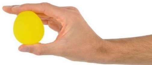
Slika 7.6.4. Jaje za jačanje šake

Često dolazi do gubitka snage u mišićima te se tada primjenjuju vježbe snaženja. Mogu se podijeliti na statičke i dinamičke vježbe. Vježbe se najčešće izvode uz pomoć pomagala: jaje za jačanje šake (slika 7.6.4.), Flex- ion (slika 7.6.5.), Handmaster (slika 7.6.6.) [14].