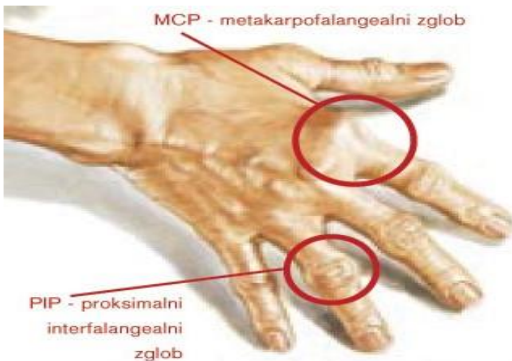
Slika 3.1. Otekline zglobova ruku