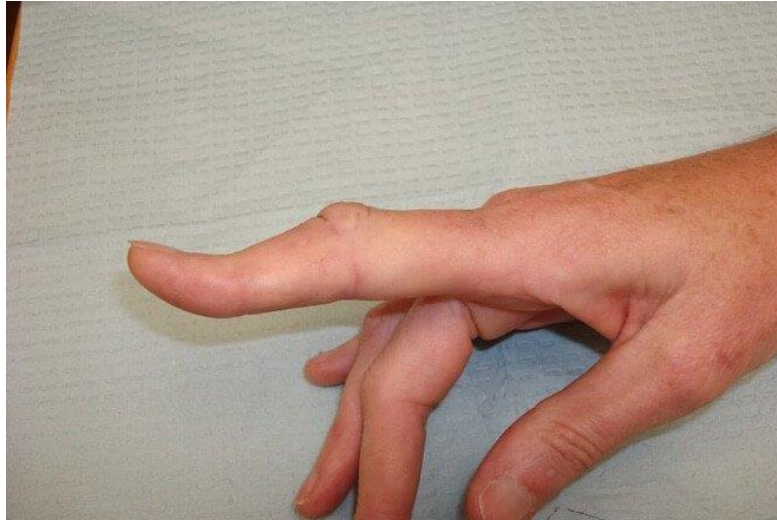
Slika 3.1.2. Deformitet „rupica za gumb“