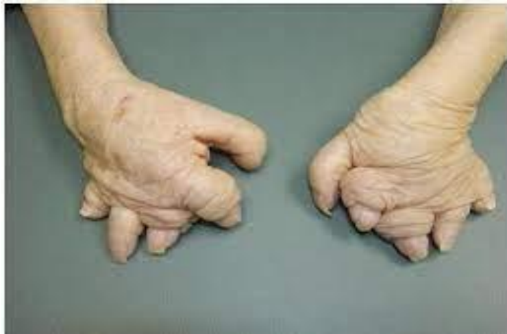
Slika 3.1.4. Mutilirana šaka