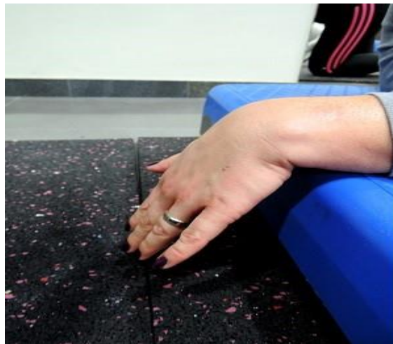
Slika 7.6.2. Aktivni pokret palmarne fleksije