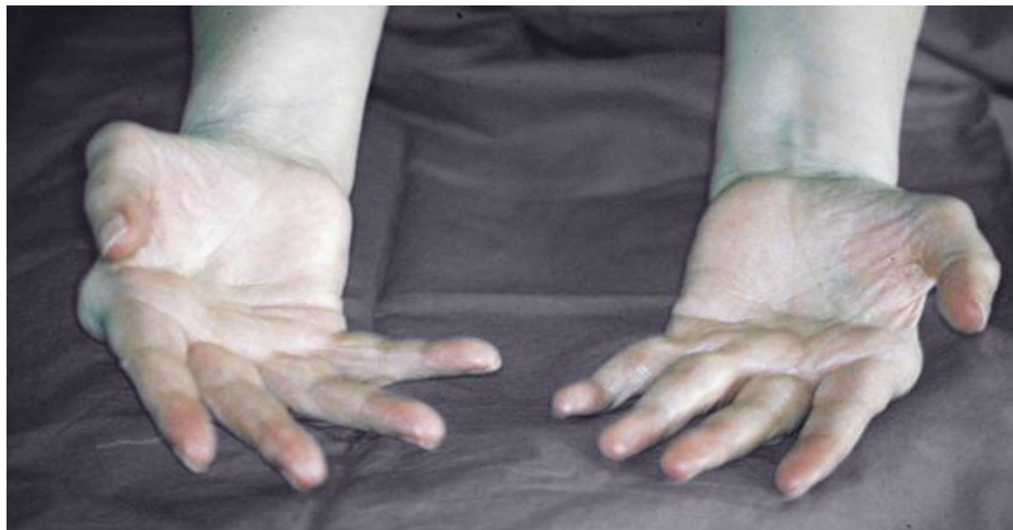
Slika 3.1.1. Deformitet „ulnarna devijacija“

U razini metakarpofalangealnih zglobova uglavnom se razvija fleksorna kontraktura te se prsti savijaju prema dlanu. Šaka tada poprima izgled „leđa devine grbe“ – deformacija „devina grba“. U Kasnijoj fazi dolazi do oštećenja zglobova, tetiva i ligamenata te prsti skrenu u ulnarnu stranu – deformacija „ulnarna devijacija“ (slika 3.1.1).