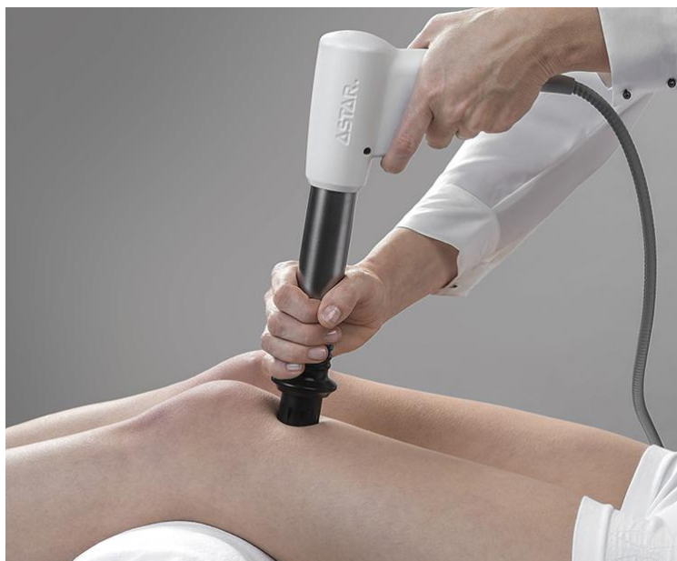
Slika 4.2. Prikaz terapije udarnim valom

Terapija traje u intervalu od 10 min, može se produžiti i na pola sata, osoba za to vrijeme može osjetiti nelagodu, peckanje i trnce [2,6].