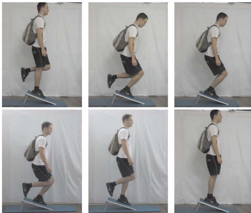
Slika 4.1.2. Prikaz ekscentričnih vježbi

Mnoga istraživanja su ukazala na velik postotak uspješnosti ekscentričnih vježbi u usporedbi sa ostalim vježbama te su postale neizostavna sastavnica u rehabilitaciji skakačkog koljena [1,9].