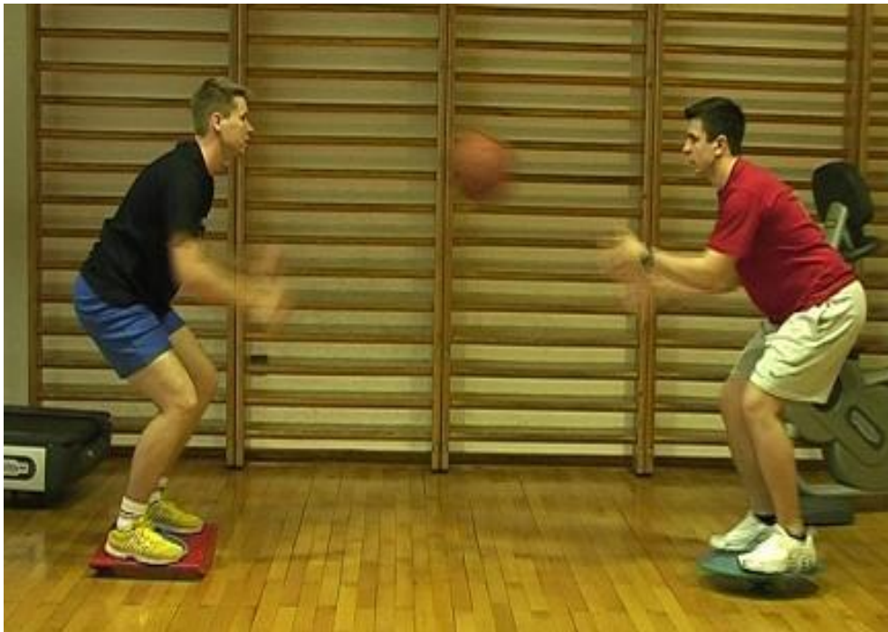
Slika 4.2.8.Prikaz proprioceptivne vježbe