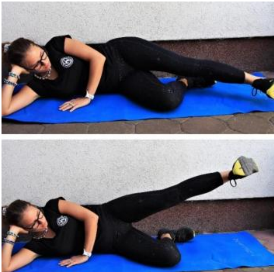
Slika 4.2.7. Prikaz vježbe snage

Opis vježbe snage 4 (Slika 4.2.7.): osoba leži na boku, glava je oslonjena na jednu ruku dok je druga postavljena dlanom na podlogu. Noga koja je na podlozi je flektirana u kuku i koljenu dok je druga ekstenzirana. Osoba odiže ekstenziranu nogu, zadrži i vrati u početni položaj. Vježba se izvodi sa 3 ponavljanja po 10-12 puta [6].