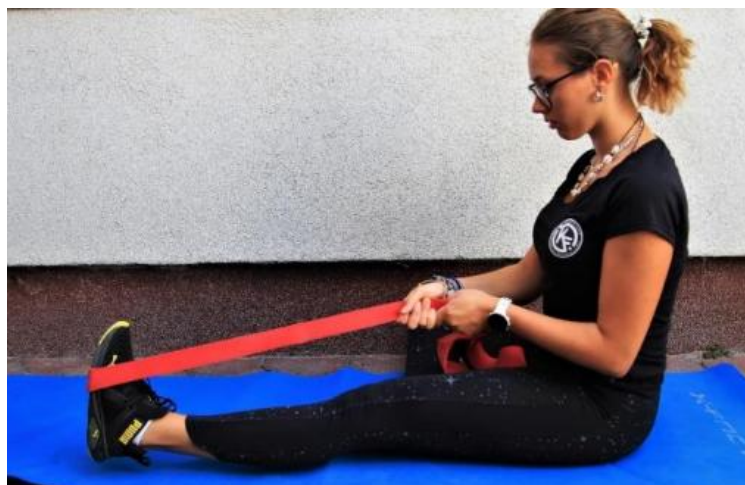
Slika 4.2.2. Prikaz vježbe istezanja

Opis vježbe 2 (Slika 4.2.2.): osoba se postavlja u sjedeći položaj. Jedna noga je ekstenzirana u koljenu dok je druga flektirana na način da stopalom dodiruje aduktore natkoljenice. Elastičnom trakom obavija stopalo ekstenzirane noge te rukama traku povlači prema sebi dok ne osjeti istezanje. Leđa uspravna. Zadrži 30 sekundi sa 3 ponavljanja [6].