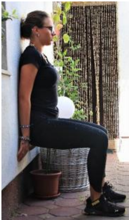
Slika 4.2.4. Prikaz vježbe snage

Opis vježbe snage 1 (Slika 4.2.4.): osoba se leđima oslanja na zid dok su donji ekstremiteti flektirani u kuku i koljenu pod 90°. osoba će osjetiti napor u natkoljениčnim mišićima, gluteusu i listovima. Ovaj položaj je poželjno zadržati 40 sekundi uz 3 ponavljanja [6].