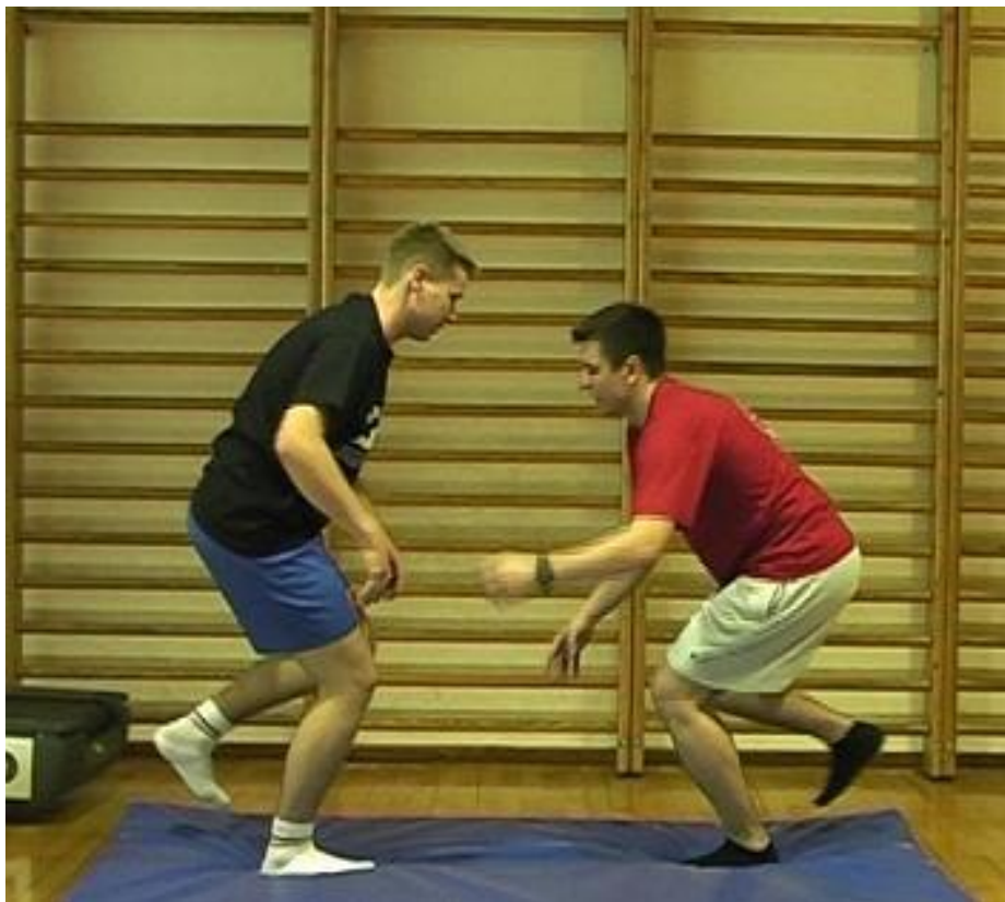
Slika 4.2.9. Prikaz proprioceptivne vježbe