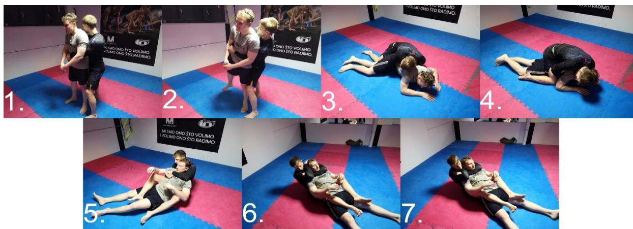
Slika 2.3.2. Stražnje gušenje ili RNC

Napadač u crnom (slika 2.3.2) iz stojećeg stava dolazi iza leđa protivnika te ga podiže i baca na pod. Napadač je srušio obrambenog na pod te se penje na njegova leđa uz to da ne dopušta protivniku da se okrene dok hvat nije uspostavljen. Nakon dobrog hvata borac okreće obrambenog i sebe na ležeći položaj na leđima, a zatim slijedi hvat oko vrata. Stisak mora biti čvrst, protivnikov grkljan u lakatnoj jami ili na podlaktici napadača te se šakom te ruke napadač hvata oko svoje lakatne jame druge ruke čiju šaku stavlja iza protivnikovog vrata za maksimalni pritisak. Nogama se ne dopušta obrambenom da se podigne.