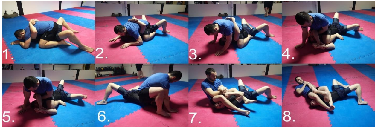
Slika 2.1.1.1. Potrebni koraci za armbar iz pozicije monta, forsira se hiperekstenzija