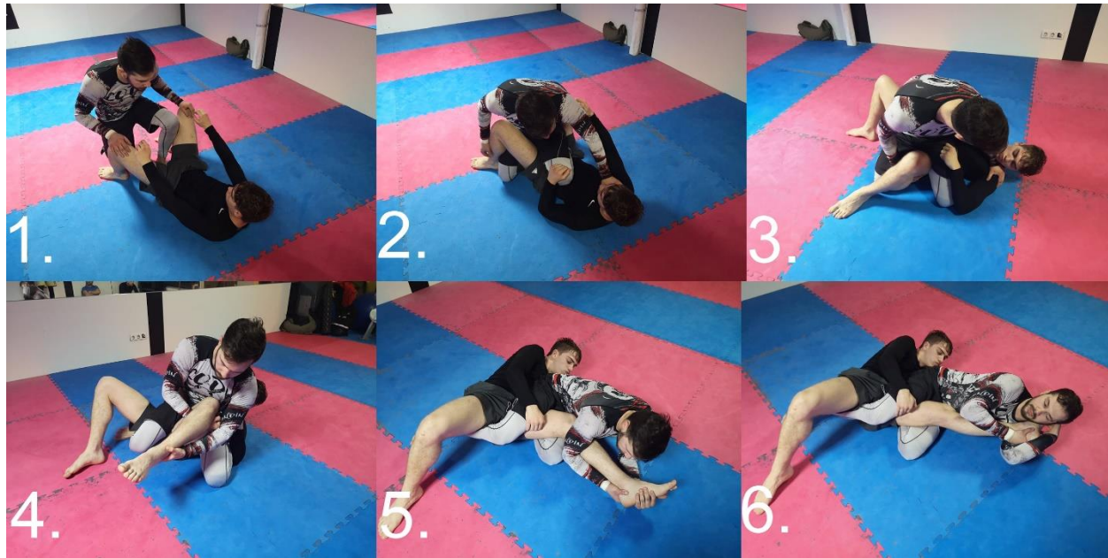
Slika 2.2.2.1. Kneebars, klasična poluga na koljeno slična armbaru na ruci, forsiranje hiperekstenzije

opkoljuje jednu nogu protivnika. Slijedi čvrsti hvat rukama oko opkoljene noge te prebacivanje težine prema natrag na tlo i povlačenje noge za sobom. Napadač stavlja stopalo iza svoje glave, rukama se drži za isto te noge ispružuje i odgurava protivnika od sebe što uzrokuje hiperekstenziju koljena.