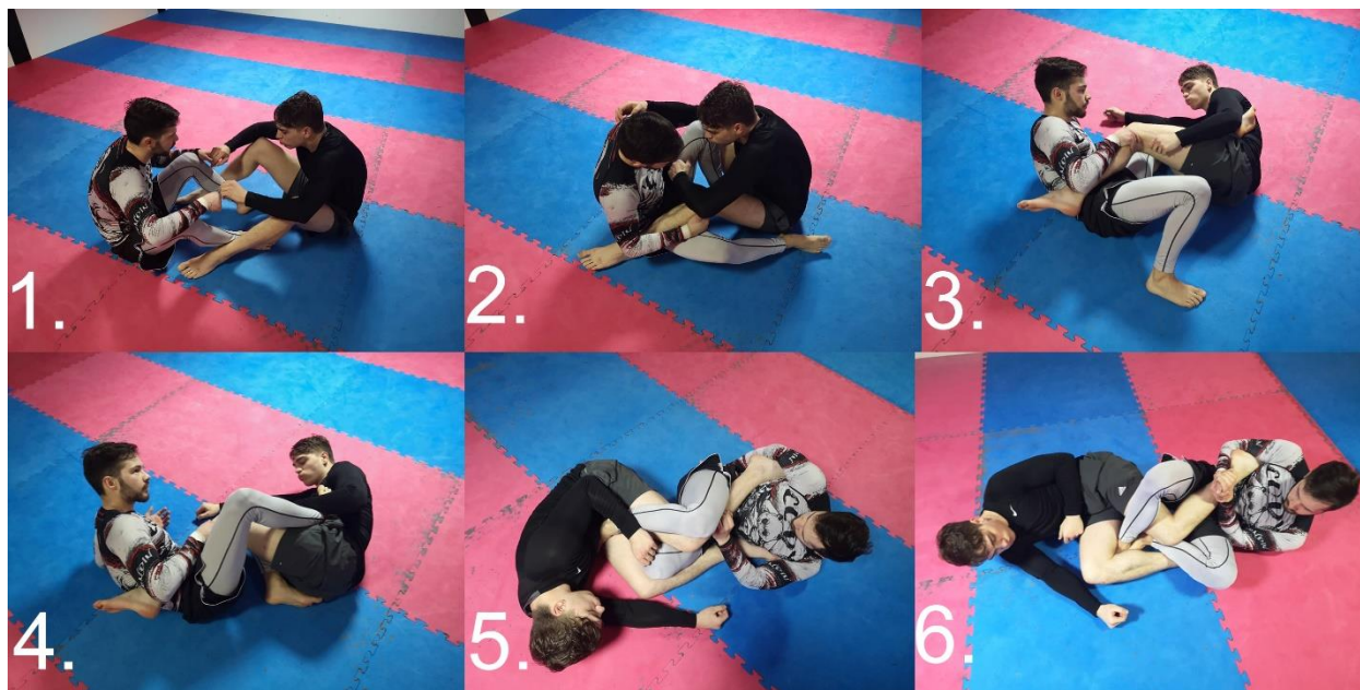
Slika 2.2.2.2. Heel hook, hvatom za petu forsira se koljeno u smjeru vanjske ili unutarnje rotacije