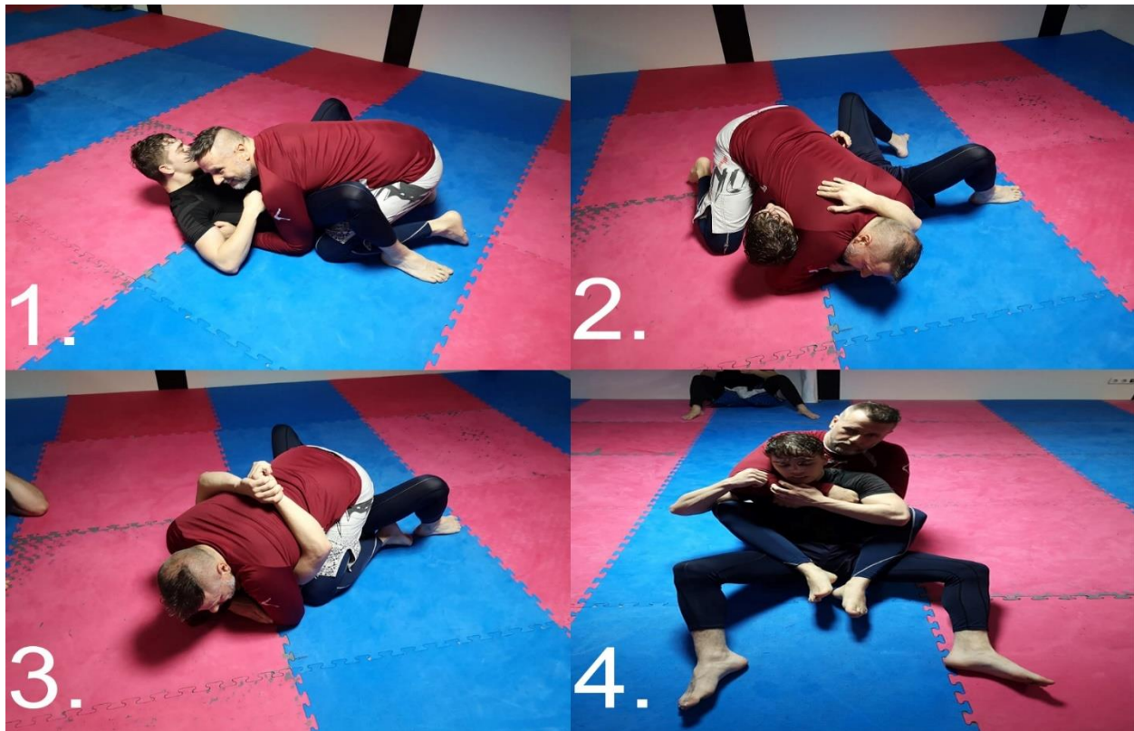
Slika 1.2.1. Na slici su dominantne pozicije; (1.) guard, (2.) side control, (3.) mount, (4.) back control

Postoje četiri glavne, a ujedno i dominantne pozicije koje pokušavamo zauzeti za postizanje kontrole nad protivnikom, one su ključni dio kod grapplinga i borbe na tlu, dakle partera, a potiču iz jiu jitsua dok se judo i hrvački zahvati više koriste kod stojke, dakle kod stojećeg položaja. Četiri dominantne pozicije su gard, mont, sajd i leđa, a njihovo preuzimanje i zadržavanje ovisi o dobrom balansu, koordinaciji i upotrebi gravitacije te vlastite težine tijela. Svaka od njih nosi svoje prednosti i nedostatke pa možemo reći da je jedna od najpovoljnijih pozicija zauzimanje i kontrola protivnikovih leđa, zatim mont, kontrola strane odnosno sajda te gornji gard što se odnosi na to da protivnik nama pada u gard. Pozicije koje nastojimo izbjeći, a krećemo od najblaže prema najgoroj jesu donji gard, odnosno kada smo mi u protivnikovom gardu, zatim slijedi položaj ispod protivnikovog sajda, položaj ispod monta protivnika te položaj pod protivnikovom kontrolom naših leđa.