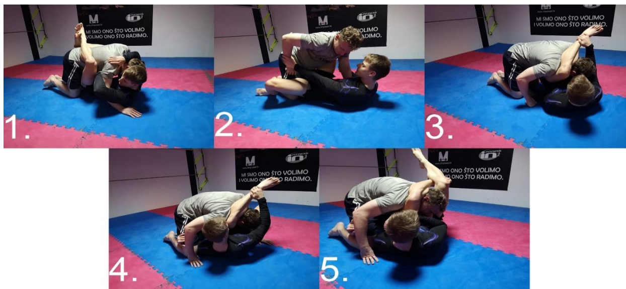
Slika 2.3.1. Gušenje nožnim trokutom iz zatvorenog garda