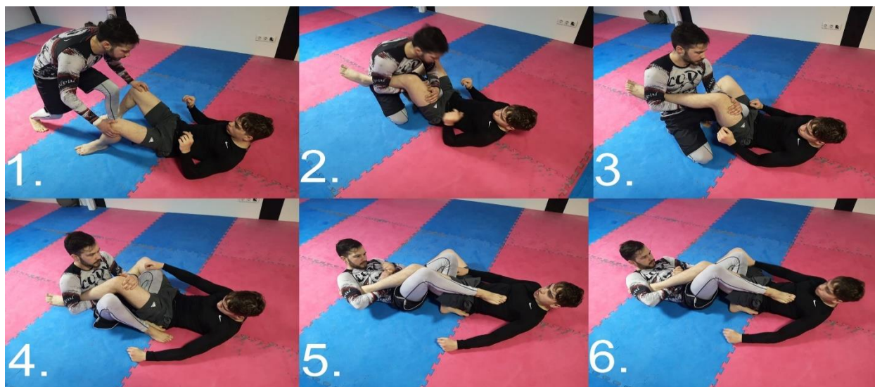
Slika 2.2.3.1. Foot lock, osnovni potez na stopalu, forsira stopalo u plantarnu fleksiju