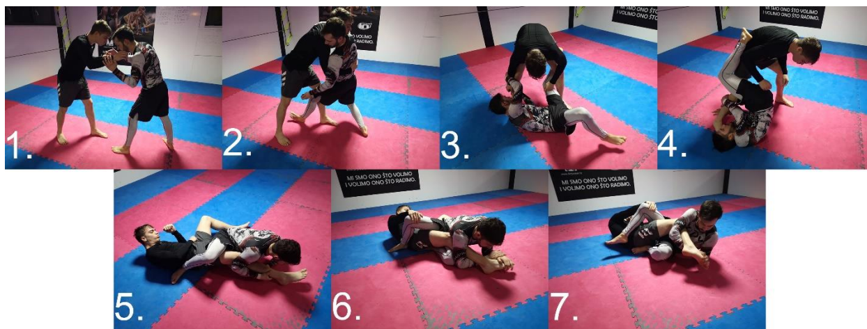
Slika 2.2.3.2. Toe hold, hvat na stopalo, točnije na prste koji forsira stopalo u everziju ili inverziju

Slijedi malo napredniji pristup toe holdu. Borci su u stojećem položaju gdje će napadač u bijelom (slika 2.2.3.2.) ući jednom nogom između nogu obrambenog. Napadač se nogom hvata za jednu potkoljenicu obrambenog, a rukama za drugu. Slijedi prebacivanje objih nogu na jednu nogu protivnika te savladavanje protivnika i prisiljavanje da padne na tlo. Noge su omotane oko nadkoljenice i trupa obrambenog, a rukama se hvata stopalo preko prstiju u ključ. Ovisno o položaju boraca stopalo se forsira u smjeru everzije ili inverzije.