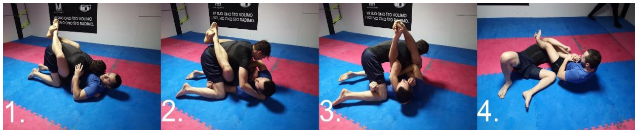
Slika 2.2.1.2. Potrebni koraci za armbar iz pozicije garda, forsira se hiperekstenzija

Borac u plavom ( slika 2.2.1.2. ) nalazi se u poziciji zatvorenog garda, valja imati na umu da je on u povoljnijoj pozicije te je napadač. Donji se borac hvata jednom rukom iza protivnikove nadkoljenice, a drugom za podlakticu na suprotnoj strani. Donji borac zatim okreće trup da bi došao na protivnikovu stranu te mu suprotnu nogu prebacuje preko glave. Jedna ruka još uvijek ostaje čvrsto prihvaćena za protivnikovu podlakticu. Napadač se objema rukama hvata za podlakticu protivnika te ispružuje noge što ga ujedno prisiljava da padne na pod. Kao i kod prijašnjeg završetka, valja prekrižiti noge, okrenuti palac prema gore i ako je potrebno podići kukove da bi se još više forsirala hiperekstenzija lakta.