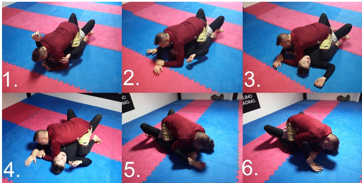
Slika 2.1.2.1. Americana, forsiranje ramena u vanjsku rotaciju

Americana iz pozicije monta, dominantni borac u crvenom ( slika 2.1.2.1. ) osigurava gornji položaj. Napadač hvata ručni zglob donjeg borca sa suprotnom rukom, dok drugom klizi ispod lakta te otvara prostor za prolaz. Ruka koja ne osigurava ručni zglob povlači se ispod nadlaktice. Napadač se hvata za svoj ručni zglob u ključ. Položaj mora biti čvrsto osiguran, ruke pritisnute i noge onemogućiti pomicanje protivnika. Napadač drži ručni zglob protivnika čvrsto fiksiranim o tlo, dok istovremeno podiže svoju drugu ruku, a samim time i nadlakticu protivnika što tjera rameni zglob u vanjsku rotaciju.