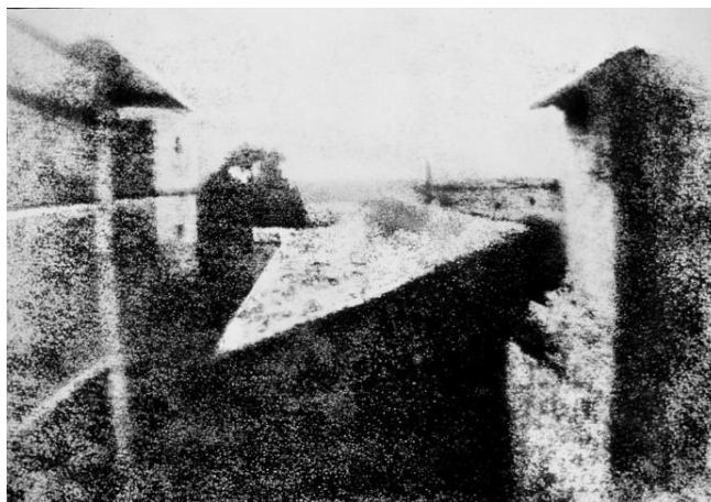
Slika 2.1 Joseph Nicéphore Niepce, „Pogled s prozora u Le Gras“