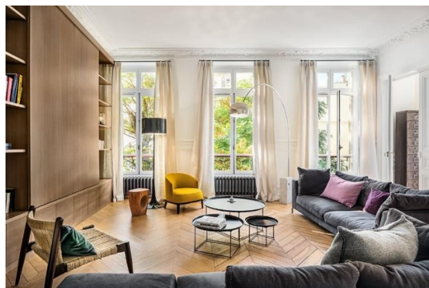
Slika 2.15 Fotografija interijera Francois Guillemina

Fotografija interijera arhitekture bilježi unutrašnjost arhitektonskih građevina. Za ovu vrstu fotografije potrebno je imati stativ, rasvjetu i širokokutni objektiv kako bi što više prostorije zabilježili u fotografiji. Fotografiranje interijera često je izazovno jer postoji ograničena dostupnost svjetla unutar prostorija građevine te je stoga potrebna dodatna rasvjeta poput bljeskalica i studijskih reflektora s difuznim površinama za „mekanu“ rasvjetu bez oštrih sjena. Fotografiranje interijera arhitekture može se izvesti i s ambijentalnim svjetlom propuštenim kroz prozore i krovne prozore, kao i unutarnja rasvjetna tijela koristeći metodu „bracketing“ kojom stapamo više ekspozicija u jednu fotografiju. Ovom metodom dobijemo pravilno osvijetljenu unutrašnjost prostorije zajedno s pogledom kroz prozore. Dakle, postoje dvije opcije za osvjetljavanje fotografije: prirodno ili umjetno svjetlo, a najbolja rasvjeta za fotografiranje interijera bit će kombinacija oba. Ključno je ne dopustiti da jedan od izvora svjetla nadjača drugi. Ako se pravilno koristi i dobro uklopi u naknadnoj obradi, rezultat je najbolje moguće osvjetljenje za fotografiju interijera. [21]