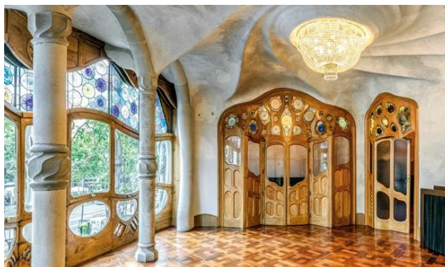
Slika 2.30 Interijer Case Batlló