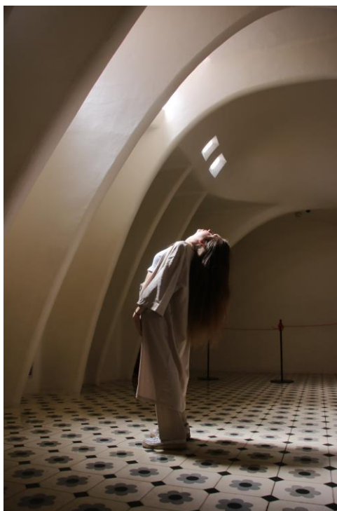
Slika 3.3 Serija fotografija – Casa Batlló

Za seriju fotografija u Casa Mili odlučila sam fotografije odraditi na krovu zgrade jer smatram kako je on, tako apstraktan i poseban, najzanimljiviji dio zgrade. Skulpture na krovu su bež boje pa tako i model ima odjeću bež boje.