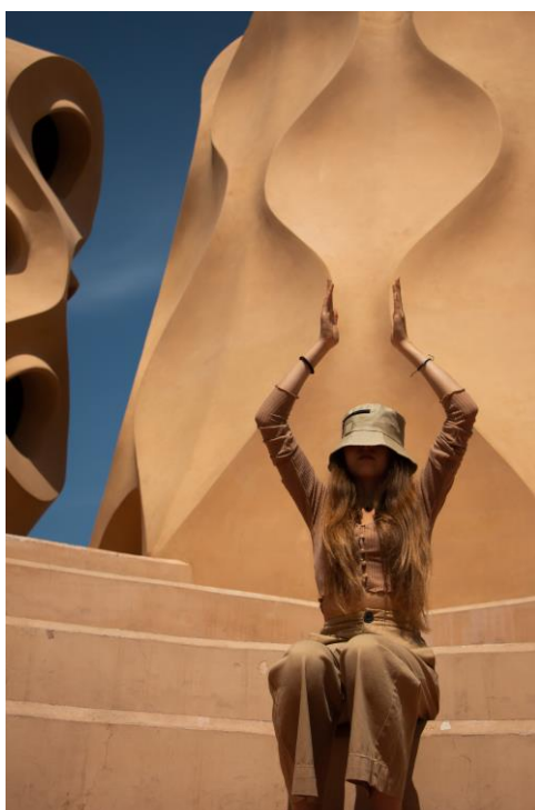
Slika 3.4 Serija fotografija – Casa Milà

Za seriju fotografija u Casa Mili odlučila sam fotografije odraditi na krovu zgrade jer smatram kako je on, tako apstraktan i poseban, najzanimljiviji dio zgrade. Skulpture na krovu su bež boje pa tako i model ima odjeću bež boje.