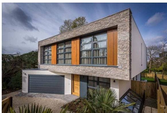
Slika 2.12 Fotografija eksterijera Ricka McEvoya

dinamičnom fotografijom. Prilikom fotografiranja eksterijera obično se iskorištava dostupno svjetlo danju, a noću se koristi ambijentalno svjetlo od susjednih uličnih svjetala, krajobrazna svjetla, vanjska svjetla građevina, mjesečina, pa čak i sumrak prisutan na nebu u svim situacijama osim u najtamnijim situacijama. U mnogim je slučajevima krajolik koji okružuje građevinu važan za cjelokupnu kompoziciju fotografije, pa čak i neophodan za komuniciranje estetskog sklada građevine s njezinim okolišem. Fotograf će često uključiti cvijeće, drveće, fontane ili kipove u prednji plan kompozicije, iskorištavajući njihovu sposobnost da lakše usmjere pogled na kompoziciju i njen glavni subjekt, građevinu. Fotografija iz zraka je u trendu jer prikazuje različite i jedinstvene perspektive građevine koja se fotografira. To može uključivati prikazivanje granica posjeda, otkrivanje lokacije u geografskom pogledu i stavljanje konteksta u okolni krajolik. Postavljanjem arhitektonskih elemenata u kompozicijska pravila fotografija, poput pravila trećina i pravila zlatnog reza, postiže se dobar rezultat fotografije eksterijera. Igranje s perspektivom pri fotografiranju eksterijera arhitekture može dovesti do zanimljivih i dramatičnih fotografija koje se mogu smatrati i umjetničkim djelom. Također, igranje sa svjetlom i sjenom može nastati apstraktna fotografija arhitekture.