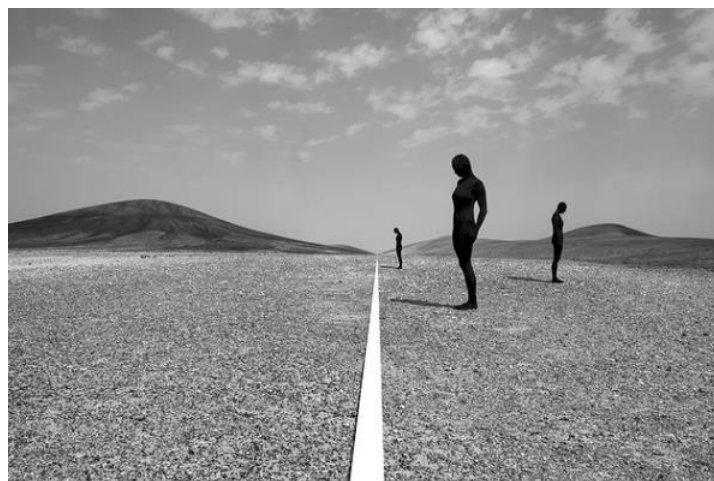
Slika 2.22 Konceptualna fotografija Astrid Verhoef

Od poznatih fotografa konceptualne fotografije izdvojila bih nizozemsku fotografkinju Astrid Verhoef. Ona postavlja scene na rubu nadrealnog. Smještajući pojedince i objekte tamo gdje im se čini da im nije mjesto, premještajući poznato u nepoznat krajolik, njezine fotografije kao da dekonstruiraju normalnost. Suprotstavljajući čovjeka i predmet, ona ispituje identitet i emocije u odnosu na moderno društvo nasuprot prirodnim prostorima. Astridine slike su na rubu nadrealizma i likovnog portretiranja. Postavljajući subjekte u neobično okruženje stvara pejzaže nepoznate ljudskom oku. Njezine slike imaju veliki kontrast između tehnologije i prirode, ljudi i nepokretnih objekata korištenjem jukstapozicije. [24]