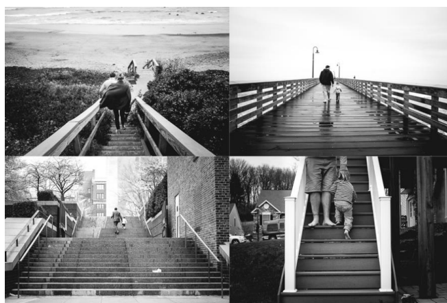
Slika 2.24 Serija fotografija Carrie Nichols

Značaj umjetnosti mijenja se u prisutnosti konteksta. Način na koji percipiramo glas unutar umjetničkog djela vjerojatno će se razviti, na primjer, kada saznamo o umjetničkoj pozadini, njezinim borbama, njezinim uvjerenjima. Neočekivani naslov ili natpis može promijeniti način na koji tumačimo elemente ili priču predstavljenu unutar okvira. Pa čak i temeljni čin postavljanja jedne slike pored drugih može imputirati djelo koje može biti nedojmljivo i samo s izvanrednom vizualnom zanimljivošću unutar konteksta zbirke.