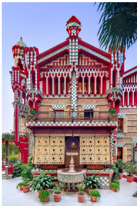
Slika 2.27 Eksterijer Case Vicens

Pogledamo li dalje od ukrasa, možemo vidjeti arhitektonski Mudejar stil, kao i oblike koji su inspirirani Indijom i Japanom. Gaudí je posebnu pozornost posvetio uglovima zgrade, koji su bili izbočeni kako bi se izbjegao strogi izgled klasične arhitekture. Ovu modernističku egzotiku - dočekala je s entuzijazmom tadašnja elita u Barceloni. [32]