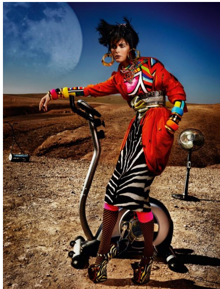
Slika 2.9 Mario Testino, „High plains drifter“