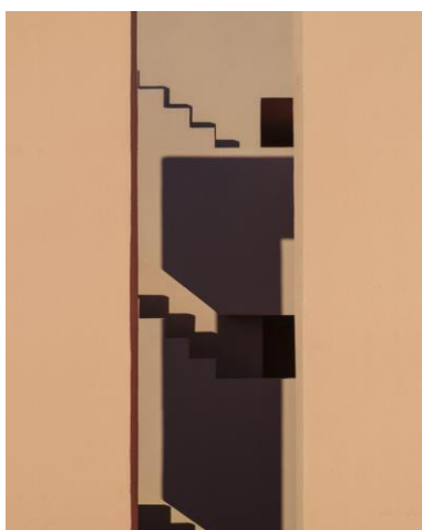
Slika 2.17 Fotografija Tekle Evelin Severin