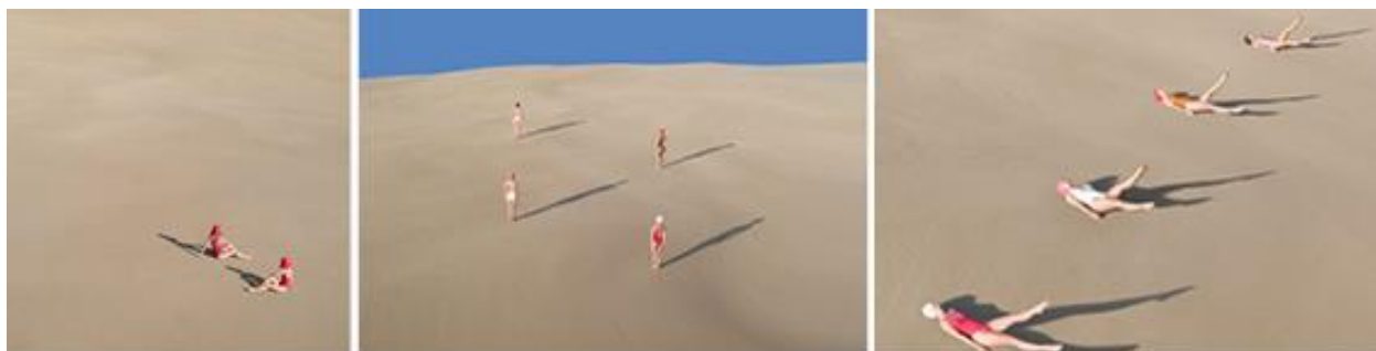
Slika 2.25 Brad Walls serija fotografija „Melankolični osjećaj usamljenosti“

Seriya fotografija australskog konceptualnog fotografa Brada Wallsa pod nazivom „Melankolični osjećaj usamljenosti“ prikazuje žene odjevene u plivačke kostime u pustinji. Fotografije su snimljene iz zraka i karakterizira ih minimalizam. Umjetnik je bio inspiriran pandemijom izazvanu Korona virusom 2020. godine i htio je prikazati psihičko stanje društva u tom razdoblju. „Figure na fotografijama namjerno su statične kako bi simbolizirale koliko smo zamrznuti u vremenu u posljednjih 18 mjeseci“, objasnio je Walls. [26]