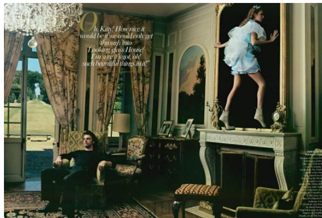
Slika 2.10 Annie Leibovitz, „Alice In Wonderland“

Od poznatih fotografa modne fotografije za izradu praktičnog djela ovog rada inspirirao me Tim Walker. Vodeći međunarodni modni fotograf proslavio se 1990-ih postavši suradnik britanskog Voguea. Od tada je postao poznat po svojim nezemaljskim, nadrealističkim i povremeno grotesknim slikama, kako u modi tako i u portretu. Njegov rad je teatralan, na granici nadrealizma i nevjerojatno romantičan. Svaka fantastična scena stvorena je s rekvizitima, a sve pomno izrađene slike postojale su u nekom trenutku. Walker nastoji stvarati svoje slike unutar onoga što on naziva „parametrima nemogućeg“ i tvrdi kako nešto mora biti fizički prisutno, a ne digitalno obrađeno, da bi se slika registrirala kod gledatelja kao istinita. [17]