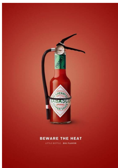
Slika 2.19 Tabascov konceptualni oglas

Umjetnost je općenito jedan od primarnih načina na koji ljudska bića stvaraju društvene komentare. Fotografi konkretno izražavaju svoja razmišljanja o društvu kroz konceptualne fotografije. Bilo da se radi o komentaru na stanje politike, tehnologije ili općeg društvenog ponašanja, te su ideje kreativno izražene konceptualnom fotografijom. Fotograf Prasad Naik projekciraao je crtični kod na subjekte koji baca sjenu sličnu zatvorskoj ćeliji odražavajući kako ljudi mogu biti zarobljeni konzumerizmom. Nije novost da su umjetnici frustrirani ponašanjem u društvu. Konceptualna fotografija samo je još jedan način da umjetnici izraze svoje frustracije i misli.