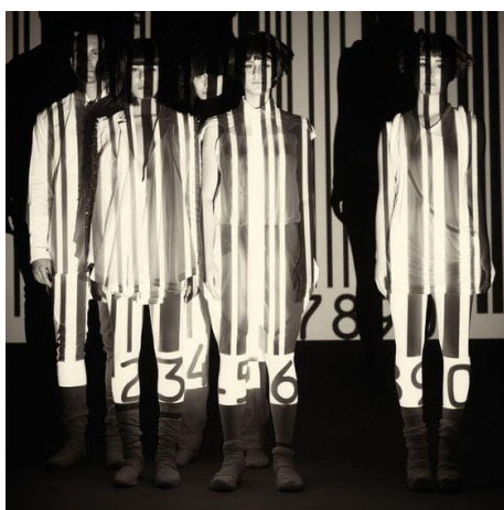
Slika 2.20 Konceptualna fotografija Prasada Naika

Umjetnost je općenito jedan od primarnih načina na koji ljudska bića stvaraju društvene komentare. Fotografi konkretno izražavaju svoja razmišljanja o društvu kroz konceptualne fotografije. Bilo da se radi o komentaru na stanje politike, tehnologije ili općeg društvenog ponašanja, te su ideje kreativno izražene konceptualnom fotografijom. Fotograf Prasad Naik projekciraao je crtični kod na subjekte koji baca sjenu sličnu zatvorskoj ćeliji odražavajući kako ljudi mogu biti zarobljeni konzumerizmom. Nije novost da su umjetnici frustrirani ponašanjem u društvu. Konceptualna fotografija samo je još jedan način da umjetnici izraze svoje frustracije i misli.