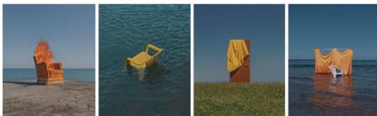
Slika 2.26 Andoni Beristain serija fotografija „Pieza Madre“

Andoni Beristain španjolski je fotograf koji je svoju najnoviju seriju fotografija pod nazivom „Pieza Madre“ posvetio nedavno preminuloj majci. Serija se sastoji od 63 fotografije, a svaka fotografija je posvećena jednoj godini njezina života. Svoje tugovanje za preminulom majkom pretočio je u ovo djelo. Fotografirao je motive koji ga podsjećaju na majku, na primjer fotelja koja gori simbolizira sjećanja na tople večeri koje bi proveo gledajući televiziju s majkom. Ova serija prikazuje bliski odnos sina i majke. [27]