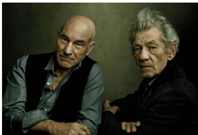
Slika 2.5 Portret fotografkinje Annie Leibovitz