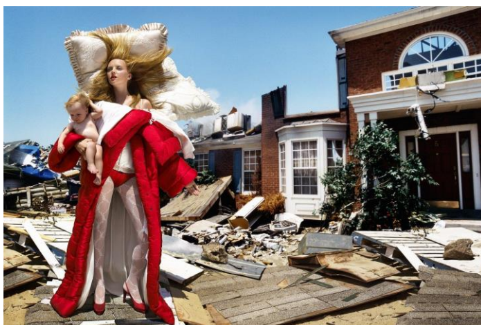
Slika 2.6 Portret fotografa David LaChapella

Od poznatih fotografa portretne fotografije za izradu praktičnog djela ovog rada inspirirao me američki fotograf David LaChapelle. Počevši od 80-ih David postaje jedan od najpoznatijih fotografa portreta. Kao tinejdžer David je radio kao fotograf za Jeffa Koonsa, Andyja Warhola i Jean-Michela Basquiata. Davidova jedinstvena percepcija popularne kulture i komičnog hiperboliziranog realizma obično se naziva „kič pop nadrealizam“. Stvorio je osebujan stil kojeg karakteriziraju bizarne ideje i pretjerivanje u bojama. David je fotografirao vodeće zvijezde moderne glazbene industrije poput Lady Gage, Whitney Houston, Madonne, Tupaca, Shakire te sportaše poput Lancea Armstronga i Muhammada Alija. [11]