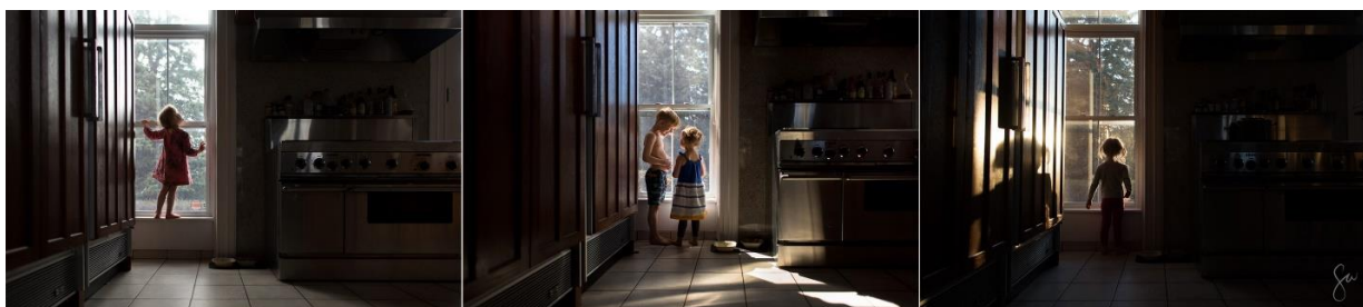
Slika 2.23 Serija fotografija Sare Wilkerson

Serija fotografija je zbirka fotografija koje su povezane i prikazane zajedno. Fotografije koje čine seriju fotografija povezane su na način da imaju istu temu i konceptualnu vezu ili su snimljene na istom mjestu. Serije fotografija često se uređuju istom metodom i u istom stilu s naglaskom na koherentnost. Za uređenje takvih fotografija koriste se iste sheme boja ili iste unaprijed postavljene postavke i filtri. Ako fotografije u skupu imaju različite stilove, neće izgledati kao dio iste serije. Serija fotografija može pričati priču. Svaka fotografija bi trebala dodati nešto priči. Ali one također moraju biti međusobno povezane. Postoje različiti načini prezentacije serije fotografija. Prezentacija utječe na to kako se fotografira serija. Fotografije mogu biti izložene jedna pored druge, u mreži ili u kolažu. [25]