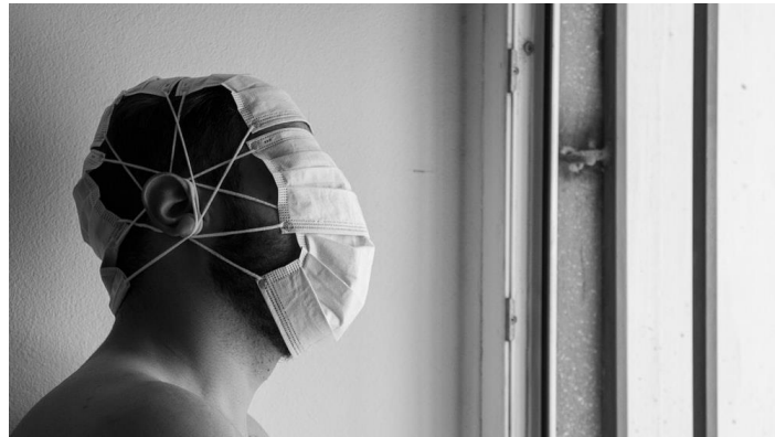
Slika 2.21 Konceptualna fotografija Khashayar Kouchpeydeh

nevjerojatno kreativnim načinima prikazivanja apstraktnog. Često je konceptualna fotografija koja odražava unutarnje stanje umjetnika dizajnirana da bude provokativna i izaziva emocije. Dok stvaranje ove vrste konceptualne fotografije može biti katarzično za fotografa, također može biti katarzično za gledatelja kada vidi emocije koje je doživio izražene na tako točan način. [23]