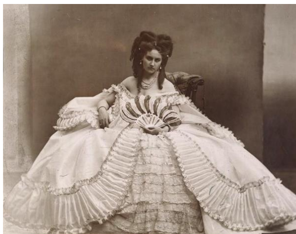
Slika 2.8 Modna fotografija Pierre-Louis Piersona

Modna fotografija postoji kao prodajno sredstvo, a psihologija koja stoji iza toga je spremnost pojedinca da vjeruje u nju. Cilj modne fotografije je prodati viziju određenog životnog stila ili društvene prihvaćenosti, ali gledateljeva je kupnja ono što čini modnu fotografiju uspješnom. Bez obzira na to koliko je fotografija umjetnog izgleda i iscenirana, modna fotografija ima zadatak da uvjeri gledatelje da će, ako nose ovu odjeću, koristiti ovaj proizvod ili se dotjeruju na takav način, upravo njima pripasti stvarnost s fotografije. Osim komercijalne svrhe, modna fotografija proizvela je neke od najkreativnijih, najzanimljivijih i društveno otkrivajućih dokumenata te je otkrila stavove, konvencije, težnje i duh vremena. [14]