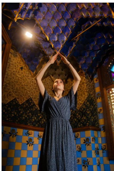
Slika 3.1 Serija fotografija – Casa Vicens

Za seriju fotografija u Casa Vicens odlučila sam se da fokus stapanja modela i arhitekture bude na odjeći. Casa Vicens ispunjena je raznolikim bojama i motivima prirode pa sam se za rješenje na pitanje odjeće odlučila na šarene haljine s uzorcima cvijeća. Na fasadi Casa Vicens prevladavaju dvije boje, zelena i crvena, pa sam upravo iz tog razloga odlučila da model za spoj s eksterijerom kuće ima na sebi crvenu majicu i zelene hlače.