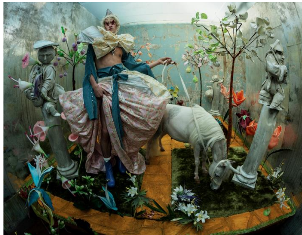
Slika 2.11 Tim Walker, „Wonderful Things“