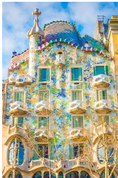
Slika 2.29 Eksterijer Case Batlló

Interijer Casa Batlló je čudo dizajna. U ulaznom hodniku kuće, jedan od prvih elemenata koji se ističe je drvena ograda izrađena tako da nalikuje na kralježnicu velikog kita. U glavnom hodniku Gaudí je stvorio valovit strop koji je uvrnut u spiralu što aludira na silu mora. U potkrovlju se ističe niz od 60 lančanih lukova, čime se postiže prostor koji asocira na rebra životinje. To je totalno umjetničko djelo, gdje umjetnik intervenira u sve: dizajn, boju, oblik, prostor i svjetlo. Sva ta bujnost vas obuzima, ali ono što najviše iznenađuje je to što je uvijek podređeno funkcionalnosti. Ljepota i funkcija spajaju se u svakom dijelu zgrade, od predvorja do krova. [35], [36]