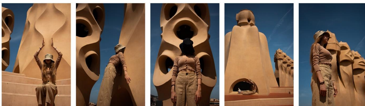
Slika 4.3 Serija fotografija – Casa Milà

Ova serija fotografija stvorena je u Casi Batlló. U ovoj seriji fotografija model bojom odjeće i položajem tijela oponaša konstruktivne elemente prostora. Na taj se način stapa s arhitekturom i dizajnom interijera Case Batlló te stvara dojam da je dio zidova ili pak dojam da ulazi u zidove, odnosno izlazi iz njih. Ova serija fotografija može se interpretirati i na način da model predstavlja Casu Batlló kao osobu, baš kao što je i Gaudí dizajnirao ovu građevinu tako da ona podsjeća na živi organizam. Fotografije u ovoj seriji poredane su tako da se u sredini nalazi fotografija s valovitim stropom koji se spiralno okreće oko lusteru, a linije spirale nastavljaju se u fotografijama pored nje s desne i s lijeve strane.