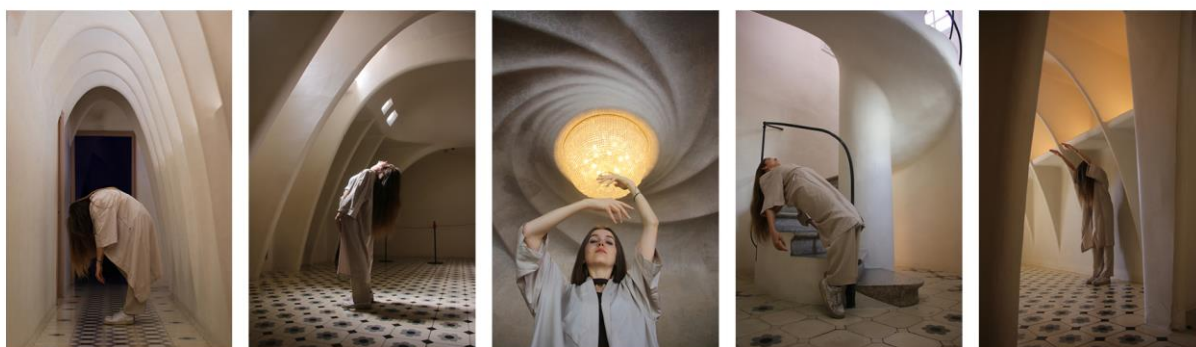
Slika 4.2 Serija fotografija – Casa Batlló

Ova serija fotografija stvorena je u Casi Batlló. U ovoj seriji fotografija model bojom odjeće i položajem tijela oponaša konstruktivne elemente prostora. Na taj se način stapa s arhitekturom i dizajnom interijera Case Batlló te stvara dojam da je dio zidova ili pak dojam da ulazi u zidove, odnosno izlazi iz njih. Ova serija fotografija može se interpretirati i na način da model predstavlja Casu Batlló kao osobu, baš kao što je i Gaudí dizajnirao ovu građevinu tako da ona podsjeća na živi organizam. Fotografije u ovoj seriji poredane su tako da se u sredini nalazi fotografija s valovitim stropom koji se spiralno okreće oko lusteru, a linije spirale nastavljaju se u fotografijama pored nje s desne i s lijeve strane.