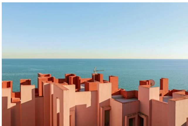
Slika 2.16 Fotografija Tekle Evelin Severin

Od poznatih fotografa arhitektonske fotografije zapela mi je za oko Tekla Evelina Severin, švedska dizajnerica i fotografkinja, koja surađuje s Vogue Brazilom, Elle Interior UK, IKEA-om i mnogim drugima. Njezine fotografije nisu klasični prikazi arhitektonskih građevina, već ona traži posebne kutove i pozicije iz kojih hvata zanimljive kompozicije. Njezine fotografije fokusiraju se na oblike, sjene, kontraste i boje. Teklin rad naglašava važnost boje u dizajnu, ne samo kao ukrasa, već kao važnog elementa u projektu. [22]