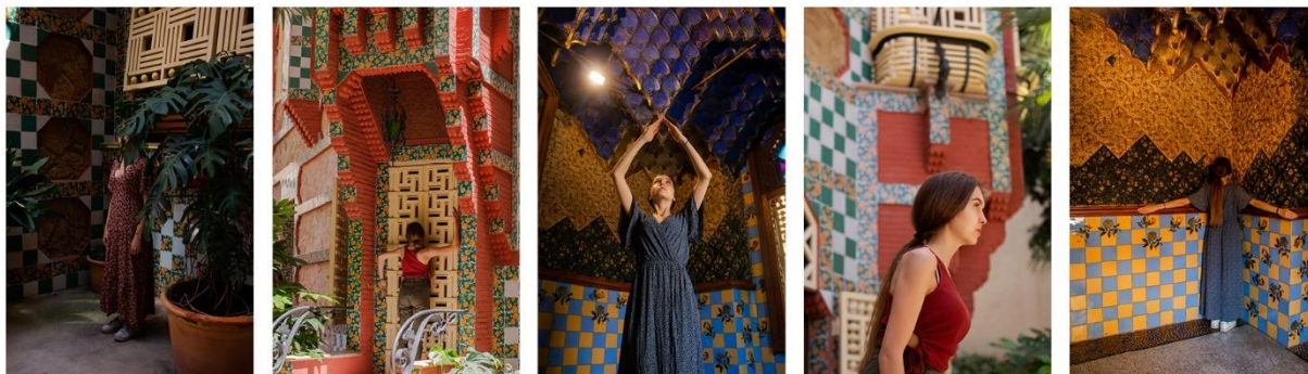
Slika 4.1 Serija fotografija – Casa Vicens

Rezultat ovog rada jesu tri serije fotografija. Svaka se serija sastoji od pet fotografija te su one izložene na način da su postavljene u niz.