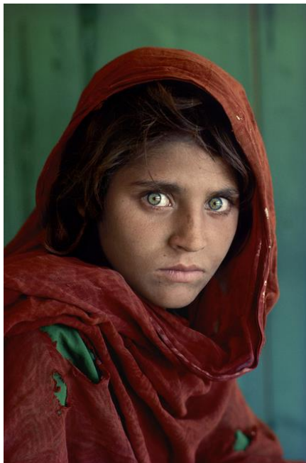
Slika 2.4 Portret fotografa Steve McCurrya

pridaje više pozornosti na portretu jer govore o raspoloženju i prikazuju emocije osobe. Iz tog je razloga prilikom fotografiranja portreta poželjno uhvatiti oči i lice subjekta u oštrom fokusu, a istovremeno omogućiti da se drugi manje važni elementi prikažu u mekom fokusu. Poziranje također igra važnu ulogu u stvaranju učinkovitih portreta jer pridonosi ukupnoj snazi i priči slike. [9] Portret u fotografiji može prikazivati različite dijelove fizičke osobe, kao na primjer samo glavu, poprsje, osobu do koljena ili cijelo tijelo. Portretna fotografija koristi se u različite svrhe poput vjenčanja, školskih događaja, za upotrebu na osobnom web mjestu, komercijalne svrhe i još u mnogo drugih svrha. [10]