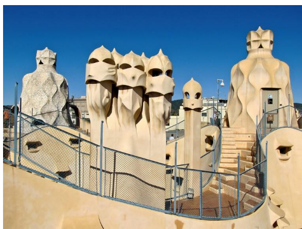
Slika 2.32 Krov Case Mile