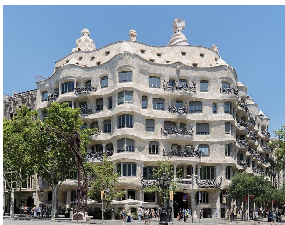
Slika 2.31 Eksterijer Case Mile

Gaudíjev arhitektonski koncept za Casu Milu bio je prirodna arhitektura. Fasada izgleda kao da je oblikovana vodom i vjetrom poput kamena kojeg je priroda pretvorila u skulpturu. Prozori su nepravilna oblika te izgledaju kao otvori špilja. Ono što je čini posebnom je to što ona nema nijednog pravog kuta, nije statičan geometrijski prostor, već je to prostor koji se stalno ponovno rađa i širi. Gaudí je rekao: „kutovi će jednog dana nestati i materijal će se manifestirati u zvjezdanim oblinama: sunce će prodirati sa sve četiri strane i bit će to slika raja ... a moja palača će više zračiti od samoga svjetla”. [38] Jedan od najznačajnijih elemenata zgrade je krov na kojem je iskoristio svu umjetničku slobodu i stvorio terasu ispunjenu apstraktno oblikovanim dimnjacima, time je ispunio sve odlike nadrealizma, umjetničkog pravca koji se pojavljuje tek 20 godina kasnije. [39]