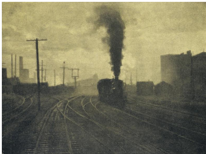
Slika 2.2 Albert Stieglitz, „Hand of Man“

kista ili dlijeta, može koristiti za stvaranje umjetničke izjave. Nastojali su uzdići fotografiju kao medij i priznati je u umjetničkim muzejima i galerijama. Prije svega, njihove su fotografije ljepotu tematike, tonaliteta i kompozicije stavljale iznad stvaranja preciznog vizualnog zapisa.