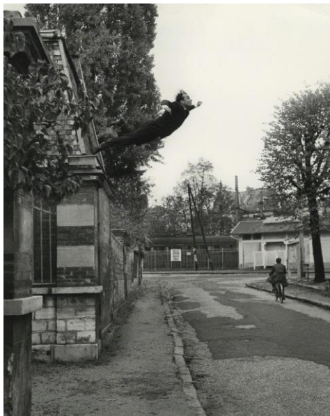
Slika 2.18 Yves Klein, „Skok u prazninu“

autori smatrali su da je sama ideja ili koncept rada važniji od finalnog materijaliziranog predmeta te da je koncept rada najvažniji dio procesa stvaranja. Fotografija francuskog umjetnika Yves Klein nastala 1960. pod nazivom Skok u prazninu smatra se jednom od najranijih konceptualnih fotografija i ključnim djelom u napretku fotografije.