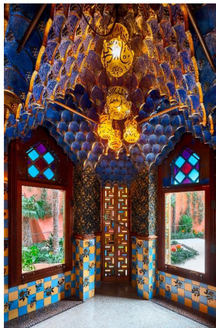
Slika 2.28 Interijer Case Vicens