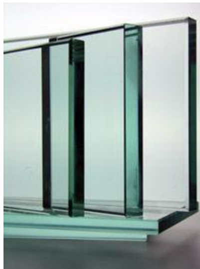
Slika 9 Ravno staklo

Ravno staklo se dobiva izvlačenjem ili valjanjem. Tehnikom izvlačenje se rade najviše prozorska stakla. Imamo 3 tehnike izvlačenja stakla Fourcaultov postupak, postupak Pittsburgh i postupak Libey-Owens. Fourcaultov postupak se izvodi tako što se izvlačenje dobiva kroz usku i dugačku mlaznicu koja pliva na talini. Pittsburghov postupak se izvodi uspravno sa površine taline iz komore iz koje se izvlači masa s mostom koji lebdi ili visi. Libey-Owensov postupak se izvodi također upravo kao i prošli postupak, sa površine taline koje na visini od 60 do 70 mora proći u horizontalno stanje.