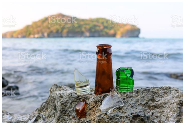
Slika 6 Staklo u oceanima

Kako se danas borimo za očuvanjem okoliša, globalnim zatopljenjem razno raznim problemima i poteškoćama jer u svijetu je sve više otpada koji ljudi bacaju i zagađuju okoliš. Staklo je jedan od materijala gdje bi ljude trebalo osvijestiti, “Što više recikliraj, ne bacaj”. Razlog tome je jer staklu u prirodi treba preko milijun godina da se razgradi, a u moru se uopće ne razgrađuje. Do sad je provjereno da se oko 60% stakla reciklira no i dalje to nije dovoljno jer 40% i dalje se baca u prirodu i mora. Najljepši fenomen koji se je dogodio bacanjem stakla u oceane je Staklena plaža koje ćemo se dotaknuti malo kasnije.