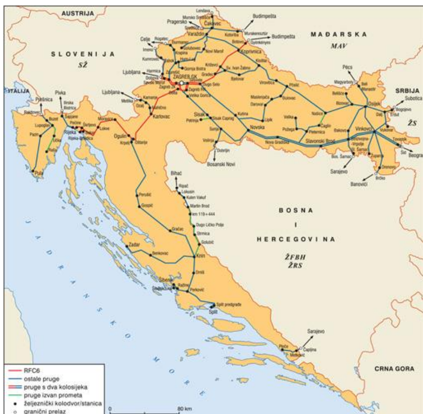
Slika 1. Mreža pruga u Republici Hrvatskoj