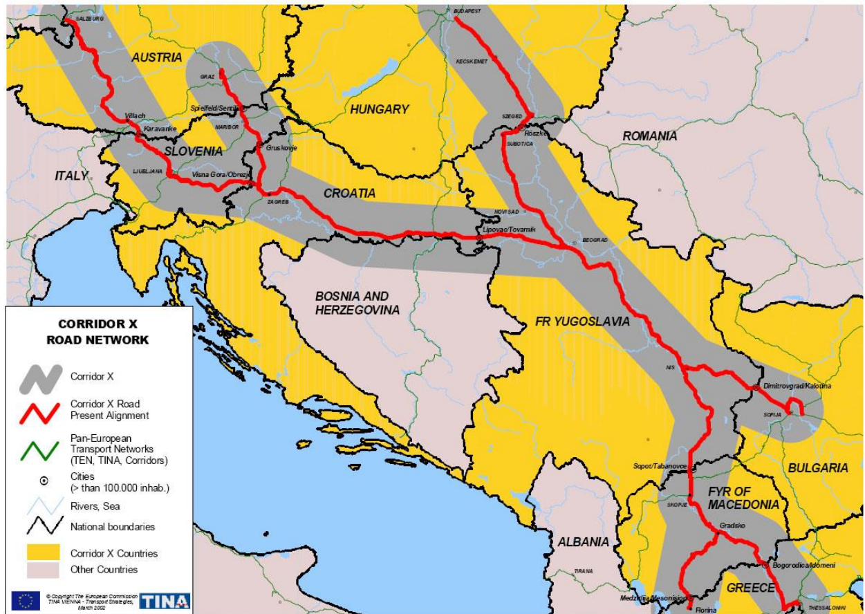
Slika 3. Prikaz X. željezničkog koridora