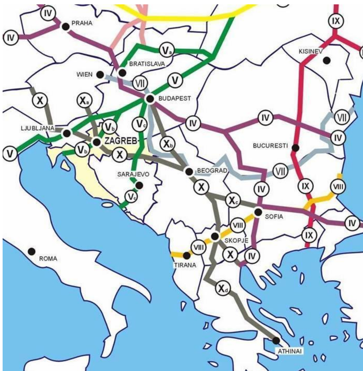
Slika 2. Prikaz paneuropskih prometnih koridora