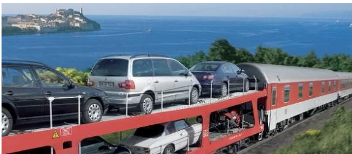
Slika 5. Prikaz prijevoza automobila željeznicom