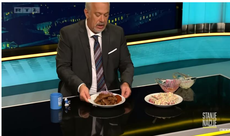
Slika 12. Screenshot „Stanje nacije“ emisija 07