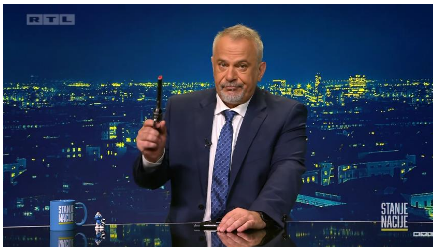
Slika 9. Screenshot „Stanje nacije“ emisija 02

je birao ministre, ne bi svako malo morao tražiti nove“. Šprajc poruku upućenu premijeru Andreju Plenkoviću završava paljbom iz plastičnog pištolja.