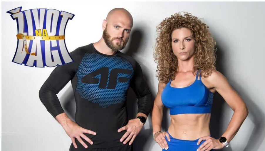
Slika 5. reality show „Život na vagi“