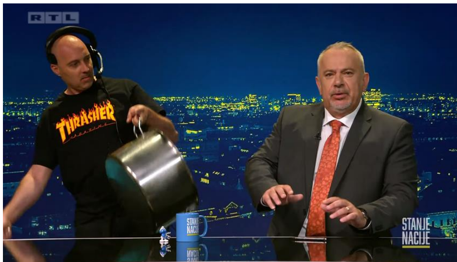
Slika 11. Screenshot „Stanje nacije“ emisija 05