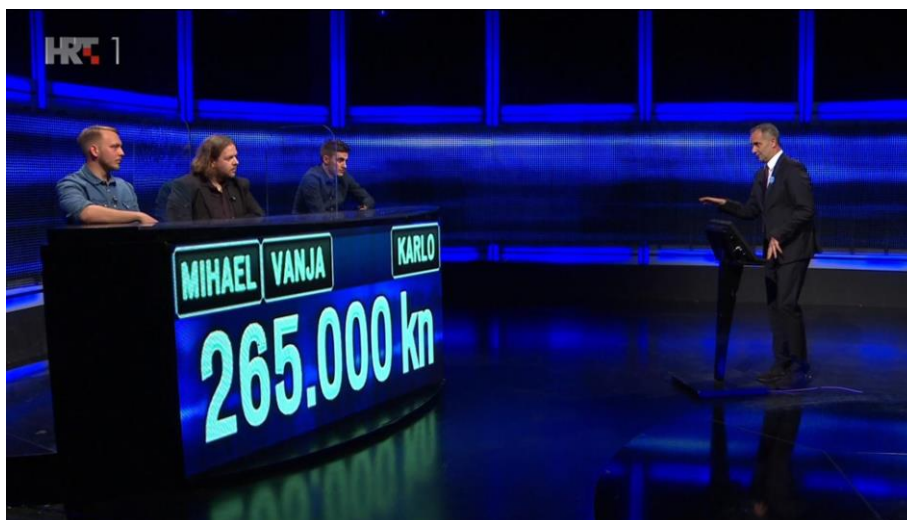
Slika 2. kviz „Potjera“

„Pametnan kao kokoš, tvrdoglav kao magarac“, dokumentarna je serija koja je svoje emitiranje od osam epizoda započela 3.1.2021. godine., na prvom programu HRT-a. 5 Voditelj emisije, Robert Knjaz, zajedno s domaćim i stranim stručnjacima donosi zanimljivosti o 12 različitih životinjskih vrsta. Robert Knjaz popularan je hrvatski voditelj infotainment emisija, kao što su dokumentarno-zabavna serija „Hrvatski velikani“ i dokumentarna serija „Najveće svjetske fešte“.