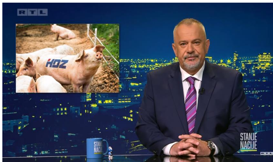
Slika 10. Screenshot „Stanje nacije“ emisija 04

istraživanja javnog mnijenja, koje ukazuje da država ide u lošem smjeru, barem tako građani kažu. S druge strane, ironično napominje da HDZ ide u ispravnom pravcu. Građani koji biraju HDZ tvrde da stanje u državi nije sjajno, dok taj isti HDZ za vrijeme nezadovoljstva građana gotovo uvijek. Šprajc je ovu ironičnu situaciju u prilogu komentirao ovako: „Kako raste pesimizam hrvatskih građana po pitanju smjera u kojem ide država, vidjeli ste tako da raste i povjerenje građana u HDZ, koji vodi državu u tom lošem smjeru. Zvuči kao sindrom bipolarnog poremećaja hrvatskih građana, može i to biti kad su u pitanju Hrvati, ni jedan sindrom ne treba isključiti. Ali uglavnom je riječ o tome da je HDZ-u najbolje, kad je državi najgore. Čim je neka pandemija, kuga, rat, nestašica, skupoća, inflacija, energetska kriza... Čim je neko takvo sranje, HDZ-u bolje stanje“. Za vrijeme Šprajcova govora u prilogu, kao što se može vidjeti na slici 9, prikazana je svinja sa žigom HDZ-a.