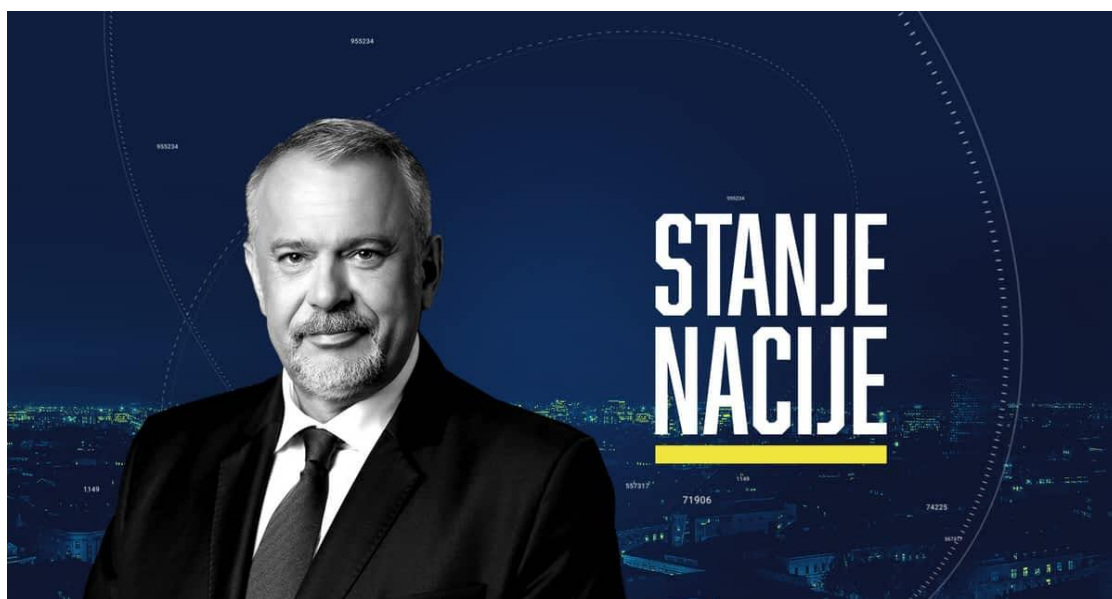
Slika 8. emisija „Stanje nacije“

Najkraće rečeno, Šprajc (rođ. 1968.) hrvatski je televizijski novinar, voditelj i producent kojeg gledateljstvo prepoznaje po britkim i duhovitim komentarima u svim informativnim emisijama koje je vodio. Nekadašnji je voditelj Dnevnika HRT-a te jedan od osnivača N1 kanala, izvorno podružnice CNN-a u Hrvatskoj. Svoju najpoznatiju ulogu kao medijska osoba odigrao je u informativnoj emisiji RTL Direkt, nakon čega postaje voditelj i urednik zabavno-informativne emisije „Stanje nacije“. 10