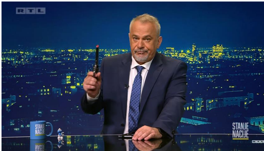
Slika 9. Screenshot „Stanje nacije“ emisija 02

je birao ministre, ne bi svako malo morao tražiti nove“. Šprajc poruku upućenu premijeru Andreju Plenkoviću završava paljbom iz plastičnog pištolja.