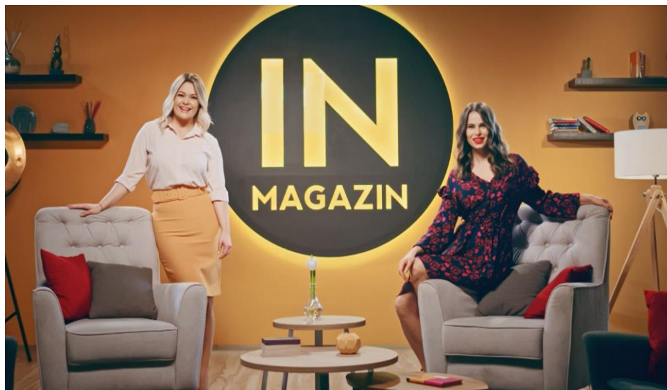
Slika 7. zabavni show „In magazin“

Televizijski show „In magazin“ jedan je od dugovječnih zabavnih formata Nove TV. Sadržaj ove emisije teme su iz svijeta slavnih i bogatih, životi lica domaće i strane scene te ostale društvene atraktivne teme. 9 In magazin svoju prvu emisiju emitirao je 26. siječnja 2009. godine. Voditeljice ovog showa su Mia Kovačić i Renata Končić Minea.