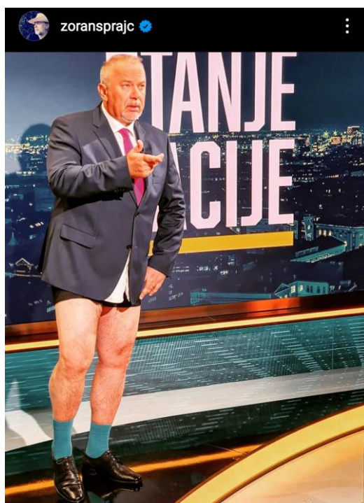
Slika 14. Screenshot Instagram

Prije samog završetka, Šprajc je prikazao analizu dosadašnjih emisija „Stanje nacije“. Televizijskih gledatelja u prosjeku svakog petka u terminu emitiranja ima između 350 tisuća i 400 tisuća. Na YouTube kanalu RTL televizije video klipovi emisije imaju 200 tisuća pregleda. Zahvalio se, stoga, gledateljima i dodao: „Odmorite se sljedećih nekoliko petaka od nas, a i mi od vas pa se vidimo krajem kolovoza. Obećavam da ćemo biti još gori nego što smo sada, kao što će i stanje nacije sigurno biti još gore“. Nakon odjave, Šprajc je u gaćama odšetao iz studija.