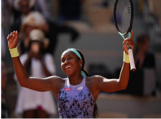
Coco Gauff celebrates her victory in the semi-finals of the French Open earlier today.