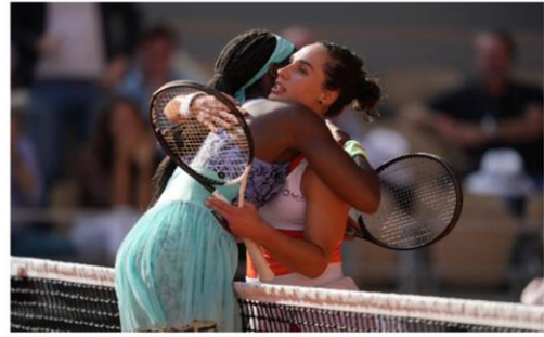
Gauff and Martina Trevisan hug following their match.

While Gauff's victory over Trevisan was somewhat foreseeable—the latter player is currently unseeded, and her ascent to the semi-finals has been described as a "Cinderella run"—a series of unforced errors got the match off to a rocky start. Yet once the second set rolled around, and Gauff masterfully broke Trevisan's serve in a tense 14-minute game midway through, the American player emerged triumphant.