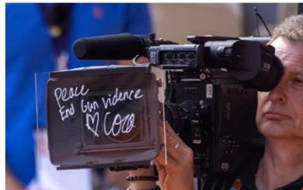
Slika 7.2.10. Primjer s portala Vogue

Following her victory today, when asked to sign the camera lens, Gauff used the moment to support the calls for stronger gun control in the United States following recent shootings in Buffalo, Uvalde, and Tulsa. Her message read simply: "Peace, end gun violence."