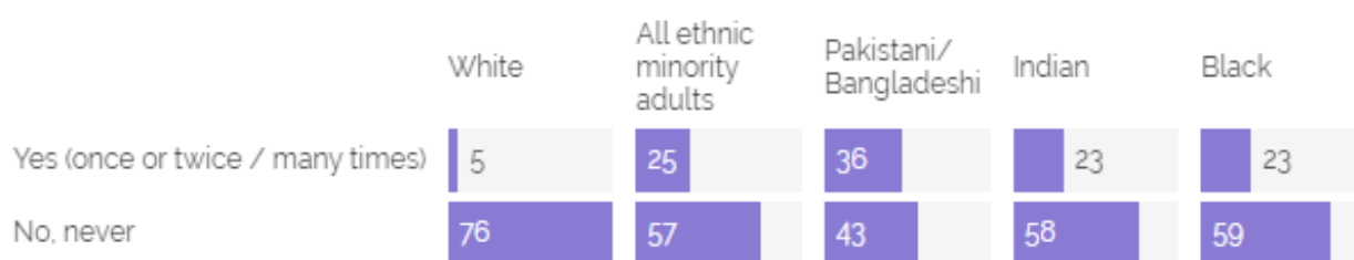
Slika 5.1. Prikaz postotka rasnog zlostavljanja kod nogometnih navijača putem društvenih mreža