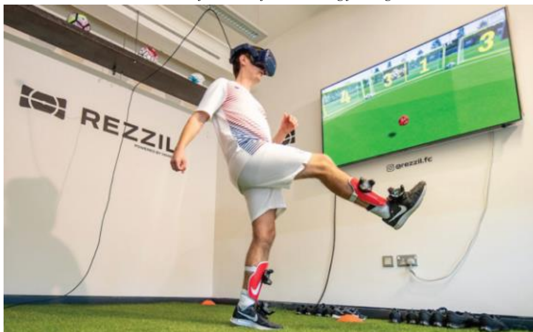
Slika 6.1. Primjer korištenja VR tehnologije u nogometu