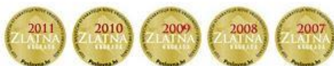
Slika 4. Osvojene nagrade