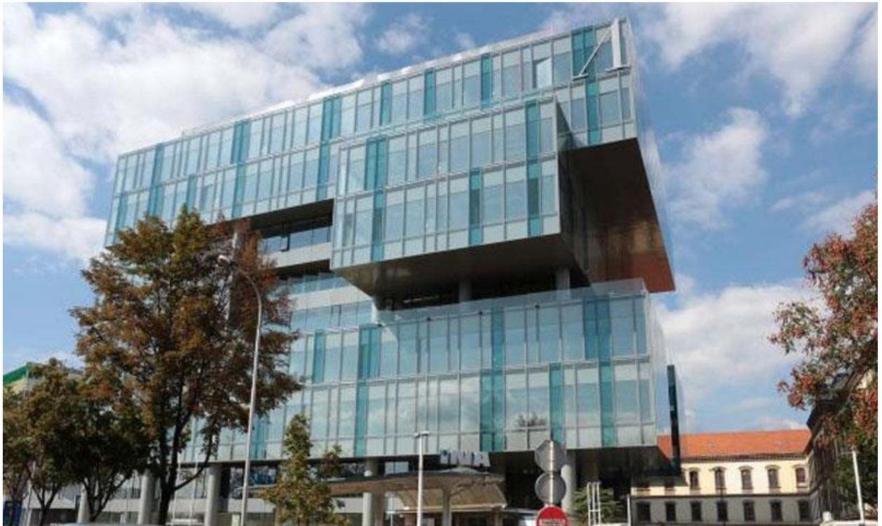
Slika 2. Poslovna zgrada Croatia osiguranja

„Croatia osiguranje osnovano je 1884. godine, kao jedna od prvih institucija hrvatskog nacionalnog identiteta. Od 2014. godine dio je rovinjske Adris Grupe, utvrdivši tako poziciju vodećeg osiguravajućeg društva u zemlji i predvodeći nove trendove u industriji.