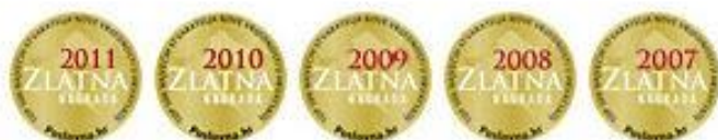
Slika 4. Osvojene nagrade