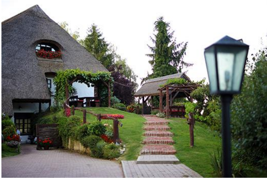
Slika 9. Restoran Podravska iža – Starigrad