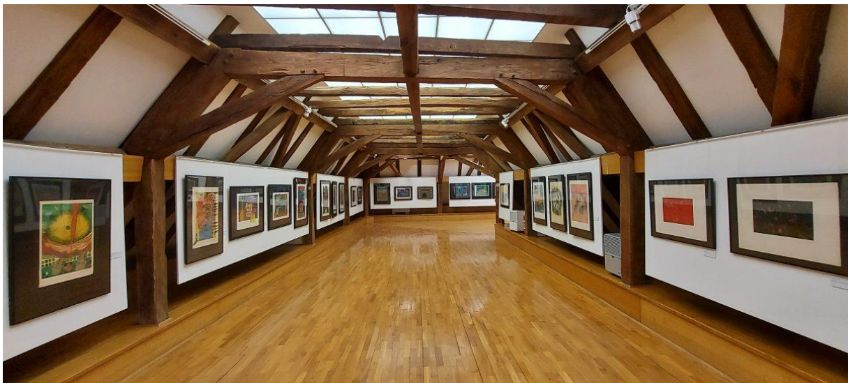
Slika 6. Izložba „Orijent&Okcident“ Hundertwasser i Hasegawa, Muzej grada Đurđevca