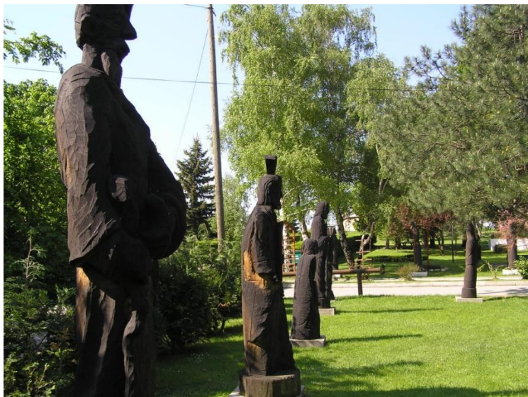
Slika 7. Biblijski vrt mira, Kalnik, izvor: Turistička zajednica Koprivničko – križevačke županije