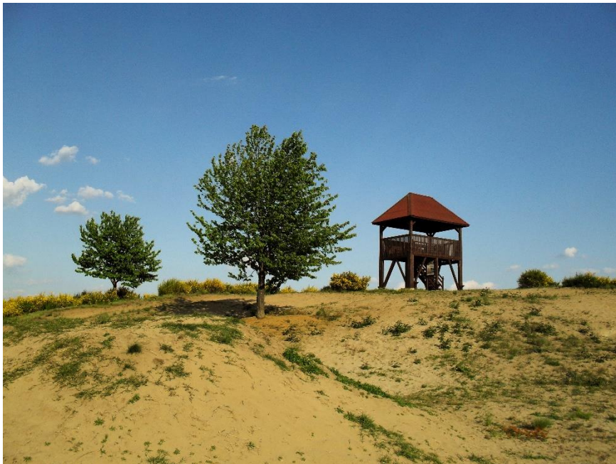
Slika 4. Đurđevački pijesci

Đurđevački pijesci – posebno –geografski botanički rezervat, jesu posljednji, nepošumljeni ostatat dugog pojasa Podravske pijesaka, tj. „Hrvatske Sahare“. Cilj je očuvati preostali dio pješčanih naslaga.