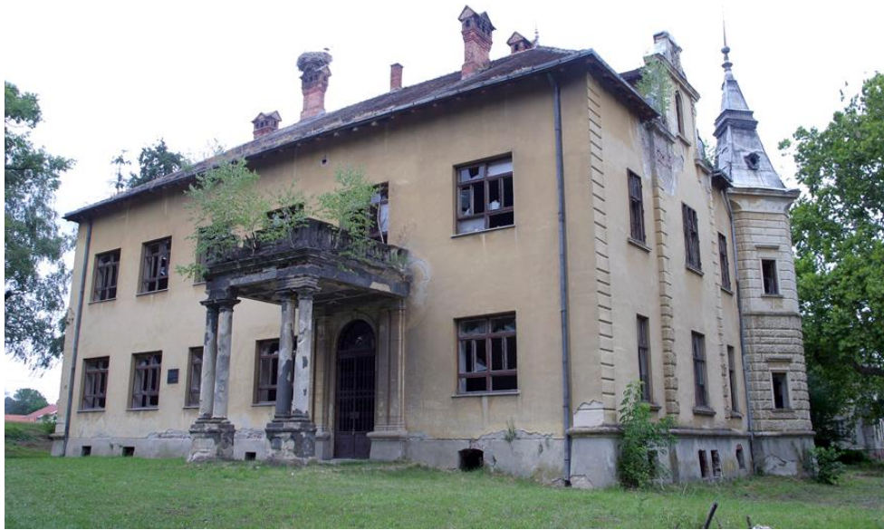
Slika 10. Dvorac Inkey, Rasinja