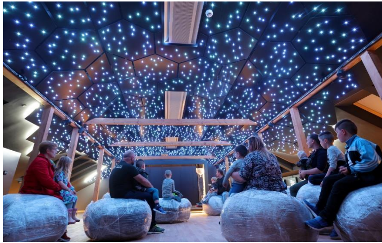
Slika 14. Posjetiteljski centar Đurđevački pijesci

neba gleda mitska priča, te se odlazi u preostalih 5 interaktivnih soba. Također, kupnjom ulaznice nude korištenje električnim biciklima kao ekološki prihvatljiv oblik prijevoza.