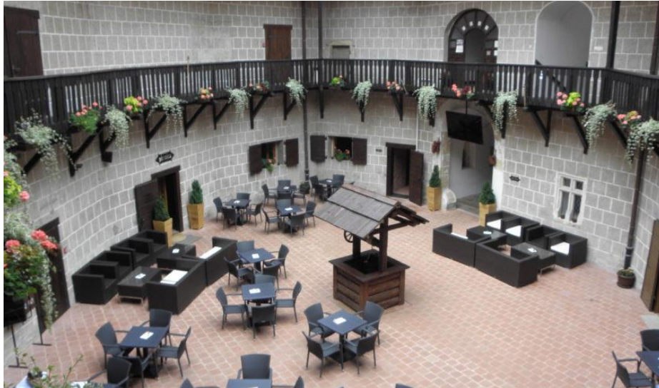
Slika 8. Restoran i pivnica Stari grad – Đurđevac