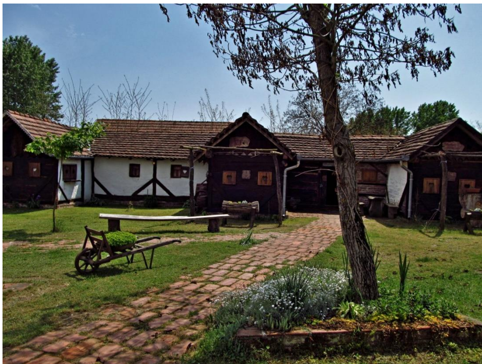
Slika 5. Etno kuća obitelji Karlovčan, Brodić, izvor: Turistička zajednica Koprivničko – križevačke županije

Etno zbirke su specijalna vrsta „muzeja“ u kojem se sakupljaju, čuvaju, izlažu, proučavaju, objavljuju te populariziraju predmeti i druge vrste dokumenata koji svjedoče o načinu života i kulturi pojedinih ljudskih zajednica ili društava u različitim povijesnim razdobljima. U Koprivničko – križevačkoj županiji brojimo 4 etno zbirke, a to su: Etno – kuća Večenaj, Etno muzej Slavko Čamba, Etnografska zbirka Josipa Cugovčana, Etno kuće obitelji Karlovčan.