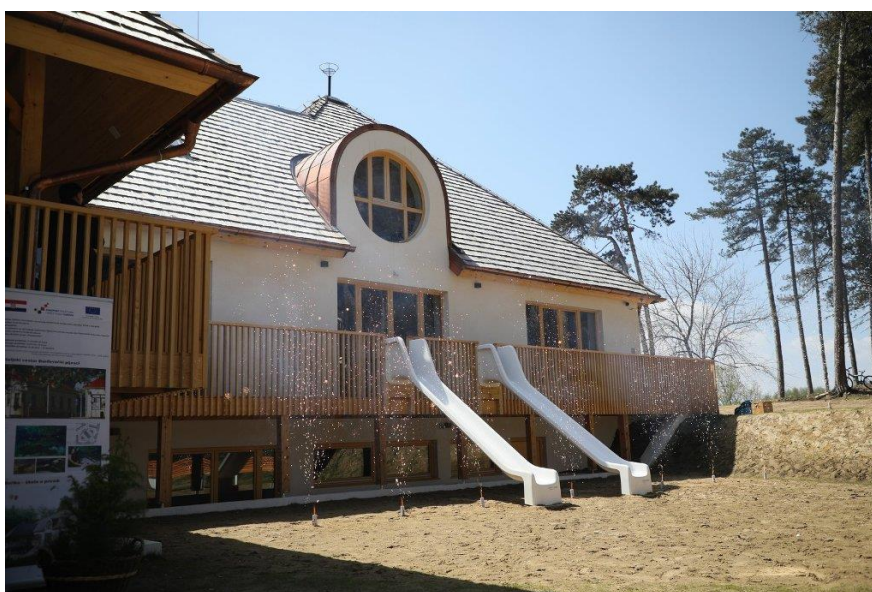
Slika 13. Hostel Borik, Đurđevac

Hostel Borik u Đurđevcu otvoren je 2021. godine kao projekt prirodne baštine te je ujedno i nadogradnja na Hrvatsku Saharu i Muzej Grada Đurđevca. Kapacitet je 50-tak djece, te je u 2022. godini uvedena mogućnost hrane (petak, subota, nedjelja) za sve posjetitelje.