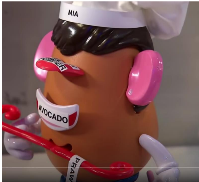
Slika 3 Slika zaslona igračke korištene u izazovu kao primjer infotainmenta

novih kandidata protiv veterana. Drugi odličan primjer je šesta epizoda pod nazivom „Hot Potato“. Epizoda je dobila takav naziv zbog „posebnog gosta“ - igračke krumpira koja se naziva „Mr. Potato Head“. Zadatak je bio složiti svoju igračku krumpira pomoću nastavaka, odnosno dijelova tijela na kojima su pisale namirnice s kojima se mogu služiti u pripremi svoga jela. Na slici broj tri nalazi se primjer kako je to izgledalo.