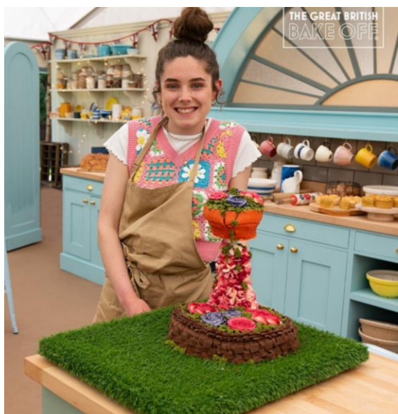
Slika 2 Prikaz infotainmenta na primjeru torte koja prkosi gravitaciji – pr. 2

Ovo je odličan primjer kako zabaviti gledatelje, a ujedno i izazvati kandidate. Kreiranjem neobične slastice kroz spoj tradicionalnog i inovativnog, kandidati pokazuju koliko su zapravo kreativni. Sentimentalnim dijelom nastoje bolje upoznati publiku sa samim kandidatima i u njima pobuditi suosjećajnost. Zadatak sam po sebi može biti jedna od karakteristika infotainmenta jer povezuje informacije sa zabavnim efektima, a u ovom slučaju je zabava i zadatak i način dekoriranja.