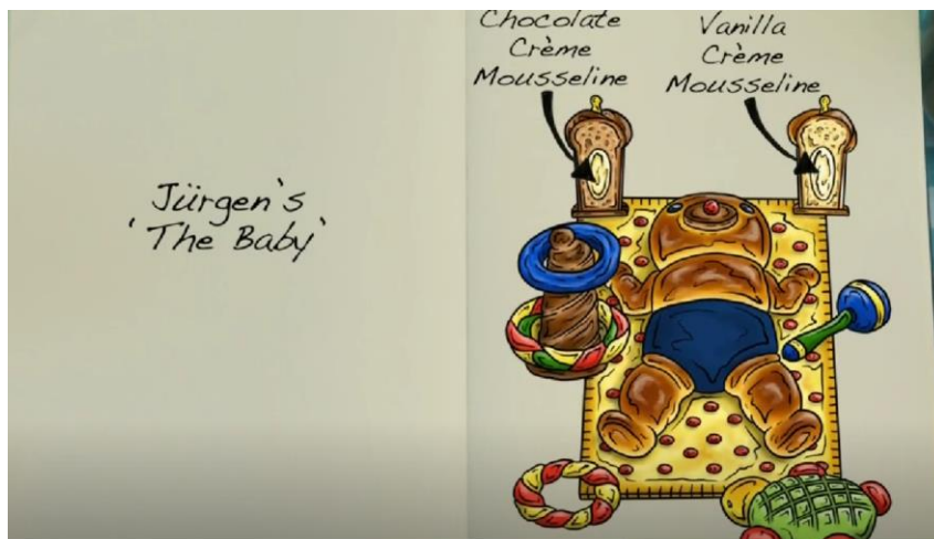
Slika 4 Primjer grafičkog prikaza receptata

Uz sve nabrojeno, vidljivo je nekoliko zanimljivih zabavnih stavki koje nisu svrstane u analitičku tablicu, ali su izdvojene kroz kvalitativnu analizu sadržaja. „The Great British Bake Off“ služi se vizualnim i grafičkim alatima kako bi gledateljima dočarali svaki recept koji kandidati pripremaju. Tako je na početku izrade slastica za svakog kandidata pripremljena grafička skica izgleda slastice, njen naziv te od čega se sastoji. Primjer se nalazi na slici broj 4.