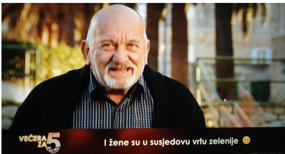
Slika 6 Primjer humorističnog opisa iz šoua Večera za 5 na selu

U oba RTL-ova šoua, humor se može vidjeti kod kandidata koji su veoma opušteni prijateljski nastrojeni. Način na koji se humor prezentira u kulinarskim emisijama je svakako način zabave gledatelja, no to nužno ne mora biti infotainment . Klasičan humor (na koji smo navikli) ne pripisujemo infotainmentu , dok humoristični opisi koji nastoje iznijeti određenu informaciju mogu biti infotainment , iz razloga što to rade na zabavan i drukčiji način.