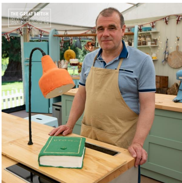
Slika 1 Prikaz infotainment na primjeru torte koja prkosi gravitaciji – pr.1

„Hell'sKitchen“ je vrsta šoua koja ne koristi humor kako bi privukla svoje gledatelje. Način komunikacije i koncept ovog šoua je potpuno drukčiji od svih ostalih. Korištenje žargonizma, psovki i vulgarnih riječi njegova je karakteristika. Sljedeća kategorija analize su recepti, odnosno jela. U „The Great British Bake Offu“ i „Hell'sKitchenu“ su standardna, klasična jela prikazana kroz drukčije i inovativnije recepte, a u „MasterChefu“ su znatno kompliciraniji recepti i jela iz raznih krajeva svijeta s nesvakidašnjim namjericama. Najviše zabavnih značajki u hrani i dekoriranju prisutno je u „The Great British Bake Offu“. Način na koji žiri kreira zadatke za kandidate svakako je najzanimljiviji i najzabavniji od svih ostalih zadataka iz analiziranih šouova. Svaki showstopper zadatak od kandidata traži da kreiraju određeni recept na način da ga ukrase vrlo neobično. Na primjer, u prvoj epizodi kandidatima je zadano kreirati tortu kao predmet koji prkosi zakonima gravitacije, a ima određenu sentimentalnu vrijednost koja ih podsjeća na njihovo djetinjstvo.