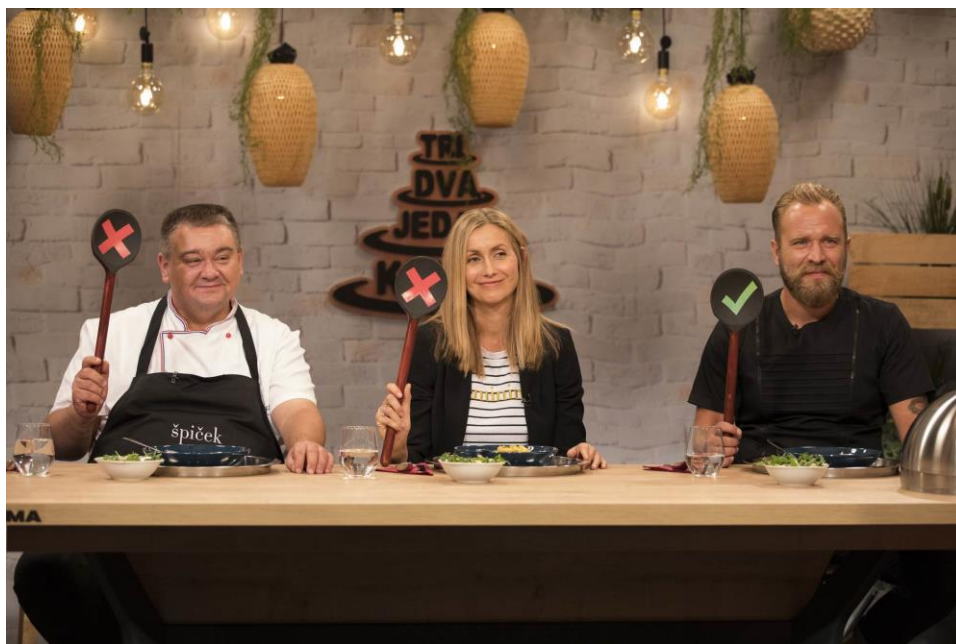
Slika 8 Primjer infotainmenta na načinu ocjenjivanja

Suma summarum ove analize kulinarskih šouova s hrvatskog govornog područja je vrlo jasna. Bez sumnje, svaki šou sadrži značajnu zastupljenost zabavnih elemenata, koji su naznaka infotainmenta te se pretežito i većina novijeg sadržaja kreira upravo tako da bi bila infotainment . Šou „MasterChef“ odlika je kulinarskog reality šoua sa značajnom dozom infotainmenta , odnosno zabavnih elemenata. Nakon njega slijedi „Tri, dva, jedan – kuhaj!“, koji također sve više koristi i kreira sadržaj s ciljem gledanosti i zabave publike, a cilj edukacije gledatelja više nije u prvotnome planu. „Večera za 5 na selu“ jest šou koji također sadrži određenu dozu zabave s naznakama infotainmenta koja je, u usporedbi s ostala dva šoua, znatno manja. U ovome je šou primjetno da sve više naginje infotainmentu kako bi uopće opstali na tržištu u usporedbi s ostalim kulinarskim emisijama.