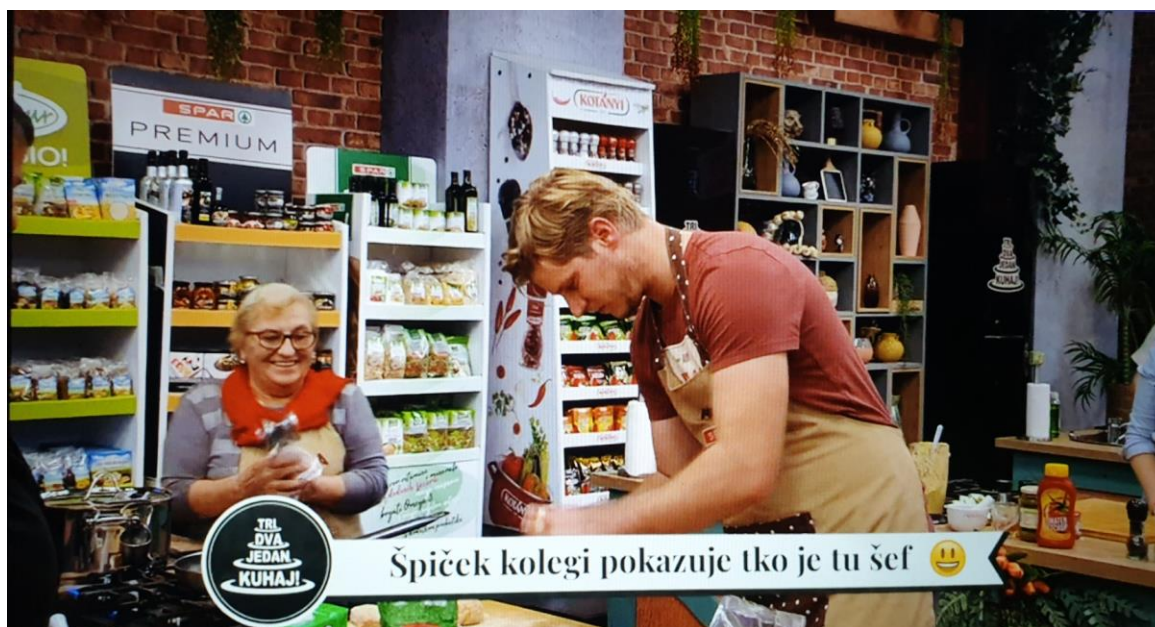
Slika 5 Primjer humorističnog opisa iz šoua Tri, dva, jedan – kuhaj!

Princip analize jednak je onoj prethodnoj s engleskog govornog područja. Kategorije i potkategorije u ovoj analizi sadržaja također su određene na isti način, kako bi se što preciznije analizirali elementi infotainmenta (na temelju zastupljenosti zabavnog sadržaja) u emisijama hrvatskog govornog područja. Prva kategorija u analizi je humor. Iz tablice su vidljiva dva najhumorističnija šoua – „Tri, dva, jedan – kuhaj!“ i „Večera za 5 na selu“. Ove dvije emisije imaju poprilično jednako izražen humor te su vrlo slično koncipirane. Pretpostavka je da sličnosti nisu neobične jer se oba šoua emitiraju na RTL-u, od strane iste produkcije, pa su tako npr. na dnu kadrova izraženi humoristični opisi, često popraćeni emojijima , kojima se opisuje određena situacija na što zanimljiviji način. Slika 5 prikazuje navedeni primjer humorističnog opisa iz šoua „Tri, dva, jedan – kuhaj!“.